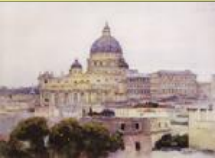
В.И. Суриков. Собор св. Петра