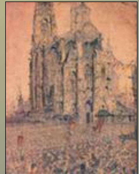
Джеймс Энсор. Собор.