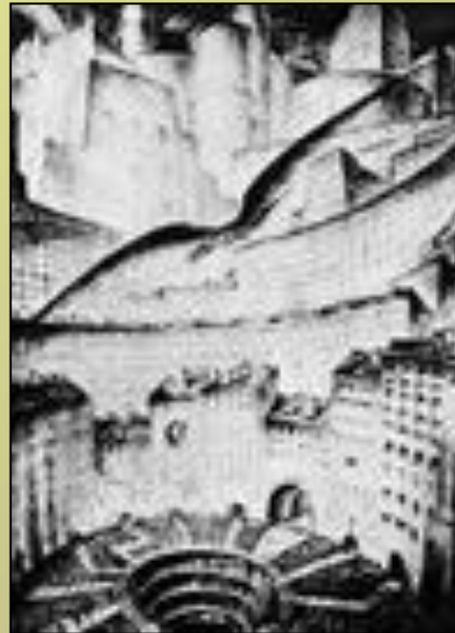
М.В. Добужинский. Из цикла «Городские сны»