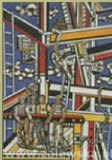
Фернан Леже. Строители