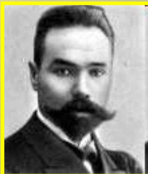
В.Я. Брюсов – символист, поэт XX века