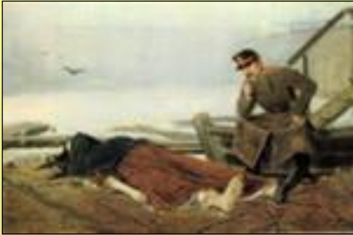
В.Г. Перов. Утопленница