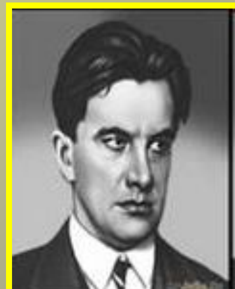
В.В. Маяковский – футурист, поэт XX века