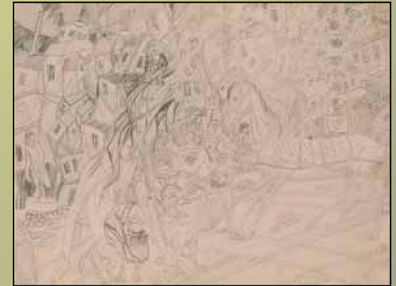
П.Н. Филонов. Формула городского