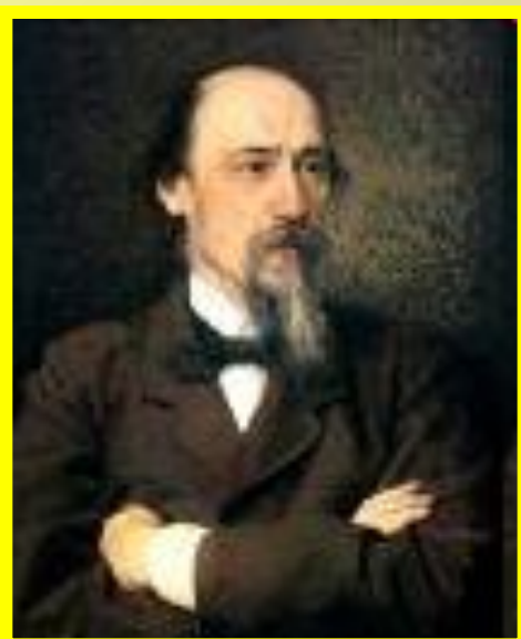
Н.А. Некрасов – реалист, поэт XIX века