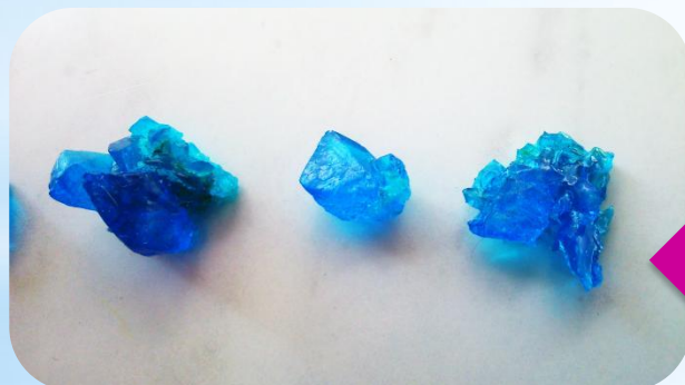
Вещество голубого цвета (медный купорос)