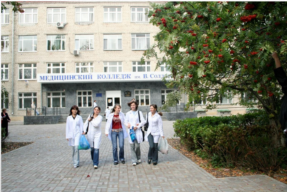
Тобольский медицинский колледж им. Володи Солдатова