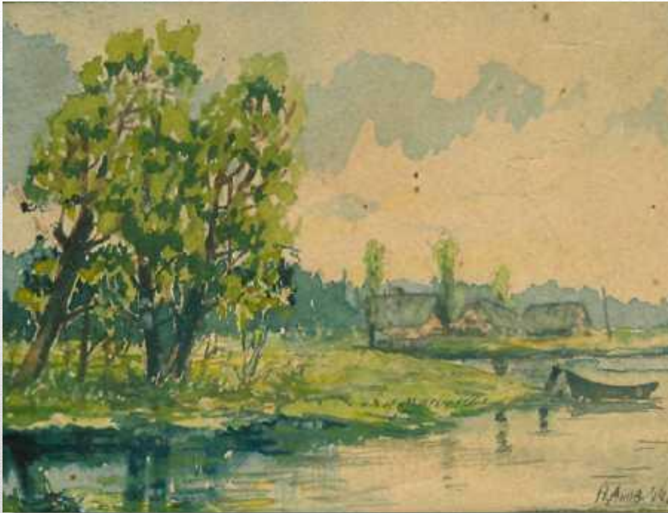
Село Карачино – место рождения Володи