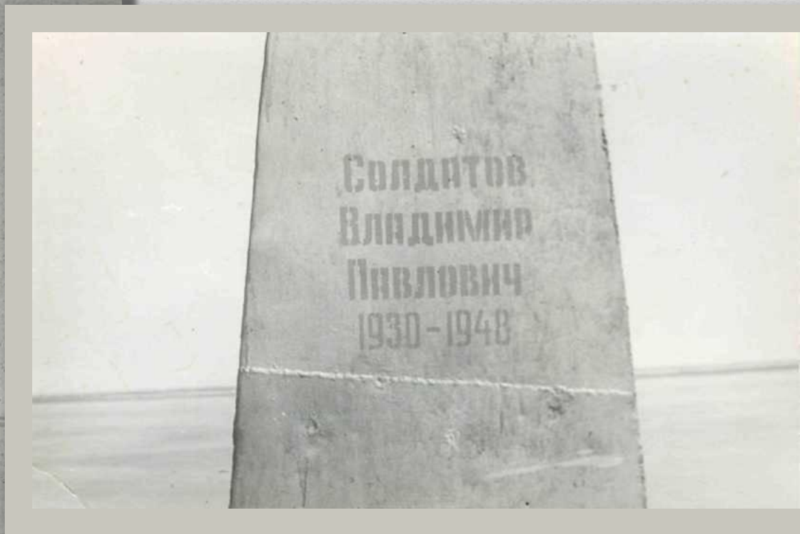
Памятный обелиск посвящённый В. Солдатову