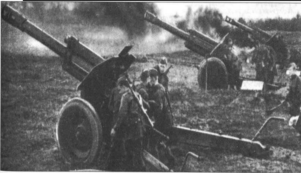
Первые гаубицы Д-1 на передовой. Лето 1943 года

Переломным этапом в отношении к гаубицам стало наступление под Москвой и дальнейшие действия Красной Армии в 1942 году. Стало понятно, что армия переходит в наступление. А значит скоро потребуются мощные, мобильные артсистемы.