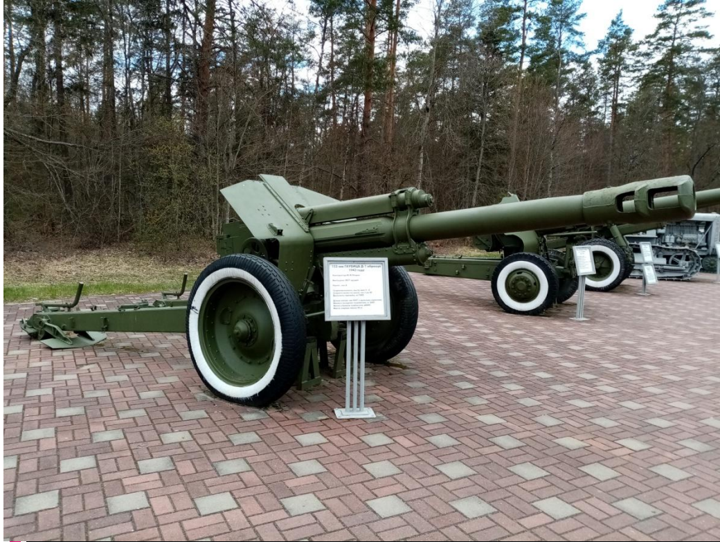
Гаубица Д-1 -30 в экспозиции Мемориального комплекса «Партизанская поляна», 2020 год

Появление в 1943 году гаубиц Д-1 значительно повысило мобильность советских танковых и моторизованных частей. Гаубица, благодаря своей «скороходности», успевала за стремительно наступавшими частями Красной Армии.