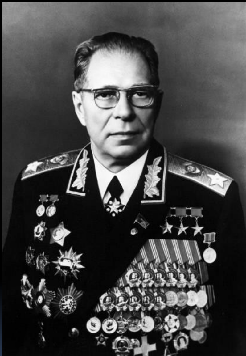
Дмитрий Фёдорович Устинов (1908-1984 гг.)

Но необходимо вспомнить и ещё одного человека. Человека, который хоть не являлся конструктором артиллерийских систем, но без поистине «гаубичного» по пробиваемости решений на всех уровнях характера, без его организаторских способностей, судьба шедевра могла сложиться не так триумфально.