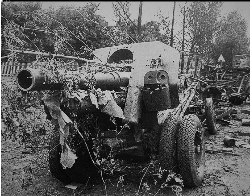
Советская 152-мм. гаубица образца 1938 года (М-10), захваченная немецкими войсками

В 1941 году по ряду причин было прекращено серийное производство 152-мм гаубиц образца 1938 года (М-10), предшественницы гаубицы Д-1.