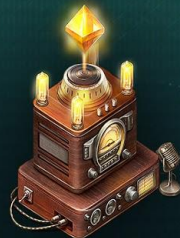
Радио Квесты и инвенты