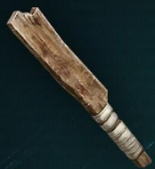
Доска с тряпками