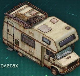
Старый дом на колесах