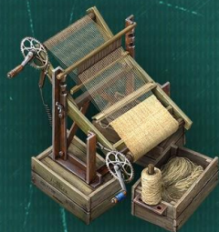
Ткацкий станок Ткань для одежды