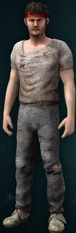
Выживший I уровня

С каждым уровнем игрок получает доступ к новому оружию, броне и косметическим предметам.