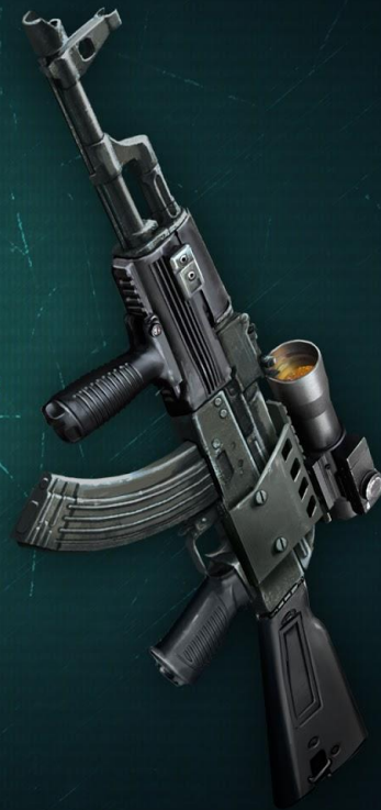
АКМ спецотряда "К"