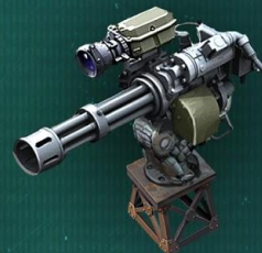
Автоматическая турель для защиты Убежища