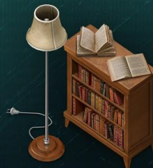
Декор Создает уют