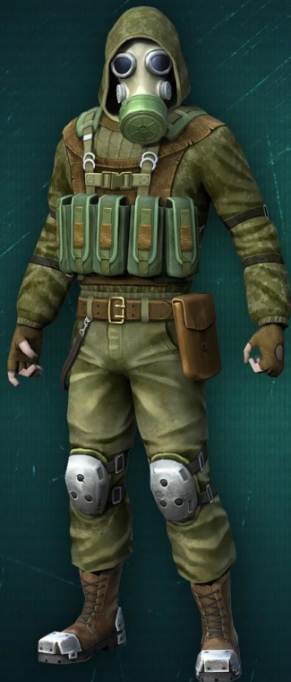
Выживший 30 уровня