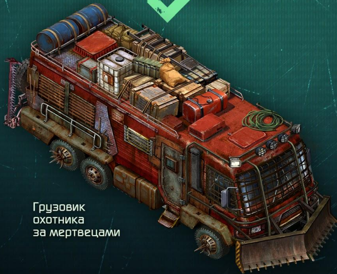
Грузовик охотника за мертвецами