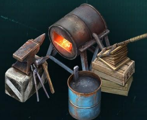
Кузница Переплавка металла