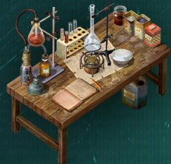
Лабораторный стол Взрывчатка и медикаменты

Чтобы строить и создавать продвинутые станки и предметы, игрок добывает и производит новые материалы.