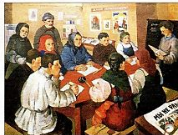
«Ликбез» Худ. А.В. Казаков

Ликбез — ликвидация безграмотности после установления советской власти.