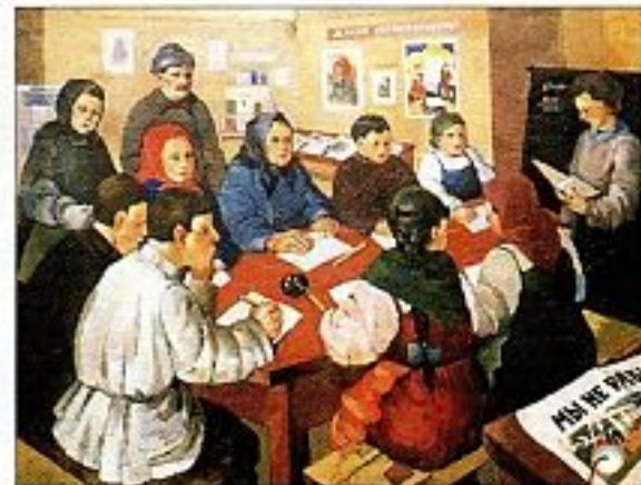
«Ликбез» Худ. А.В. Казаков

Ликбез — ликвидация безграмотности после установления советской власти.