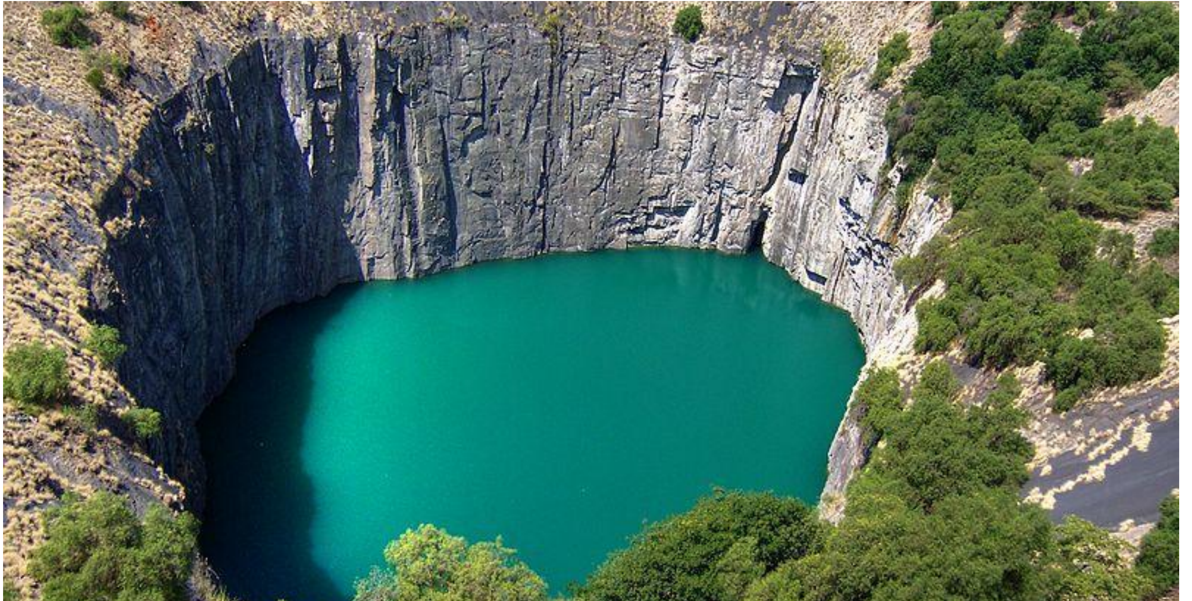
Кимберлитовая трубка «Большая дыра»