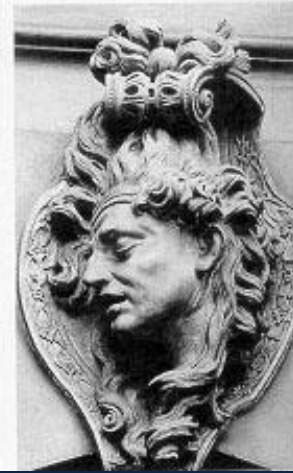
Андреас Шлютер. Арсенал в Берлине и его скульптурный декор. 1695-1706