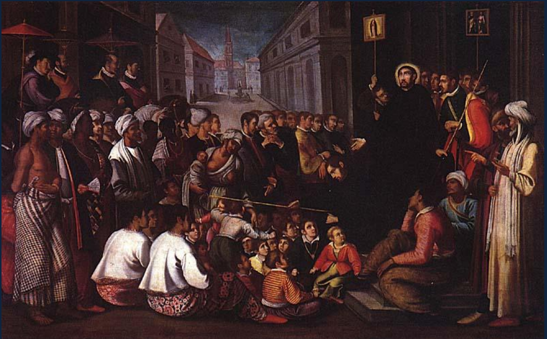
Андре Рейнозу. Св. Франциск Ксаверий проповедует в Гоа. Ок.1619. Церковь Сан-Рок, Лиссабон