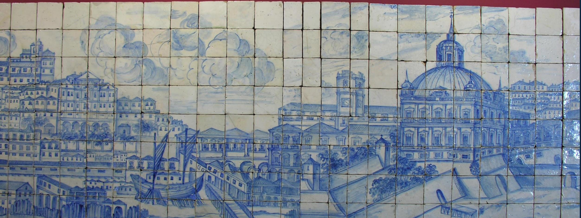
Габриэл дел Барку. Большая панорама Лиссабона. Ок.1700