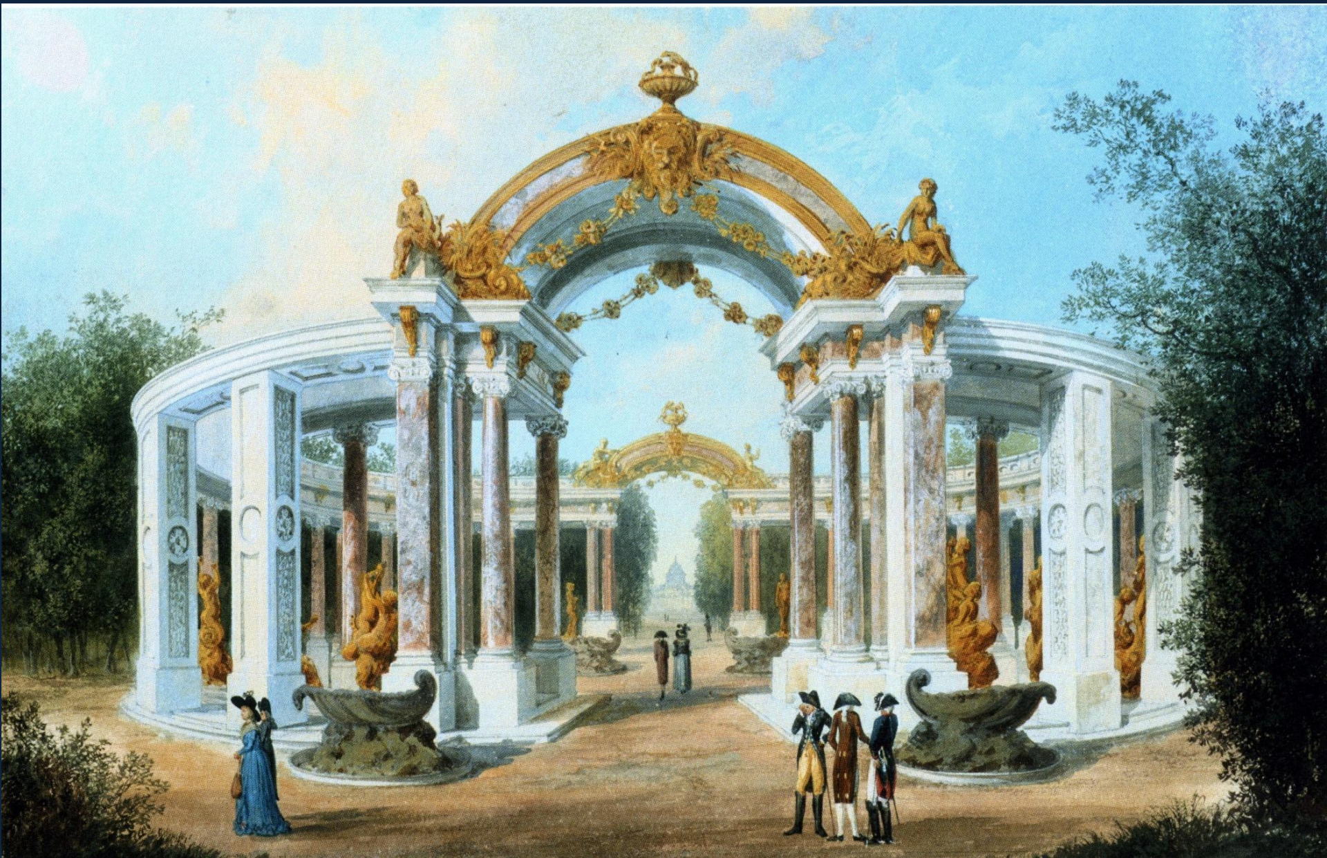
Колоннада в центре главной аллеи. Построена в 1751—1762 годах по проекту Георга Венцеслауса фон Кнобельсдорфа, снесена по ветхости в 1797 году. Акварель Иоганна Фридриха Нагеля. ок. 1792