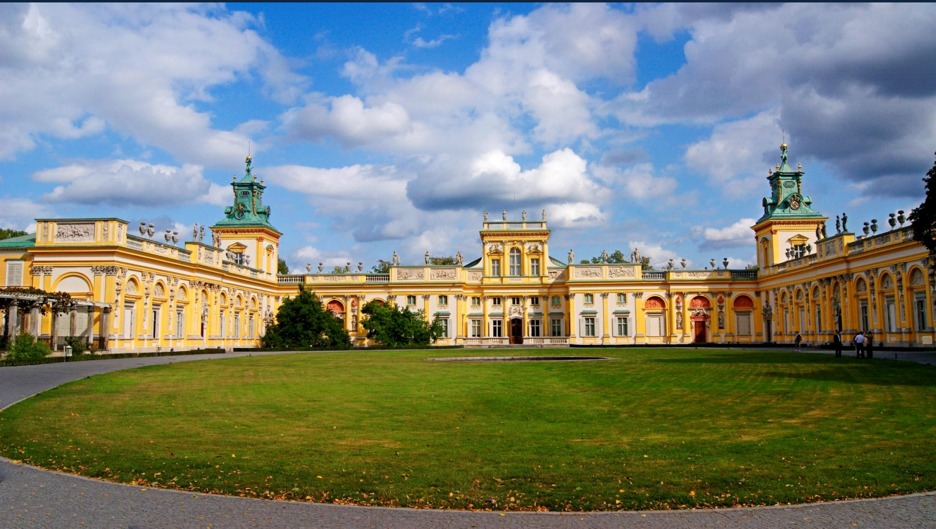
Андреас Шлютер. Дворец Собесских. 1677-1696