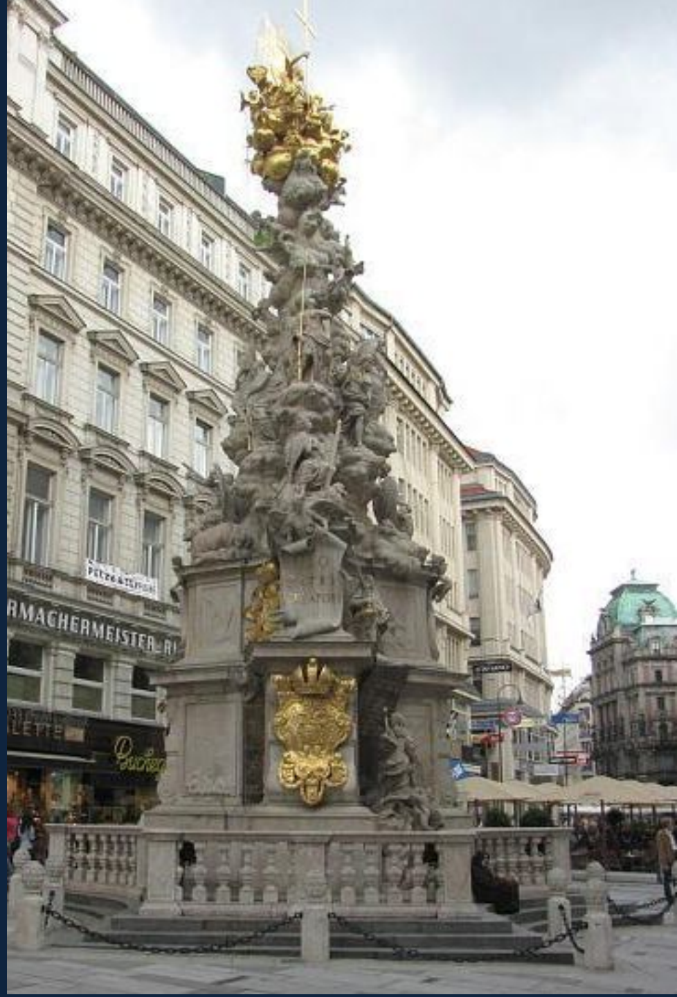
Чумной столп. Грабен, Вена

TIBI REGI SOECULORUM IMMORTALI: UNI IN ESSENTIA ET TRINO IN PERSONIS, DEO: