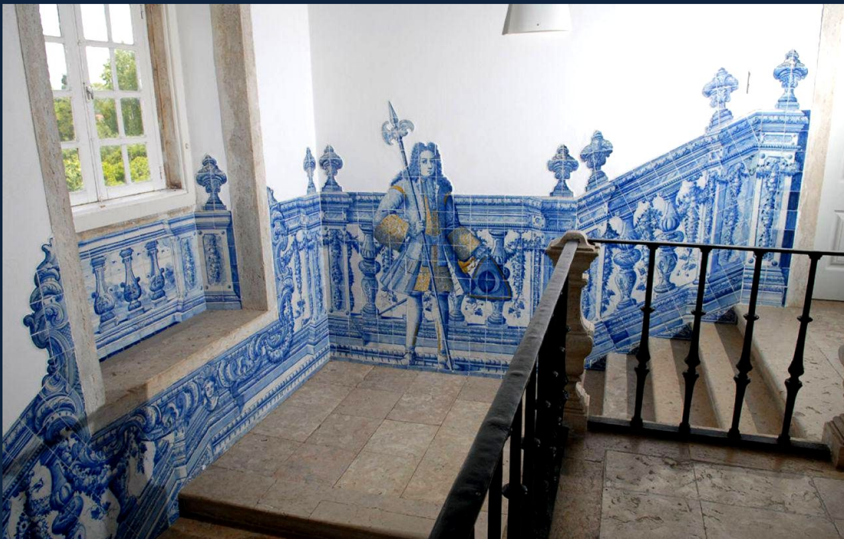
Мастер Р.М.Р. «Приглашающая фигура» в старом дворце патриарха. Ок.1730. Лиссабон