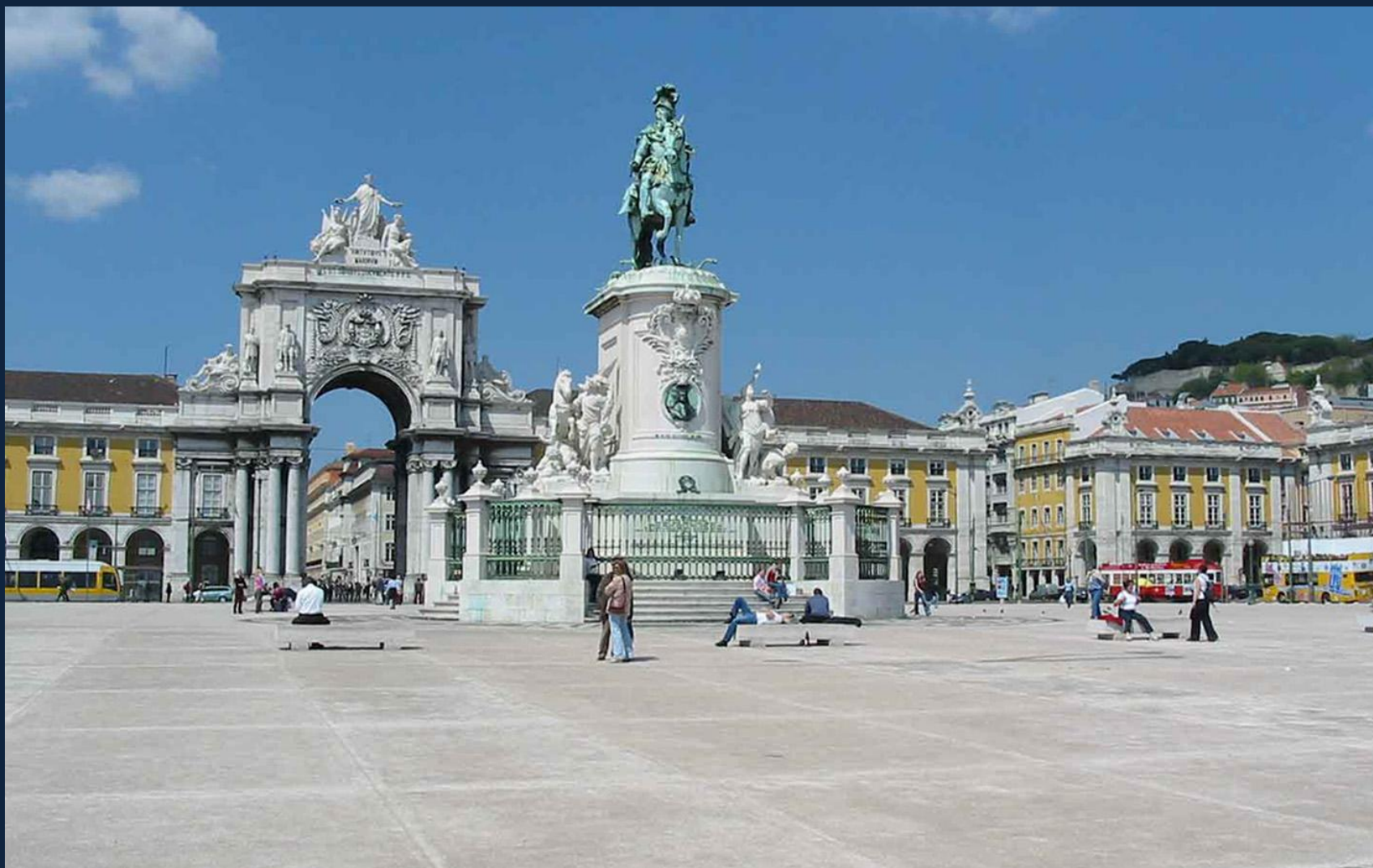
Площадь Коммерции в Лиссабоне. Машаду де Каштру. Конная статуя короля Жузе I. Открыта в 1775.