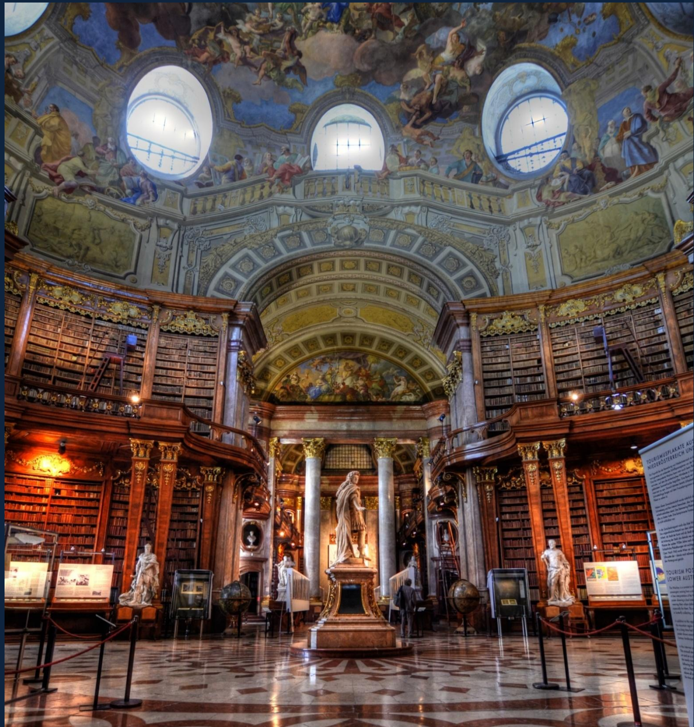
Отец и сын Фишер фон Эрлах. Главный зал Императорской библиотеки. 1722-1735. Вена