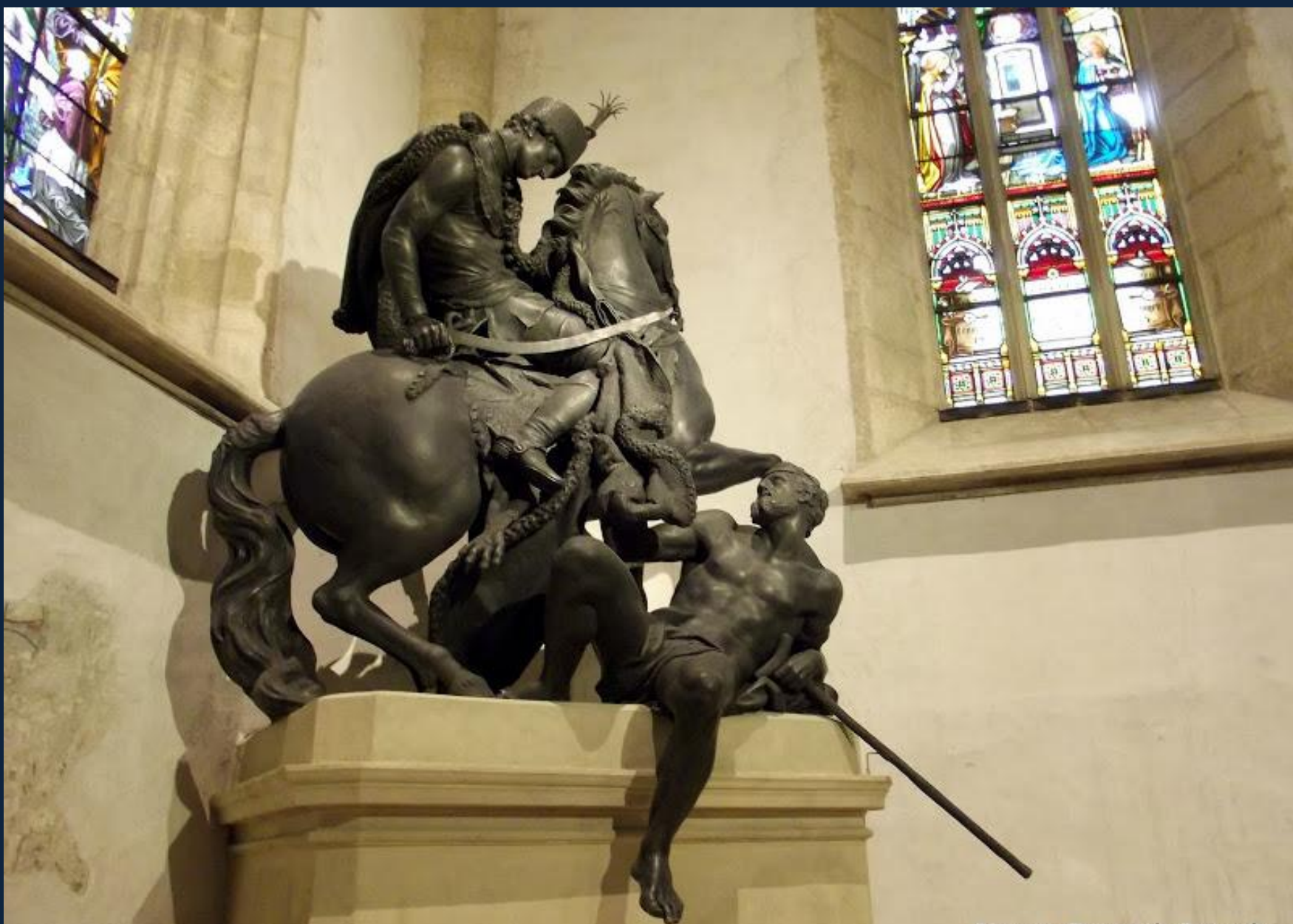
Георг Рафаэль Доннер. Св.Мартин и нищий. 1740. Церковь Св.Мартина, Братислава