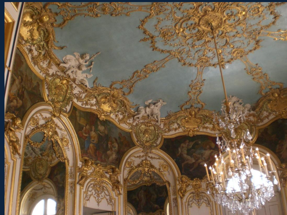
Ж.Бюффран, Ш.Ж.Натуар. Отель Субиз. 1735-1738 Париж