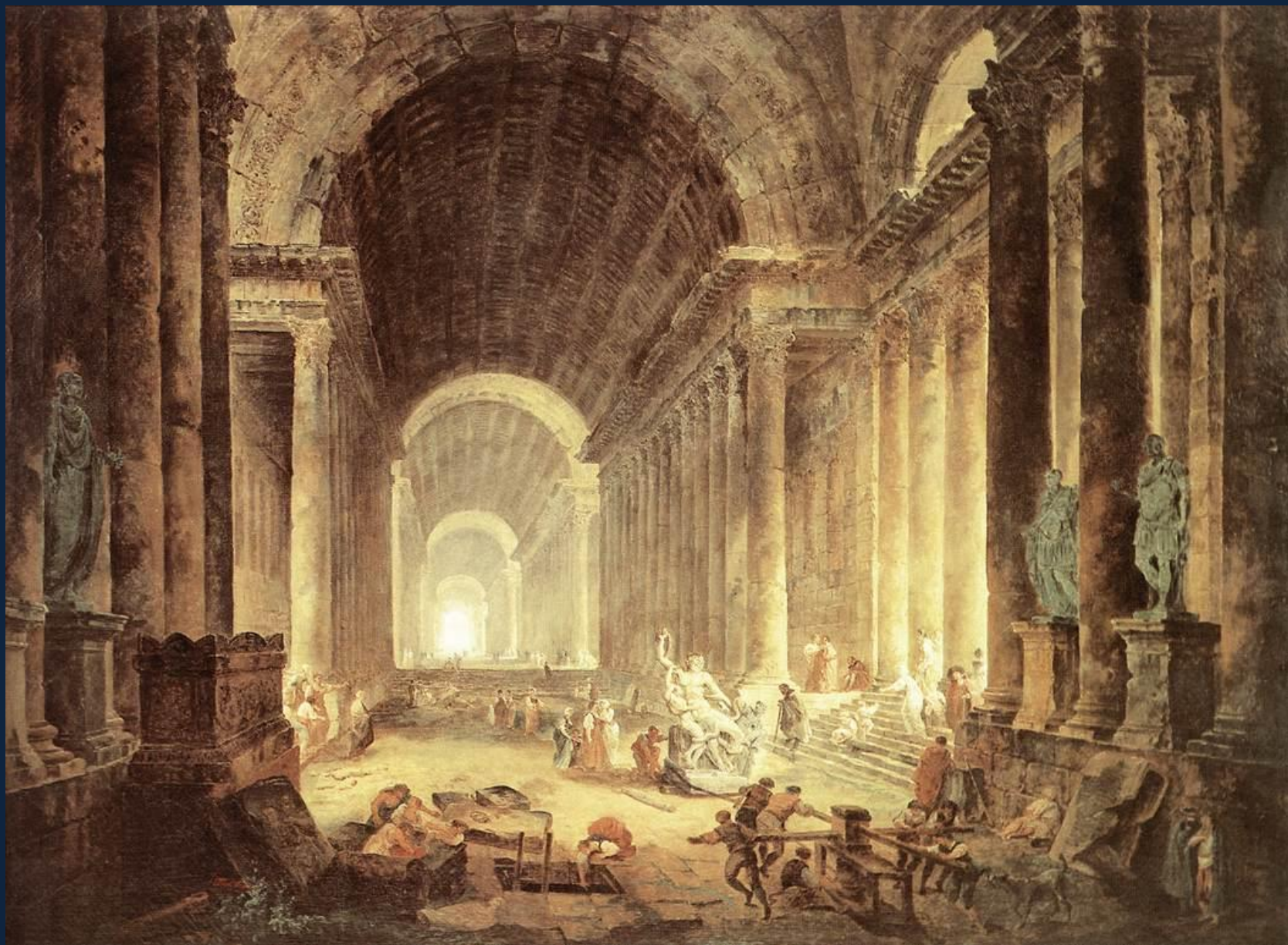
Гюбер Робер. Нахождение статуи Лаокоона. 1773 Музей в Ричмонде