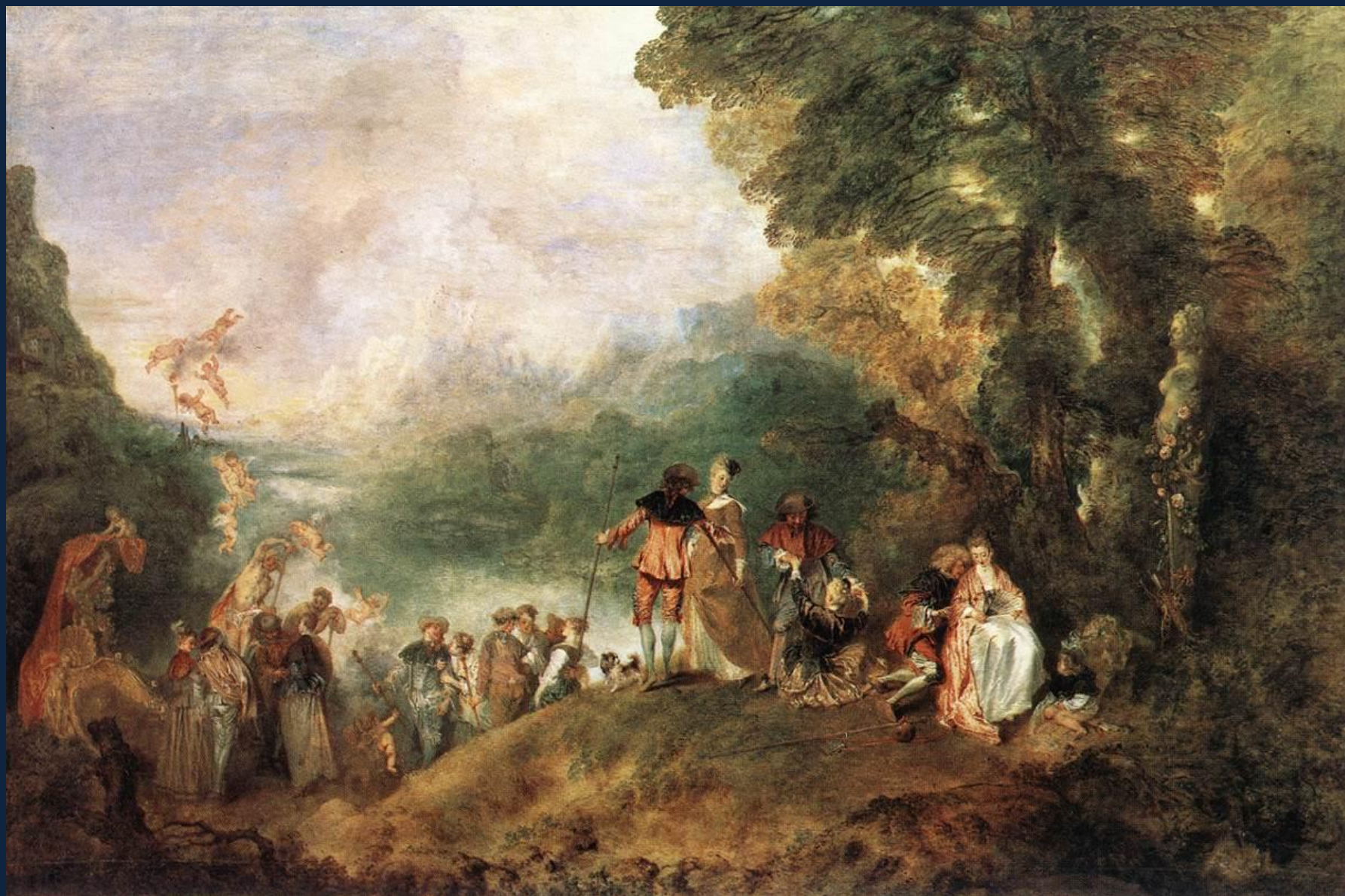
Антуан Ватто. Отплытие на остров Киферу. 1717. Лувр