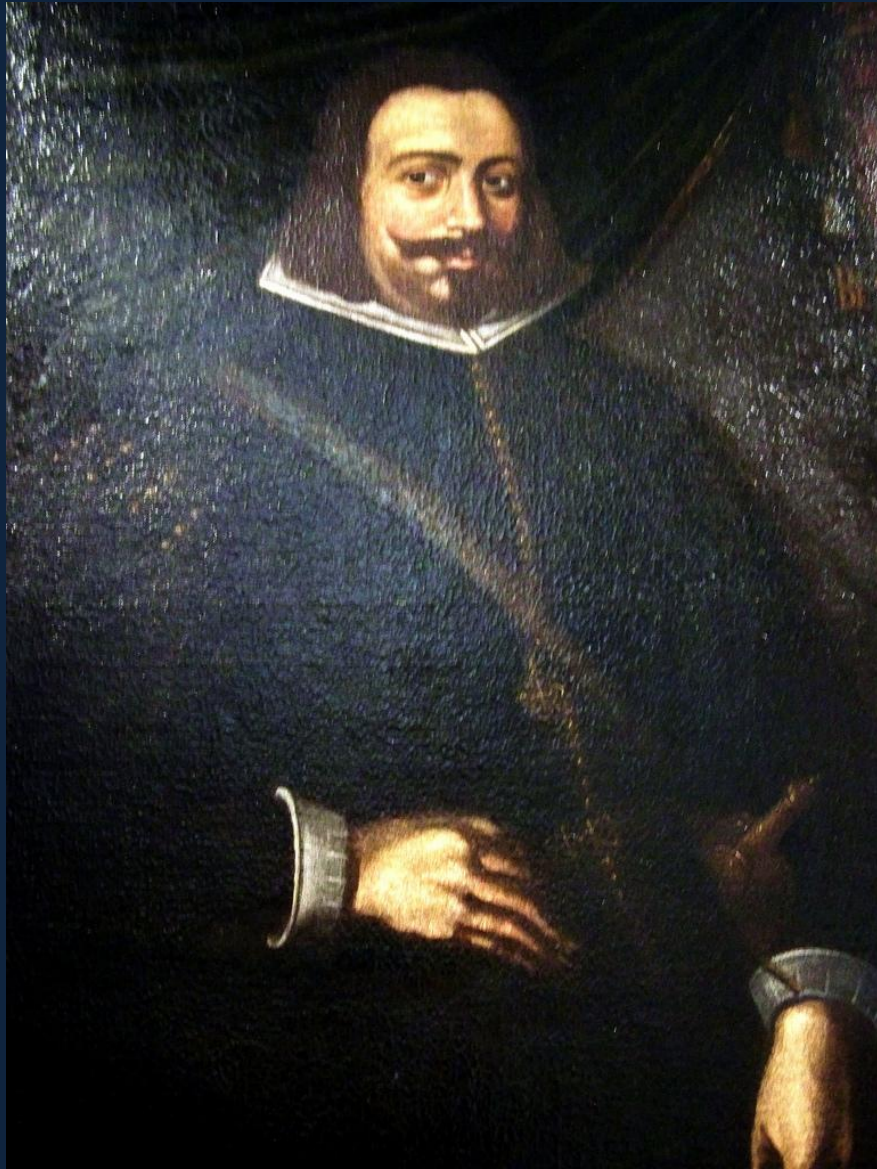
Авелар Ребелу. Портрет Жуана IV. С.1642. Музей карет, Лиссабон