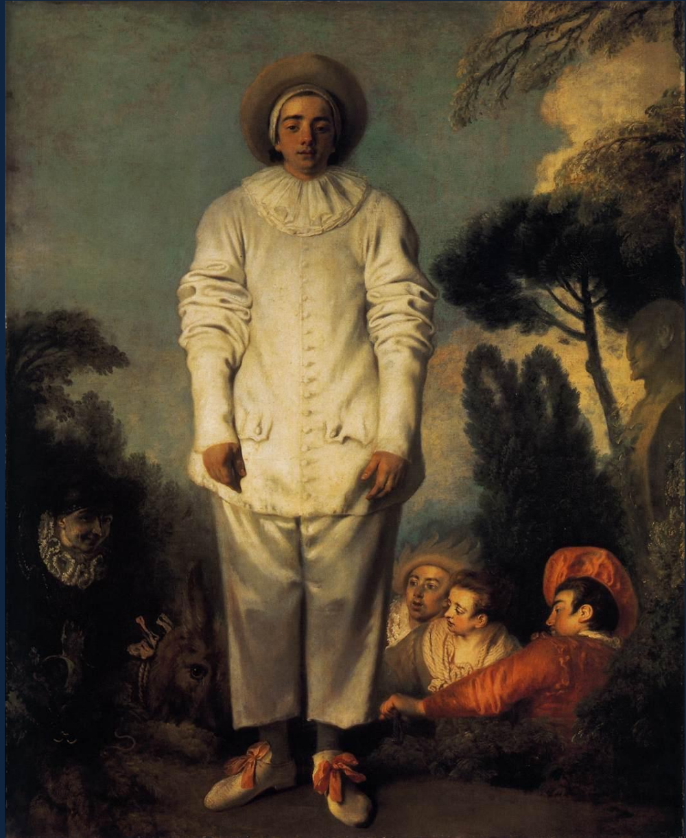
Антуан Ватто. Жиль. 1718-1720 Лувр