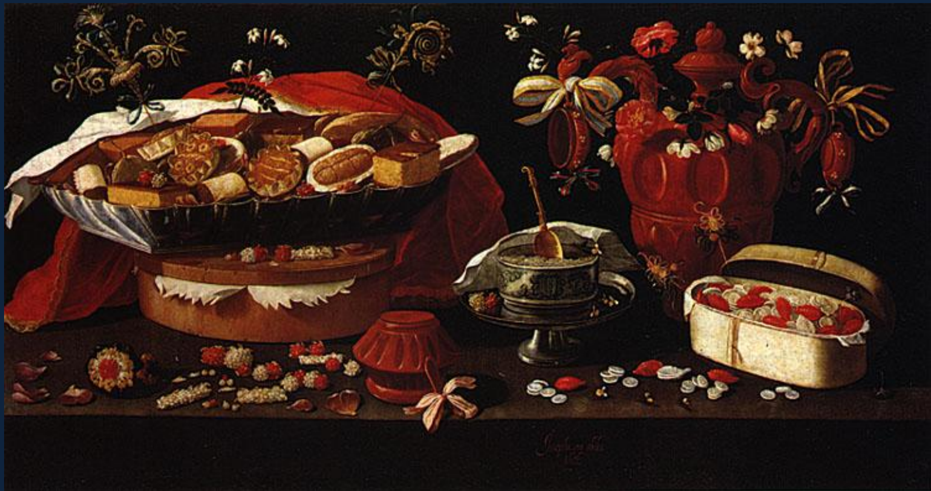
Жозефа де Обидуш. Сладости. 1676. Сантарен