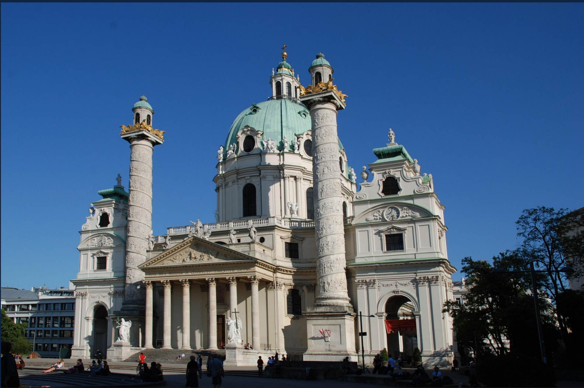
Й.Б.Фишер фон Эрлах. Карлскirche. 1716–1737. Вена