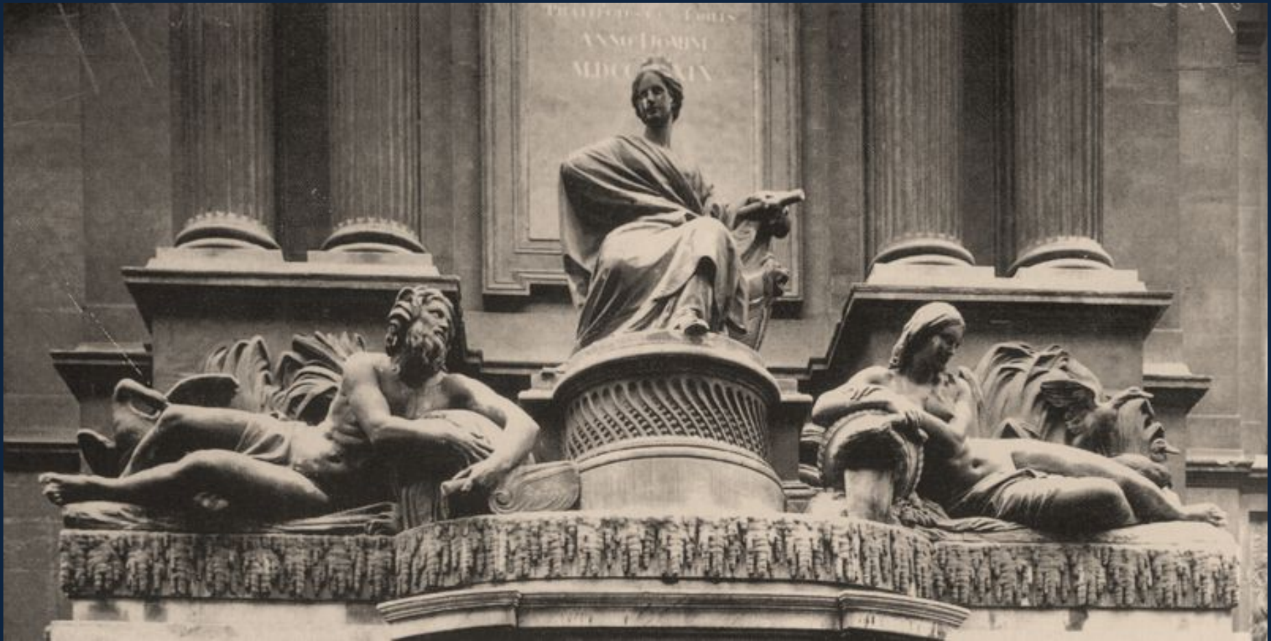
Эдм Бушардон. Париж с Сеной и Марной (Грнейский источник). 1739-1745. Париж