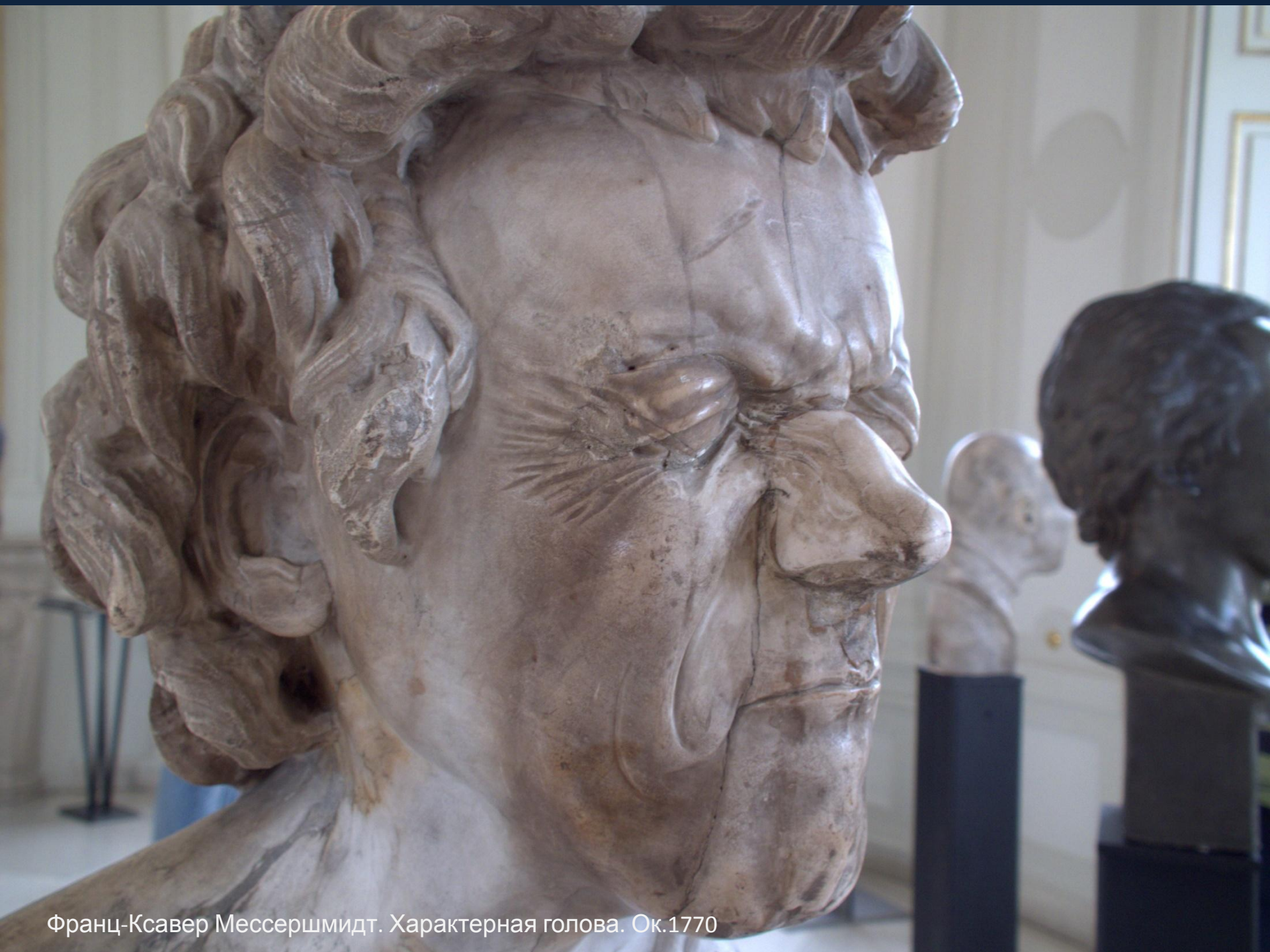
Франц-Ксавер Мессершмидт. Характерная голова. Ок.1770