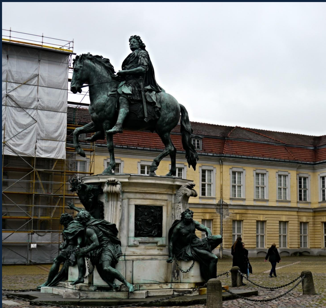
Андреас Шлютер. Статуя Великого Курфюрста Фридриха Вильгельма I. 1696. Берлин