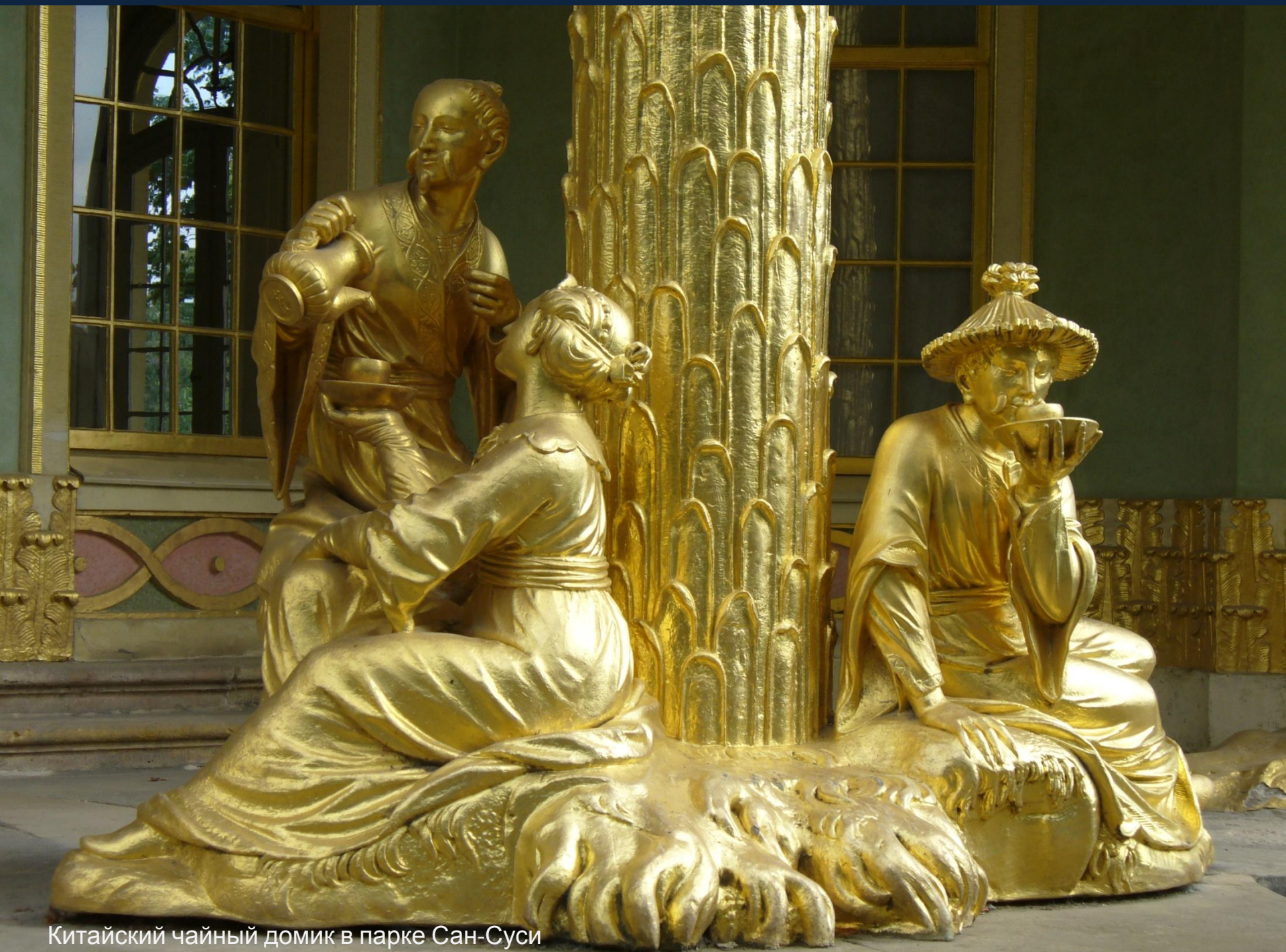
Китайский чайный домик в парке Сан-Суси