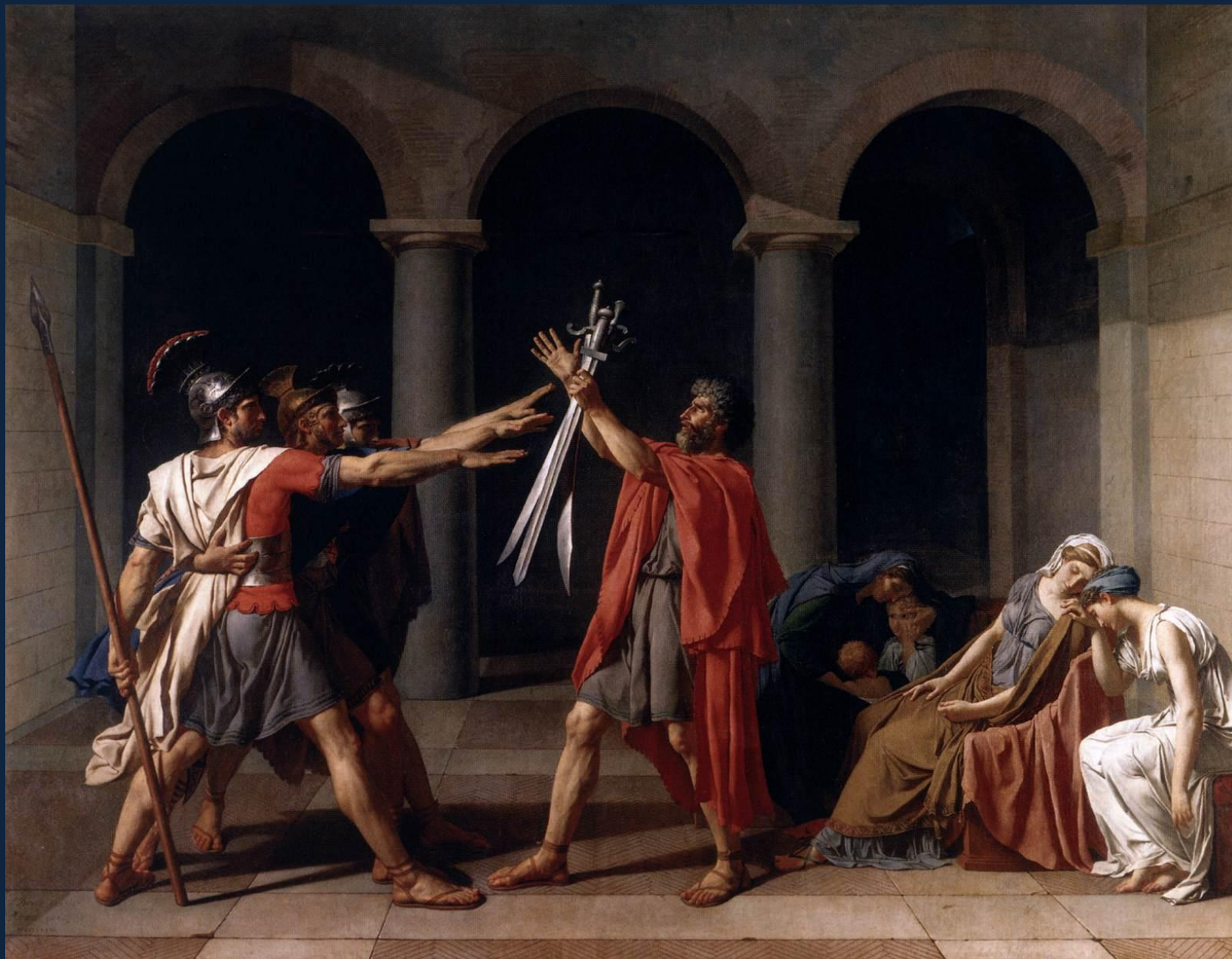
Жак-Луи Давид. Клятва Горациев. 1784. Лувр