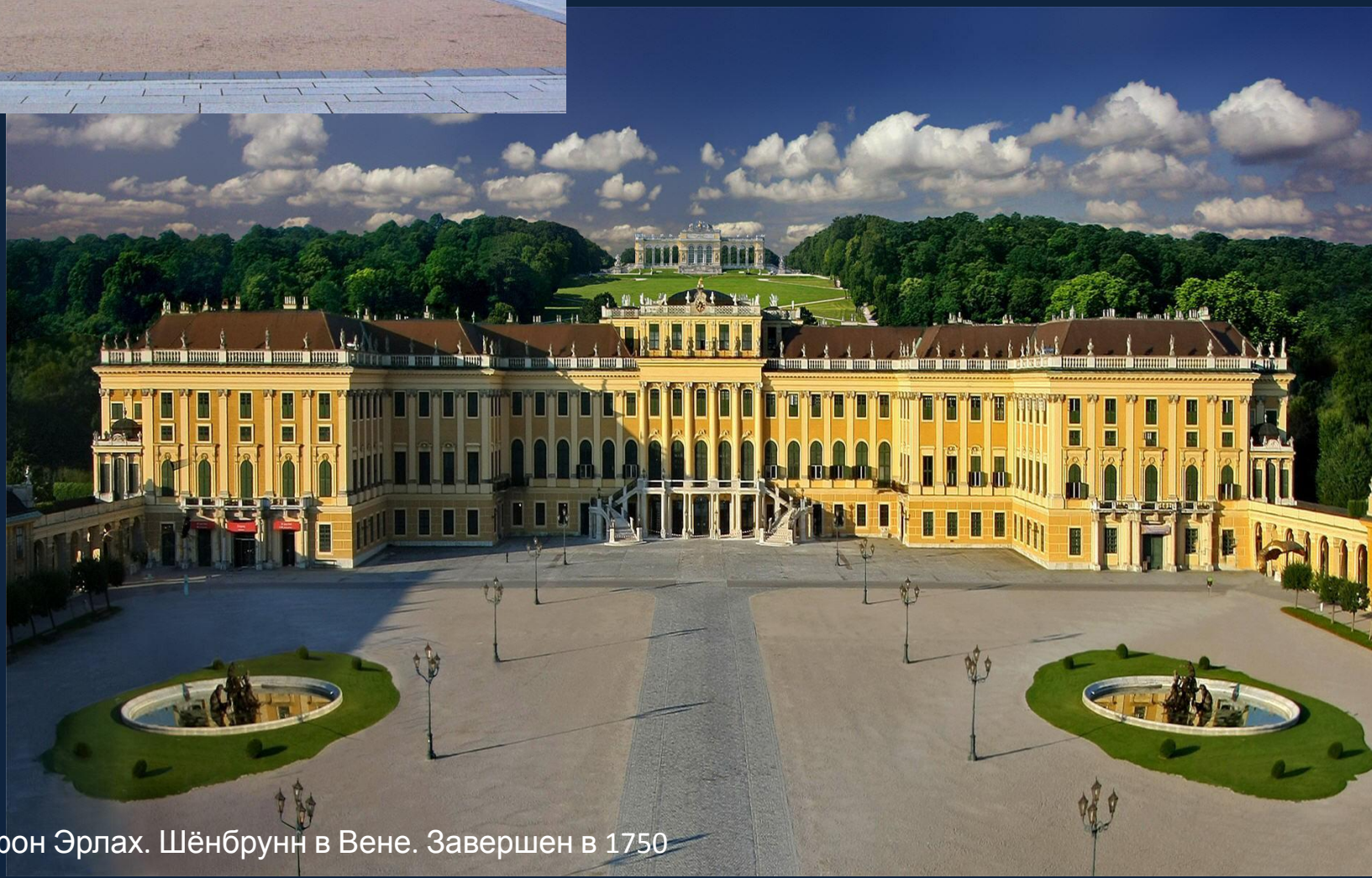
Й.Б.Фишер фон Эрлах. Шёнбрунн в Вене. Завершен в 1750