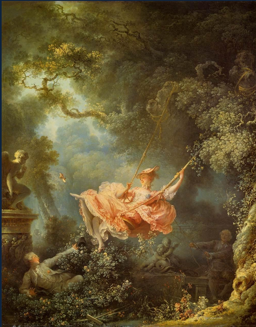
Жан-Оноре Фрагонар. На качелях. 1767. Лондон