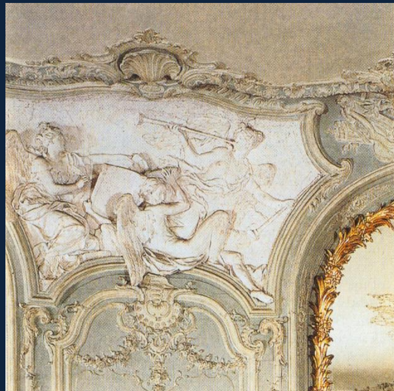
Слева: Франсуа Буше. Купающаяся Венера. 1738. Отель Субиз //справа: декор салона. Отель Субиз