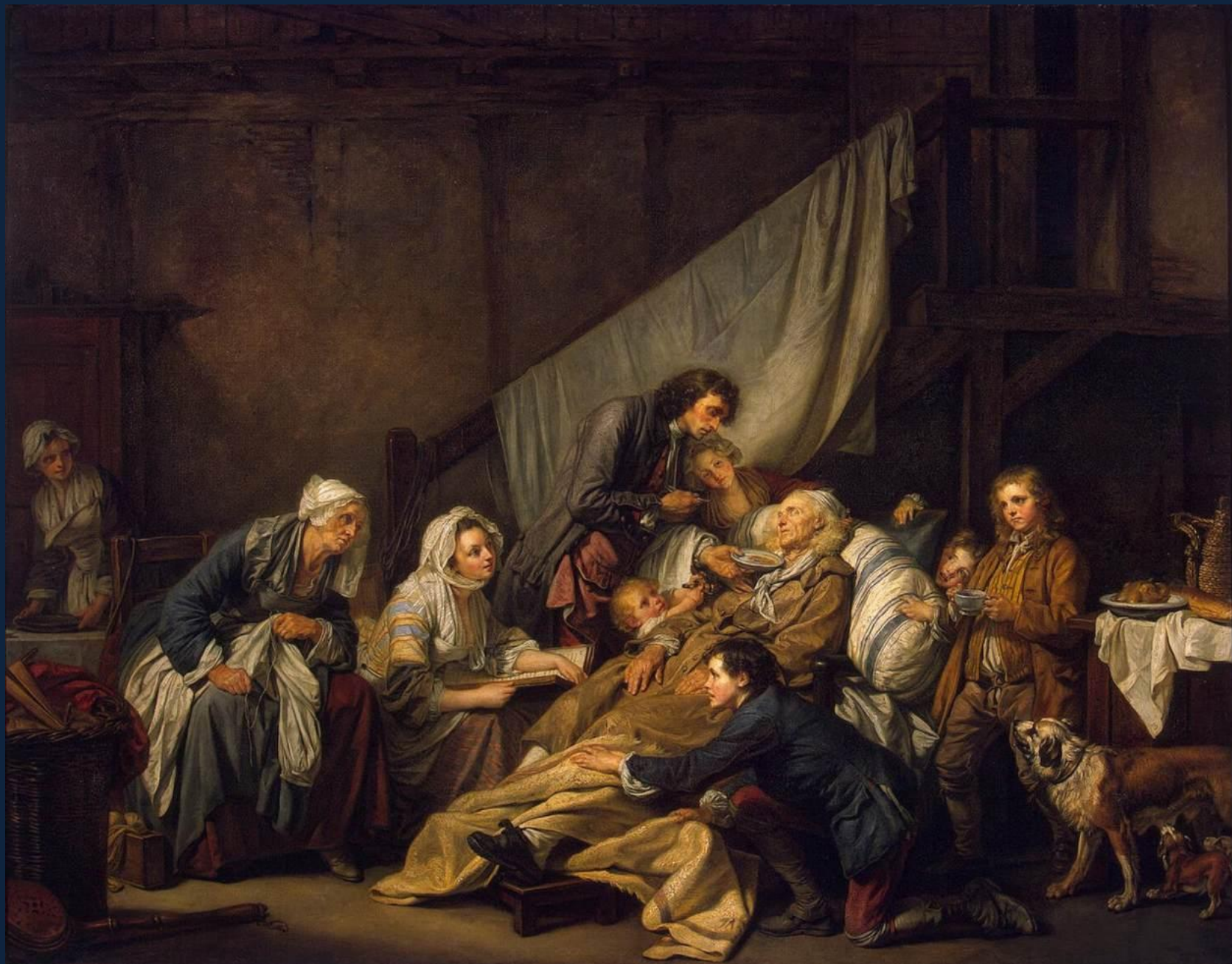
Жан-Батист Грёз. Паралитик. 1763. Эрмитаж