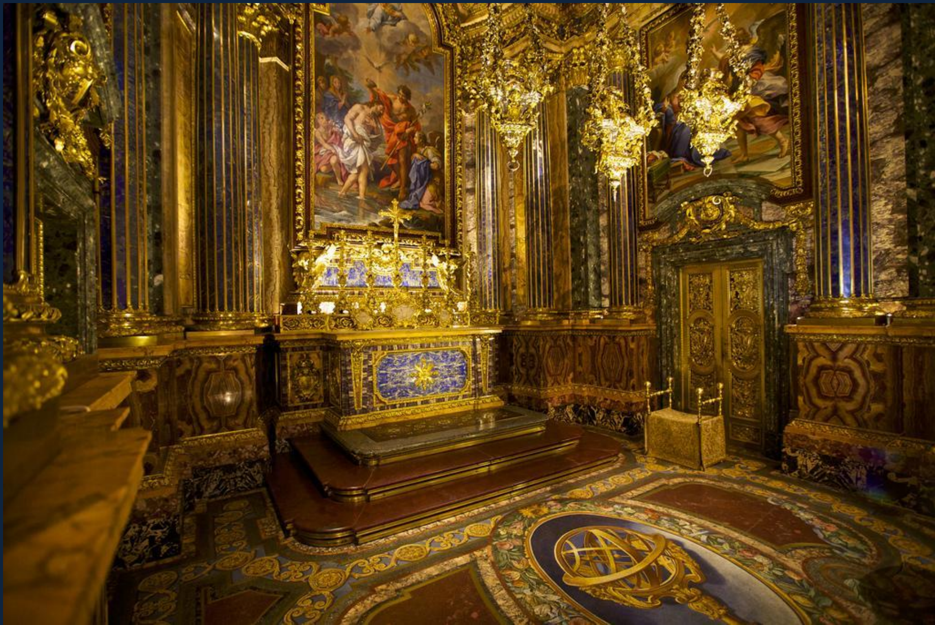
Луиджи Ванвителли, Никола Сальви. Капелла Св.Иоанна Крестителя в церкви Сан-Рок. 1742-1747. Пизарро