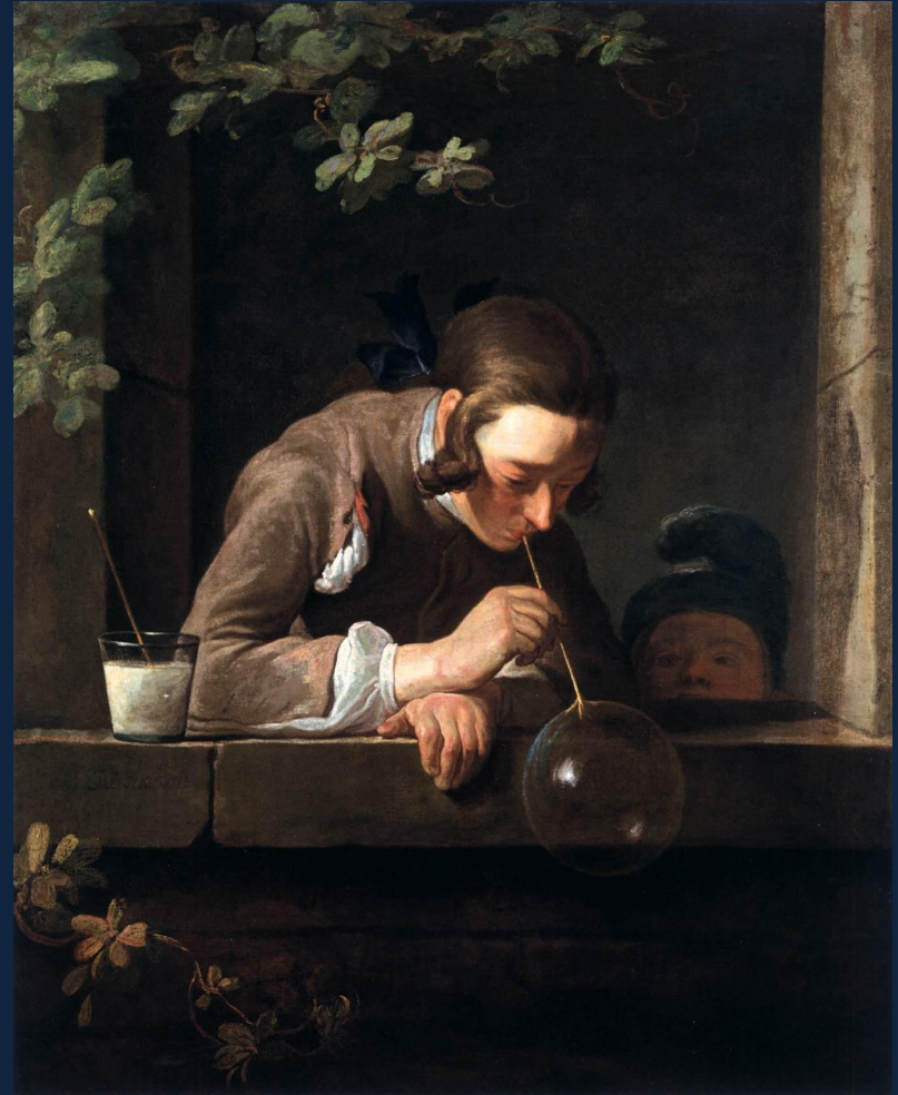
Жан-Батист Симеон Шарден. Слева: Молитва перед обедом. До 1740. Лувр // справа: Мыльный пузырь. 1733-1734. Национальная галерея, Вашингтон