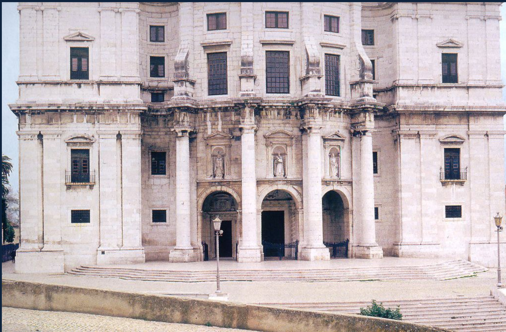
Жуан Антунеш. Церковь Св.Энграции в Лиссабоне. Нач.1682