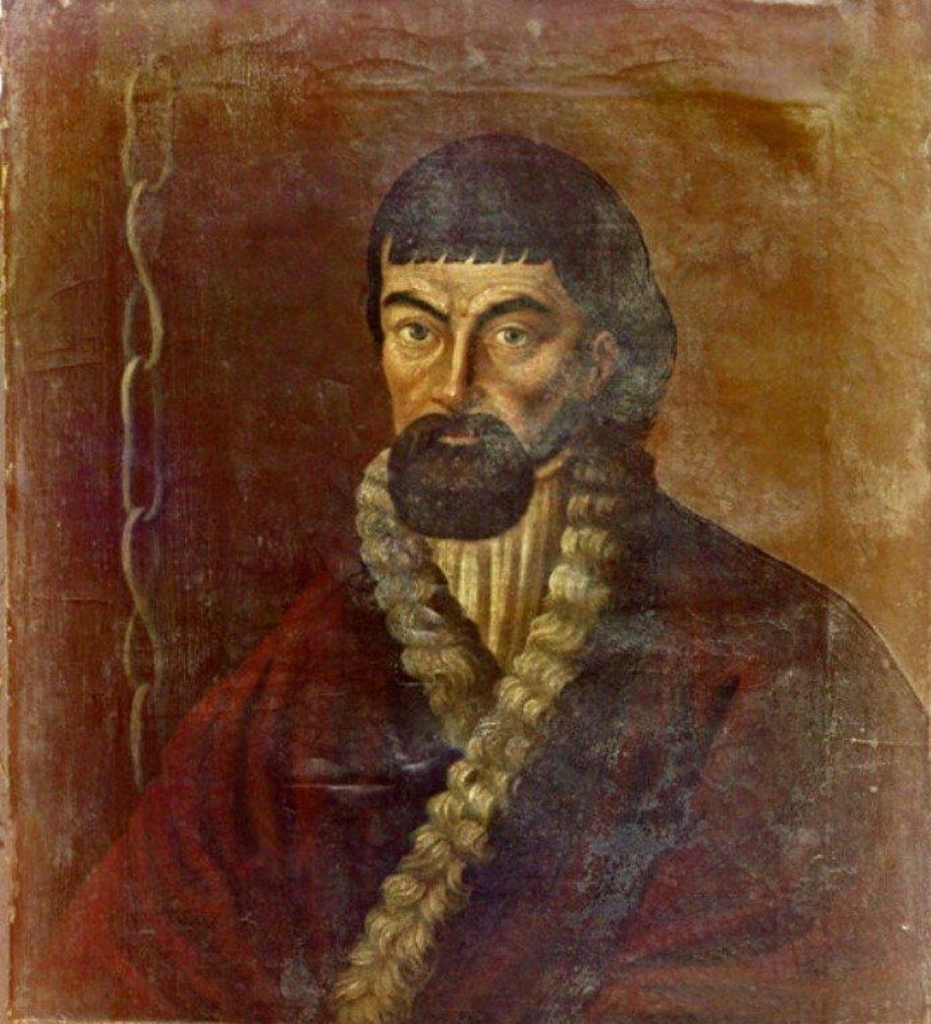
Подлинное Изображение Бунтовщика Иосифовича Емельки Пугачёва.

«Подлинное изображение бунтовщика и обманщика Емельки Пугачёва»