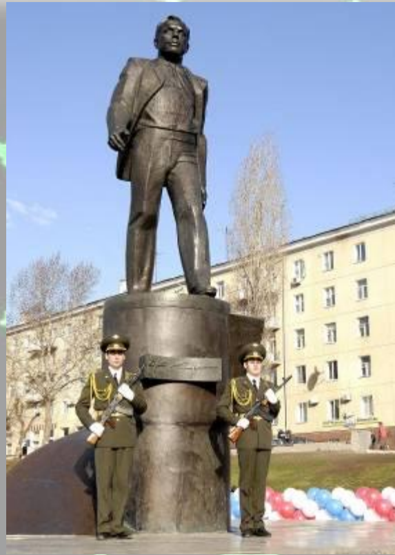
Памятник , Гагарину в Саратове на Набережной Космонавтов