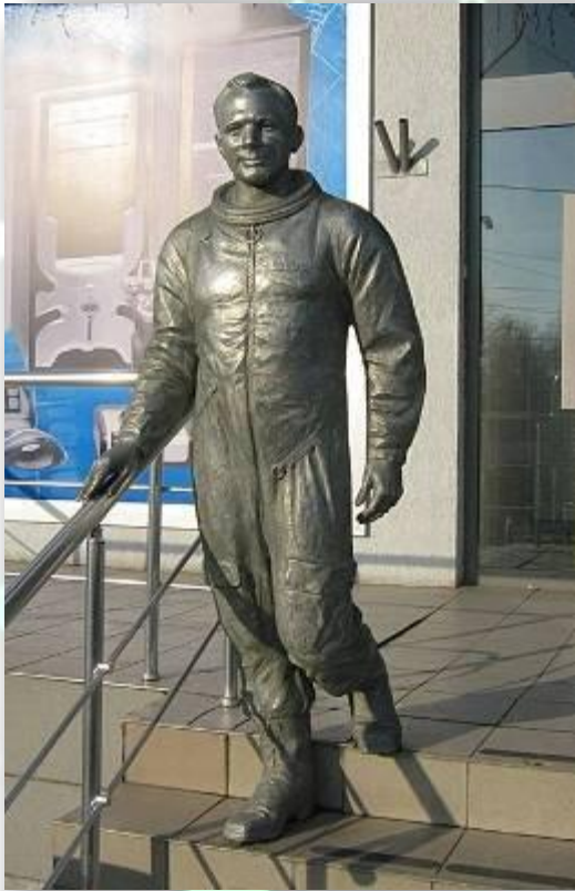
Памятник Ю. Гагарину в Харькове