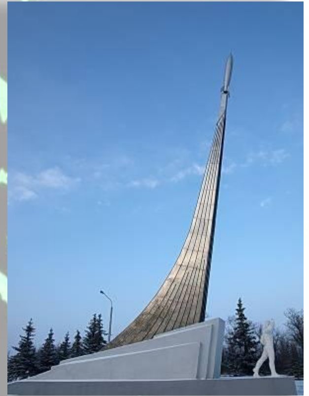
Памятник Ю. Гагарину на месте приземления возле города Энгельс в Саратовской области