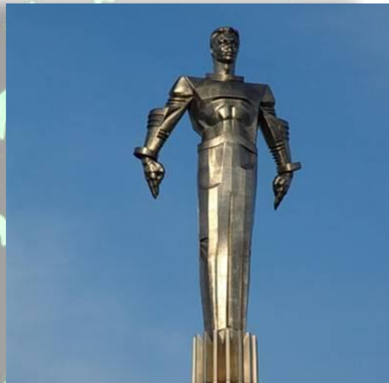
Памятник Ю. Гагарину в Москве

Во многих городах России и других стран существуют улицы, проспекты, площади, бульвары, парки, клубы и школы имени Гагарина.