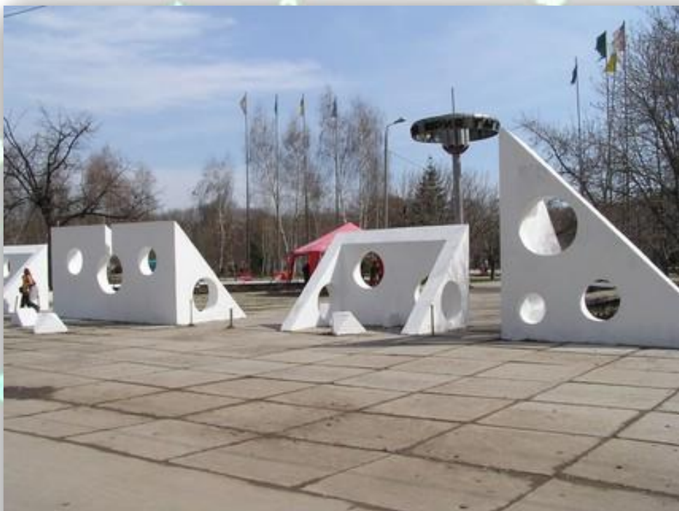
Парк им. Ю. Гагарина в Самаре