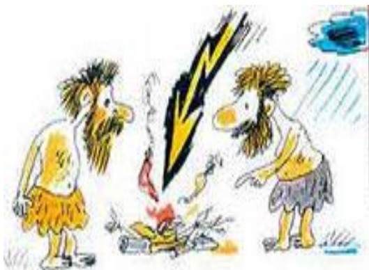
Древние люди добывали огонь при помощи грома и молнии.

Огонь изестен людям с древнейших времен. Разведение огня было важным занятием.