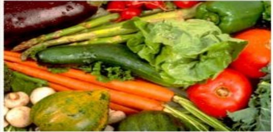
Мойте овощи и фрукты