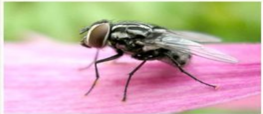
Уничтожайте насекомых - переносчиков кишечных инфекций