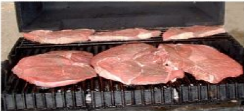
Употребляйте в пищу хорошо прожаренное мясо