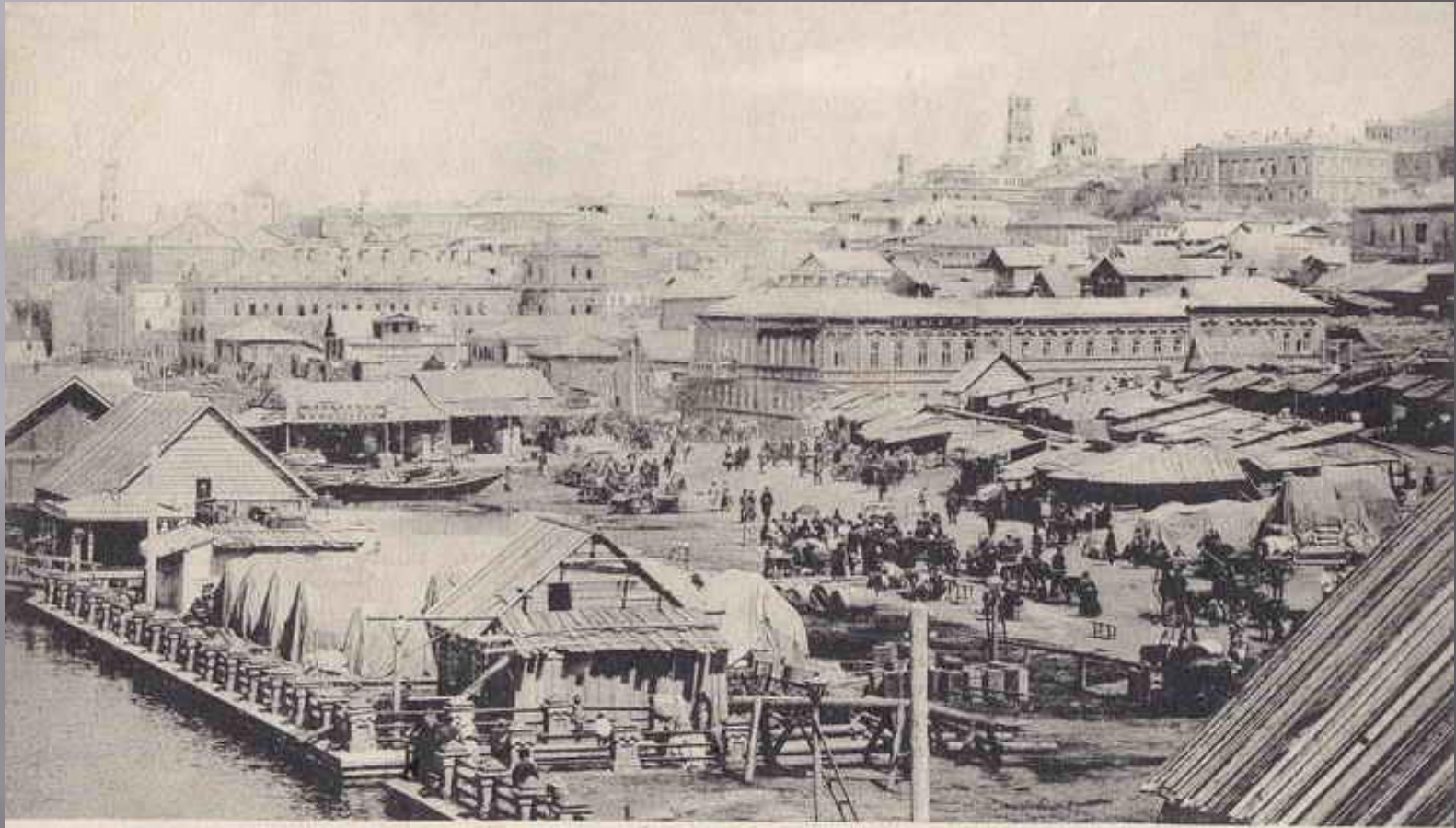
Общій видъ г. Самара. Изданіе магазина Н. И. Громова.