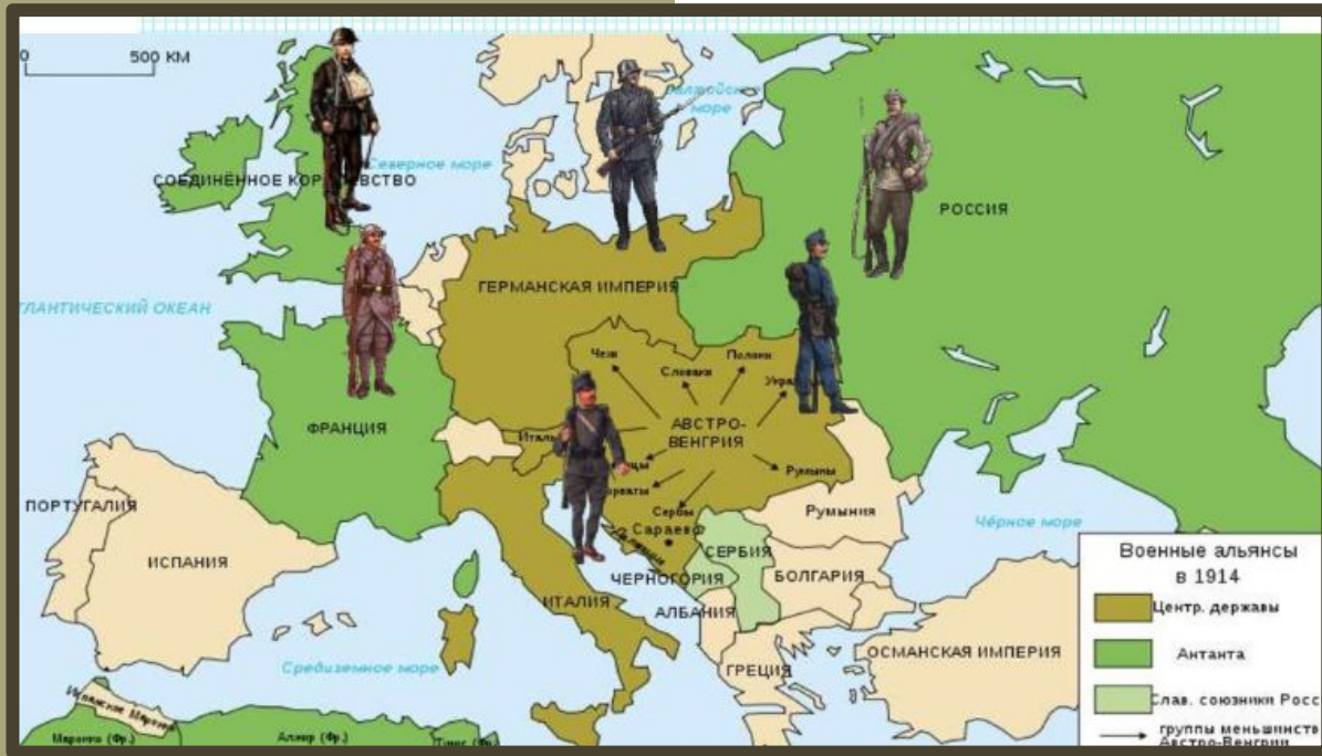
Карта с изображением основных альянсов периода I Мировой войны

Нарастание кризиса системы международных отношений