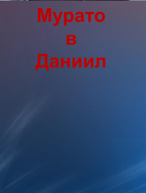
Мурато в Даниил