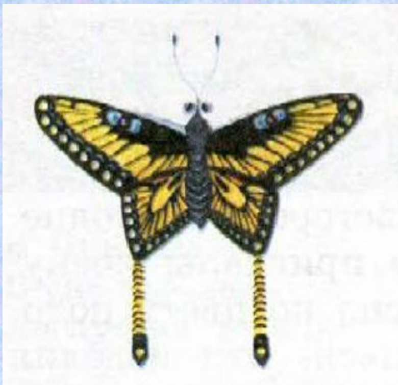
«Жёлтая бабочка» Китай