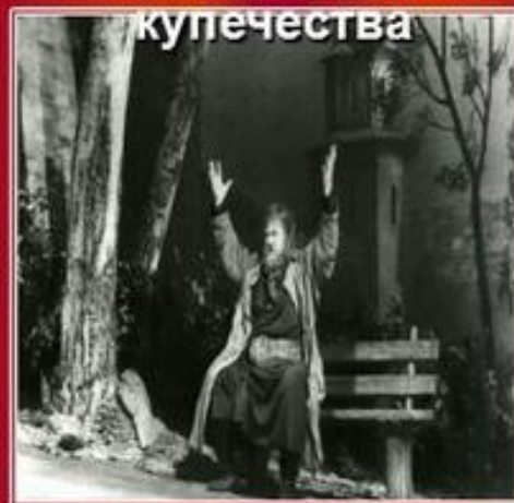
«Сердце не камень»