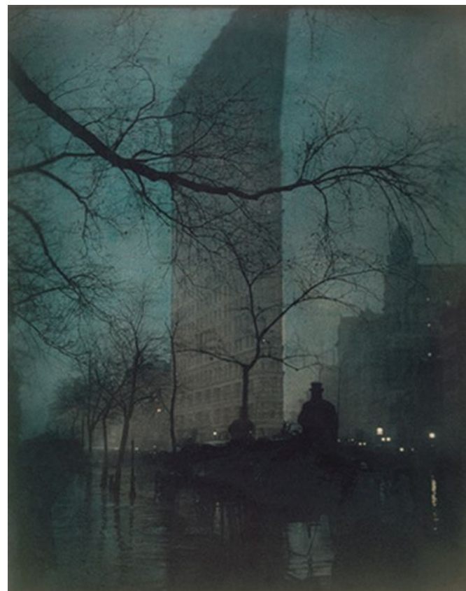
The Flatiron. Фото Эдварда Штайхена, 1904 г.