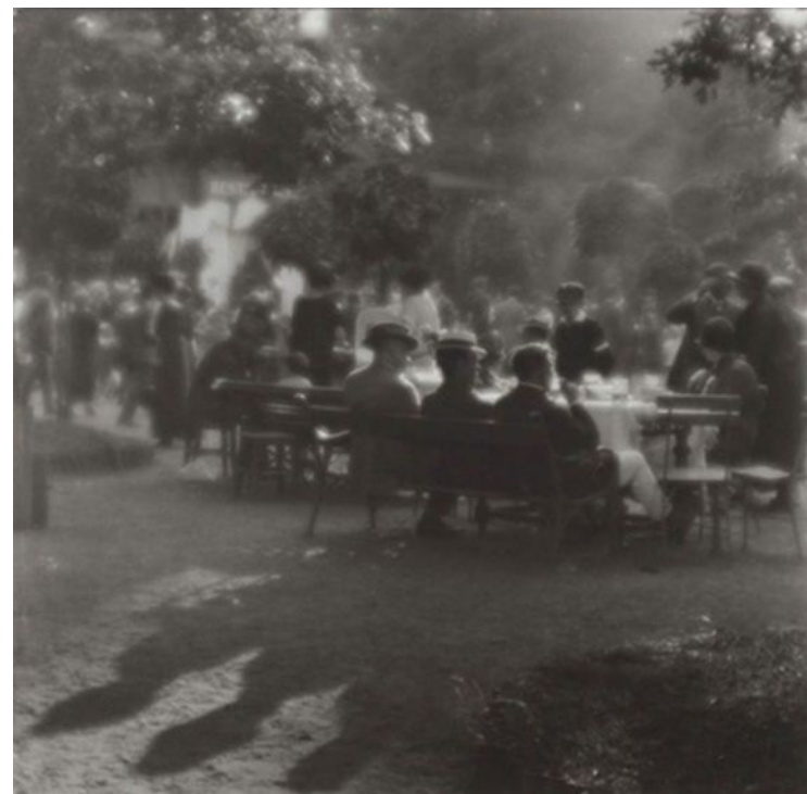
В воскресенье после полудня на Колинском острове.