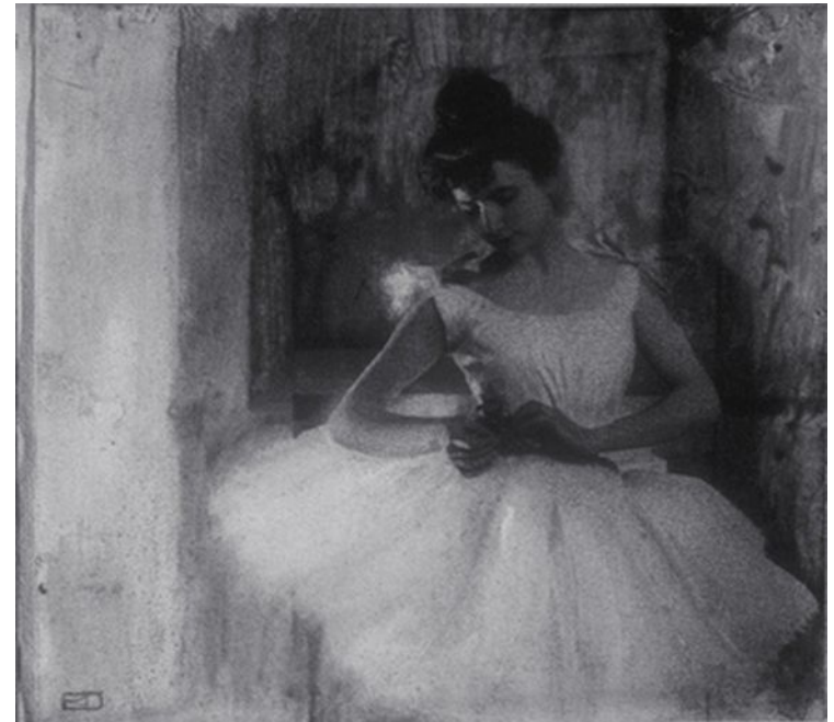
Une Balleteuse. 1900 г