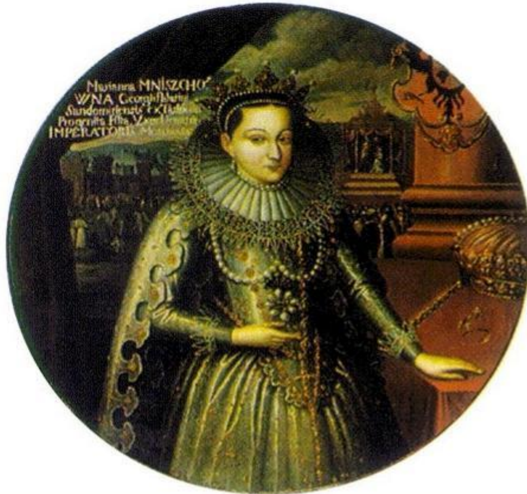
Марина Мнишек. Миниатюра н. XVII в.