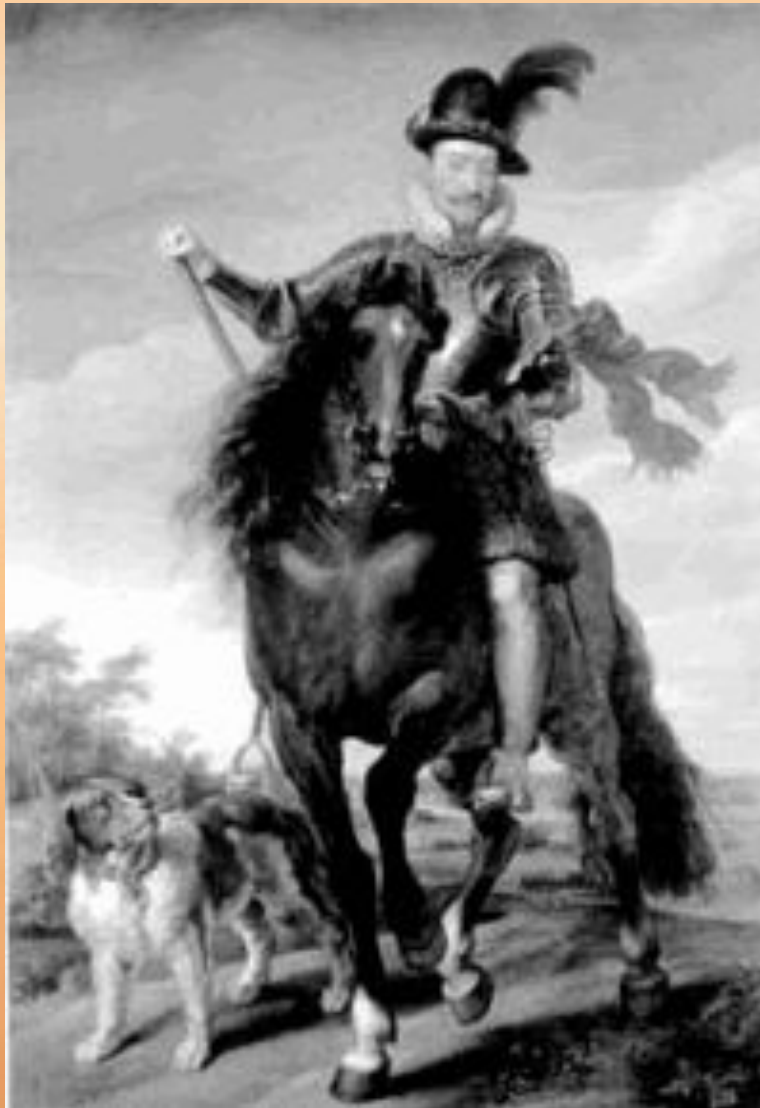
Сигизмунд III Ваза. Портрет работы П. Рубенса После 1624 г.