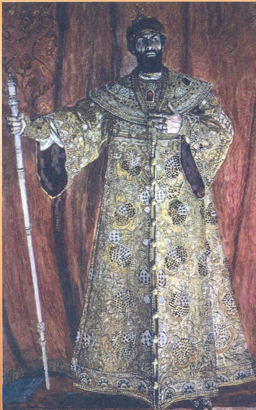
А. Головин Портрет Ф. И. Шаляпина в роли в одноименной опере М. П. Мусоргского