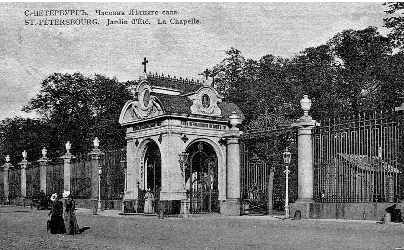
С.-ПЕТЕРБУРГЪ. Часовня Лѣтняго сада. ST.-PÉTERSBOURG. Jardin d'Été. La Chapelle.