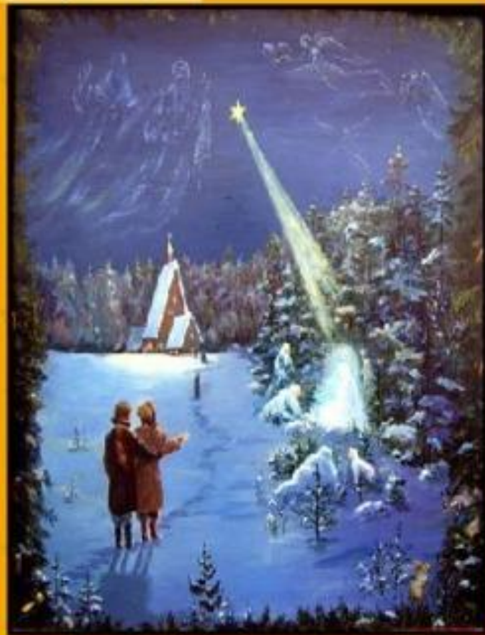
Рождественская звезда Открытка XIX века