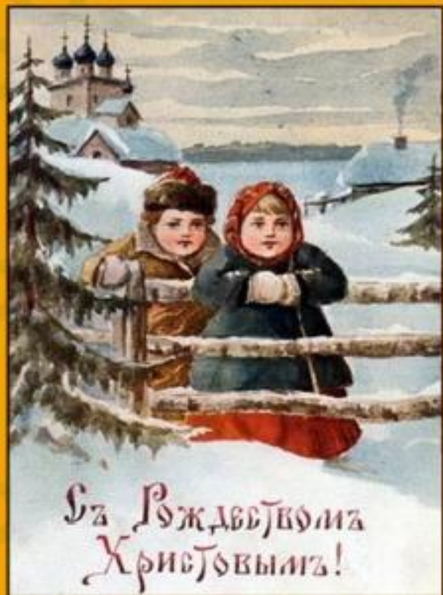
Открытка XIX века