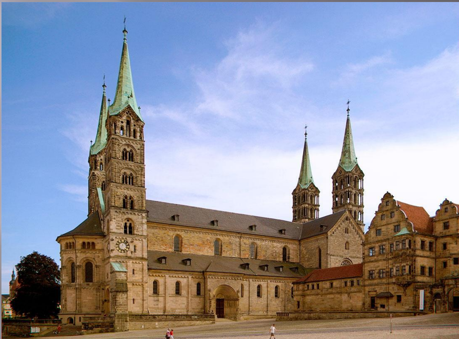
Бамбергский собор (1004 г.)