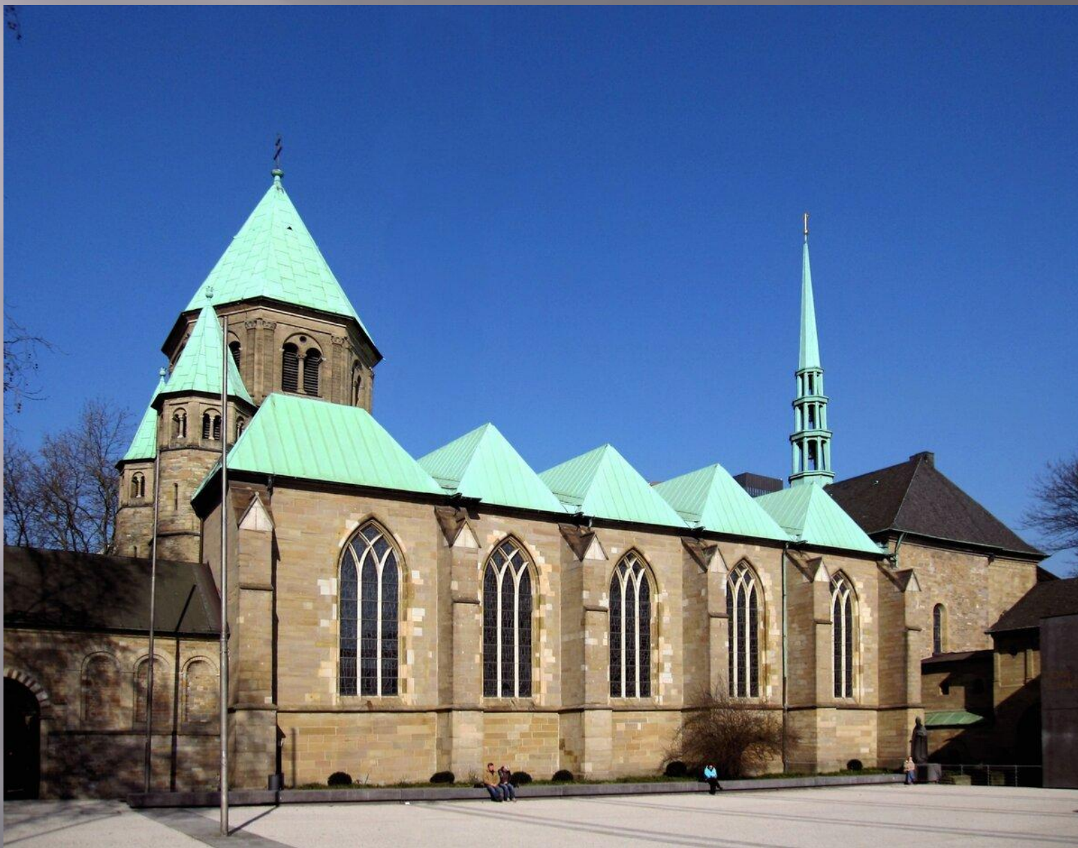
церковь в Зесте (1343 г.)