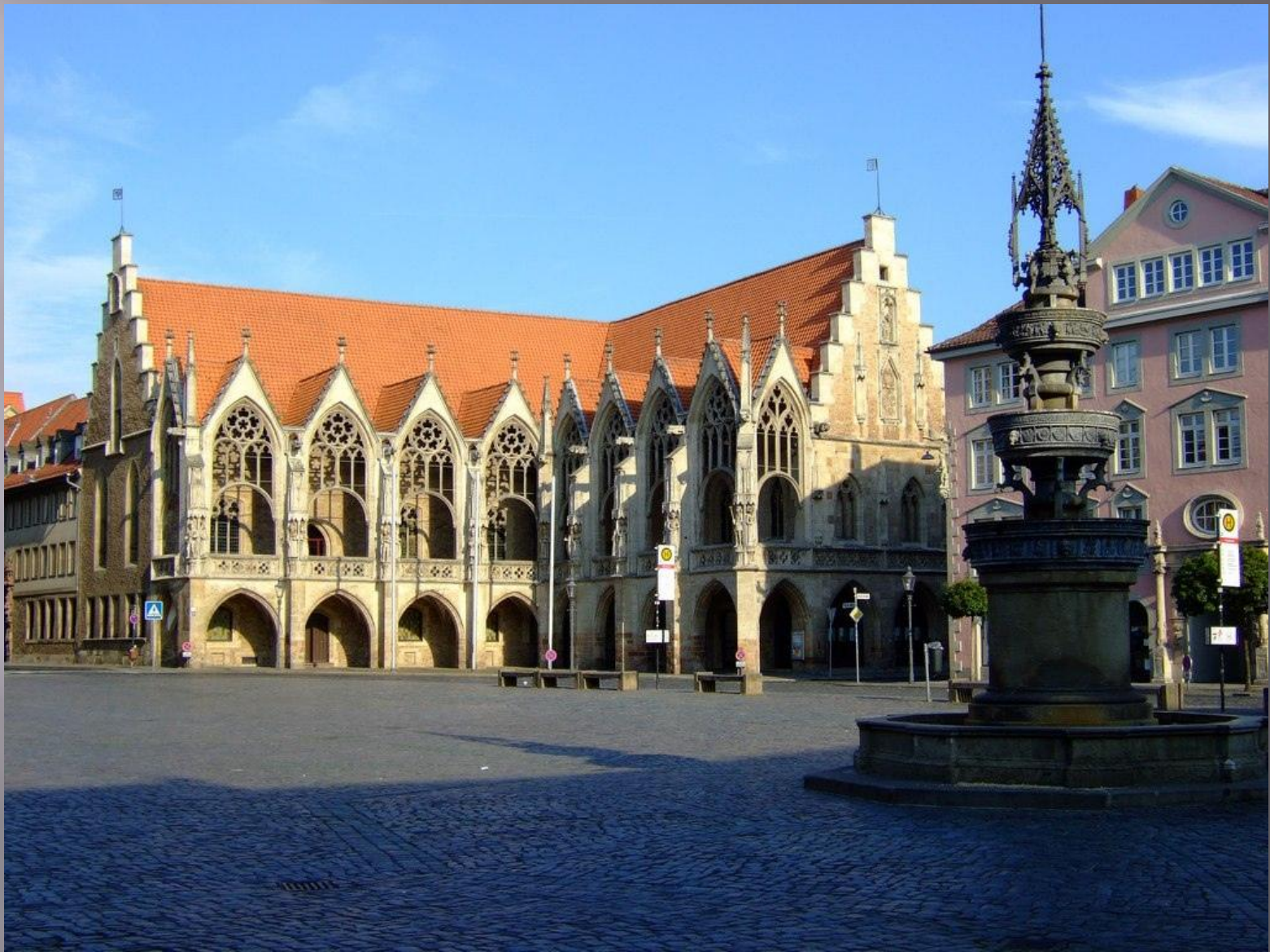
ратуша в Брауншвейге