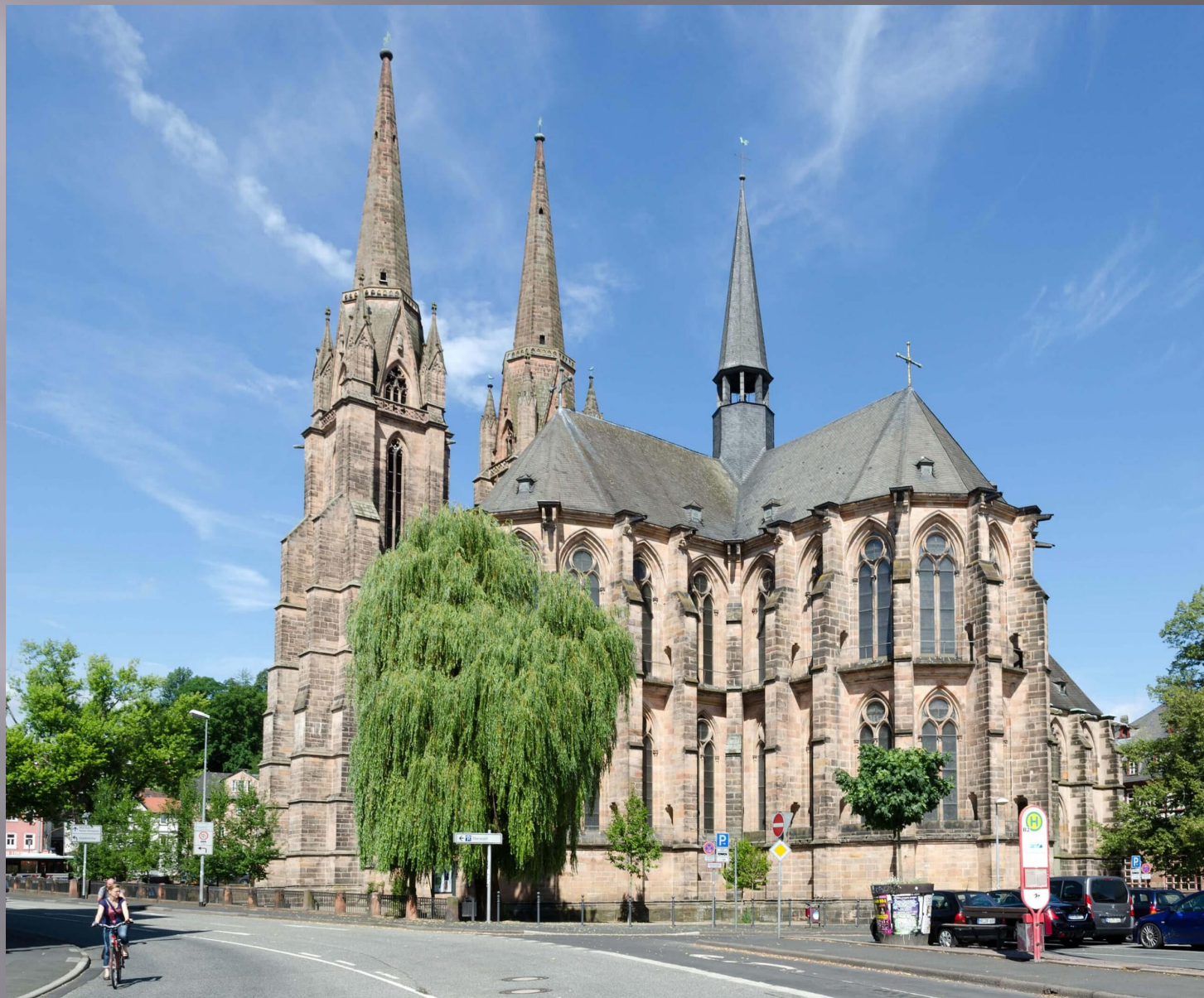
церковь св. Елизаветы в Марбурге (1228 г.)