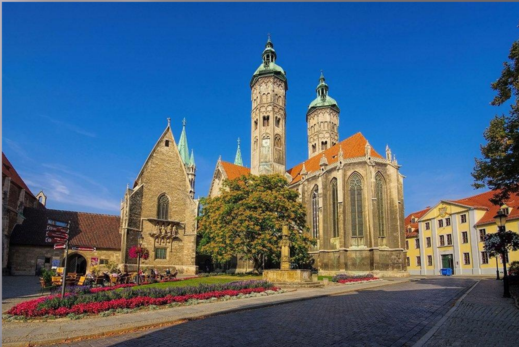
Наумбургский собор (1028 г.)