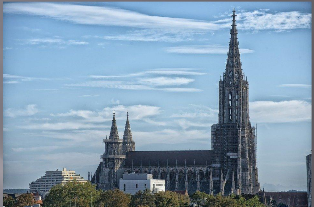
Ульмский собор (1377 г.)