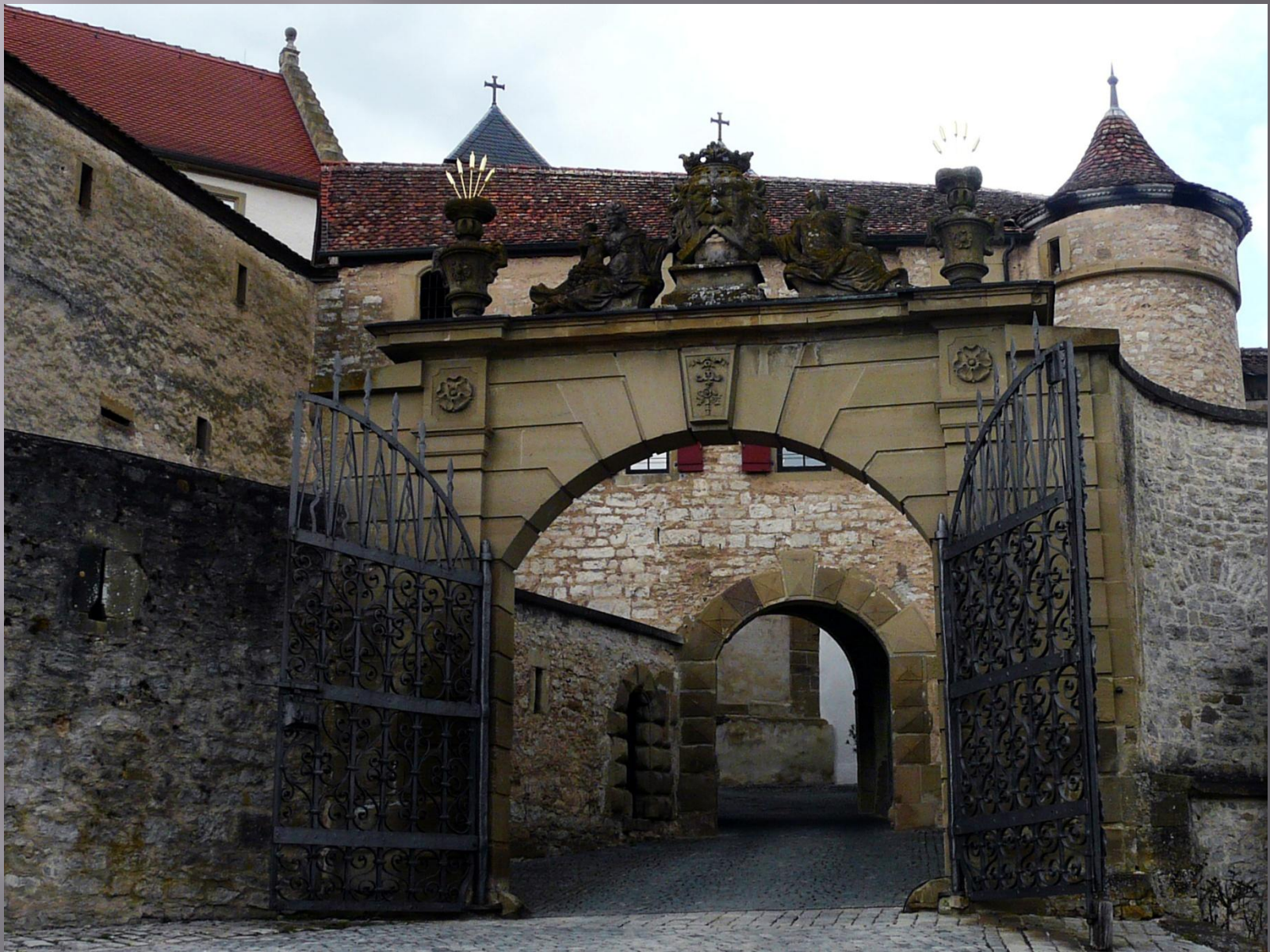
ворота в Комбурге