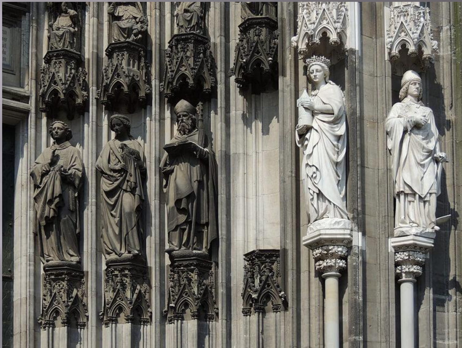
Статуи на хорах Кельнского собора (пер. пол. 14 в.)