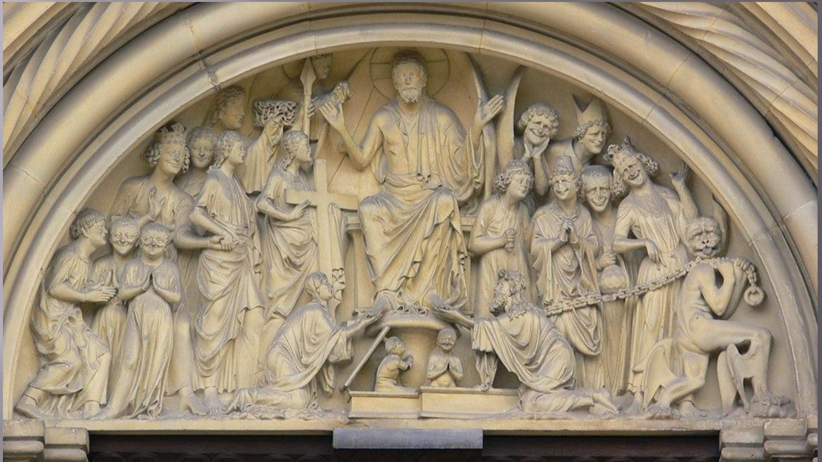
«Страшный суд» (около 1240 г.) Бамбергского собора