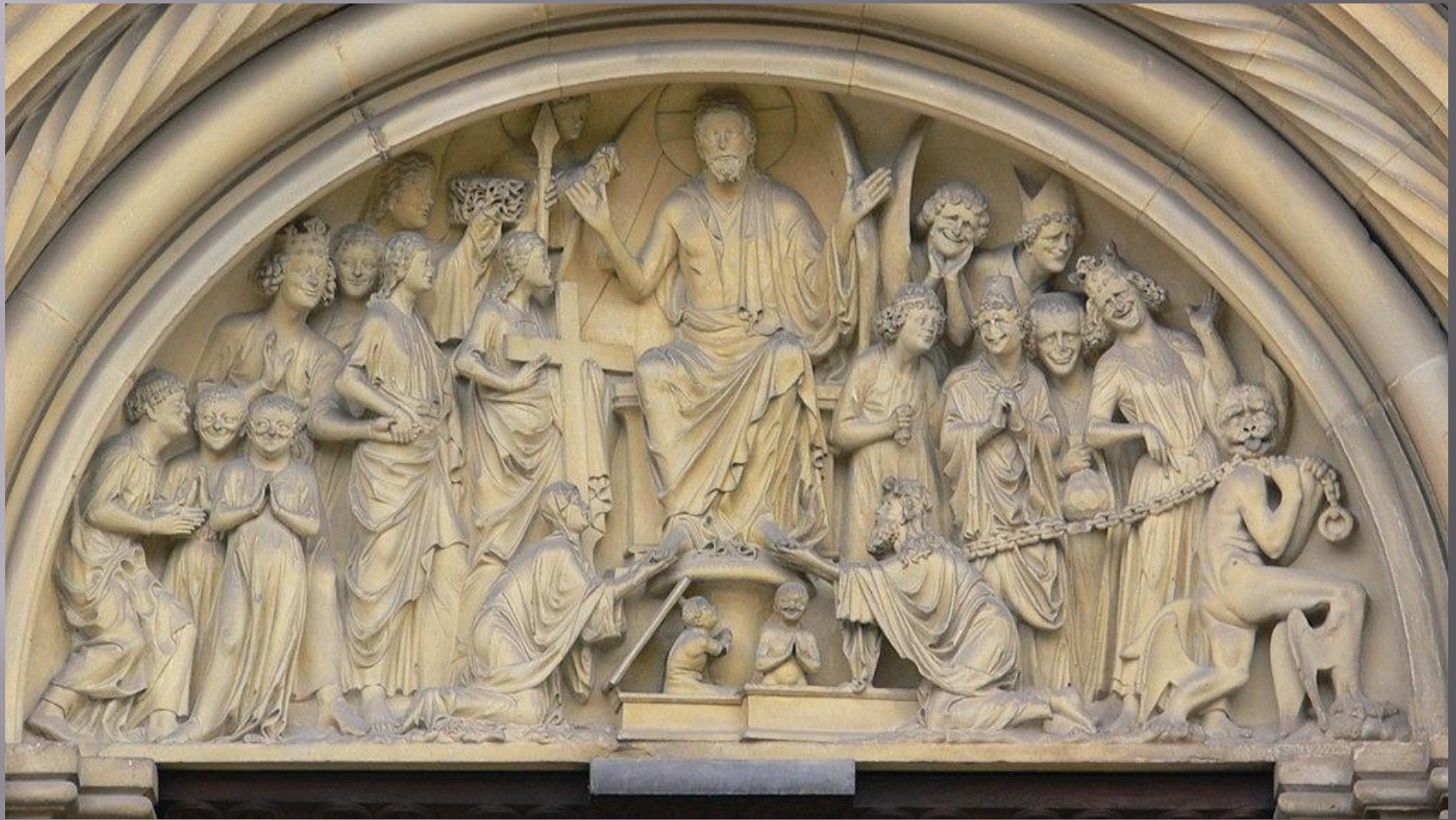
«Страшный суд» (около 1240 г.) Бамбергского собора