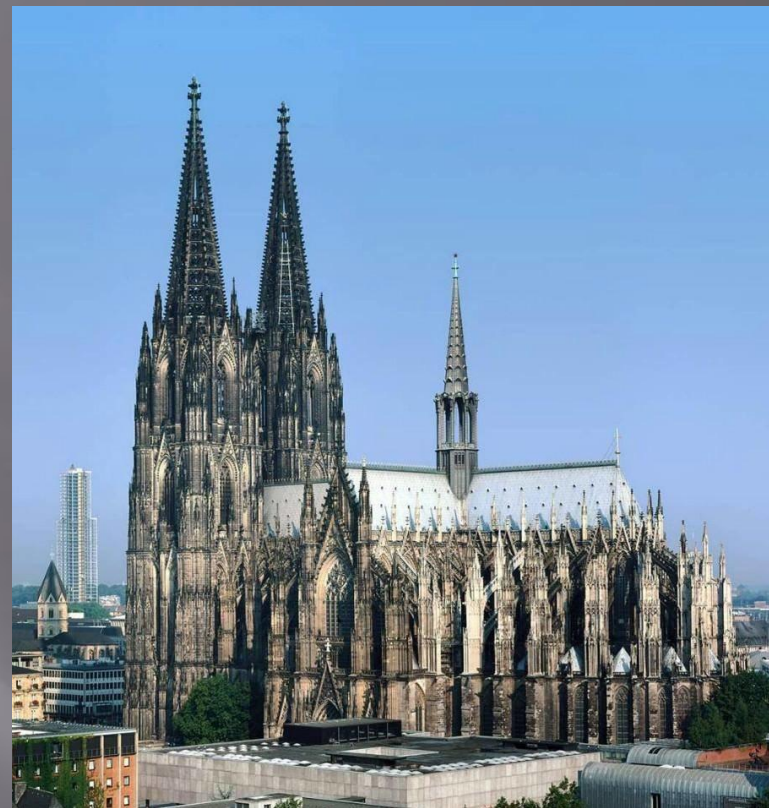
Кельнский собор (1248 г.)