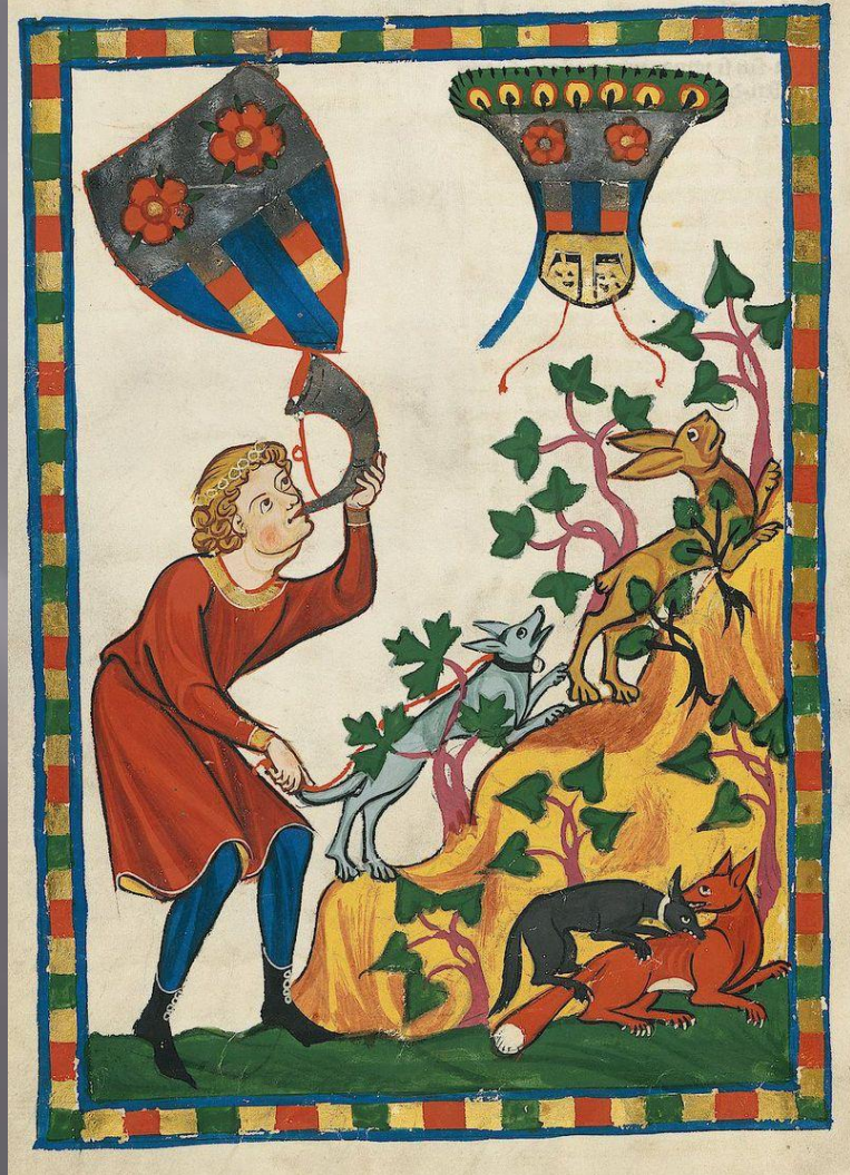
Рукопись Манессе (пер. пол. 14 в.)