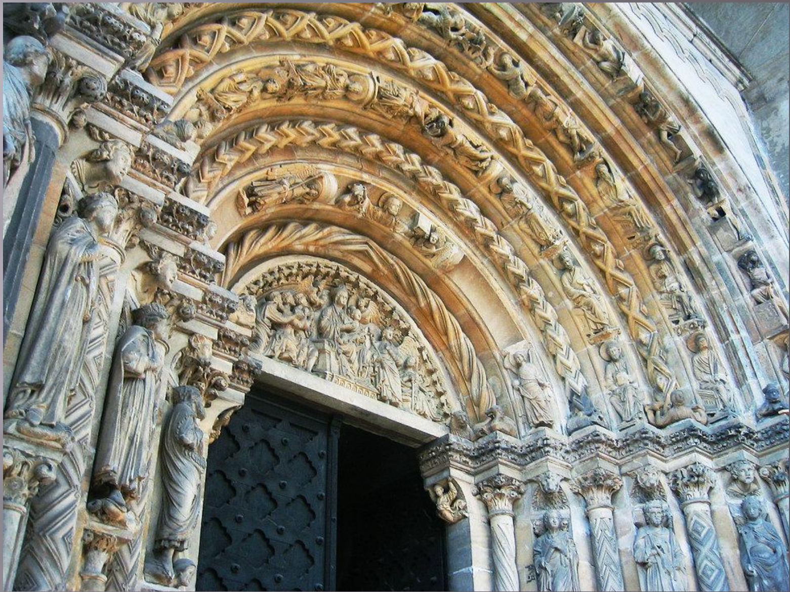
«Золотые ворота» Фрейбергского собора (1240 г.)