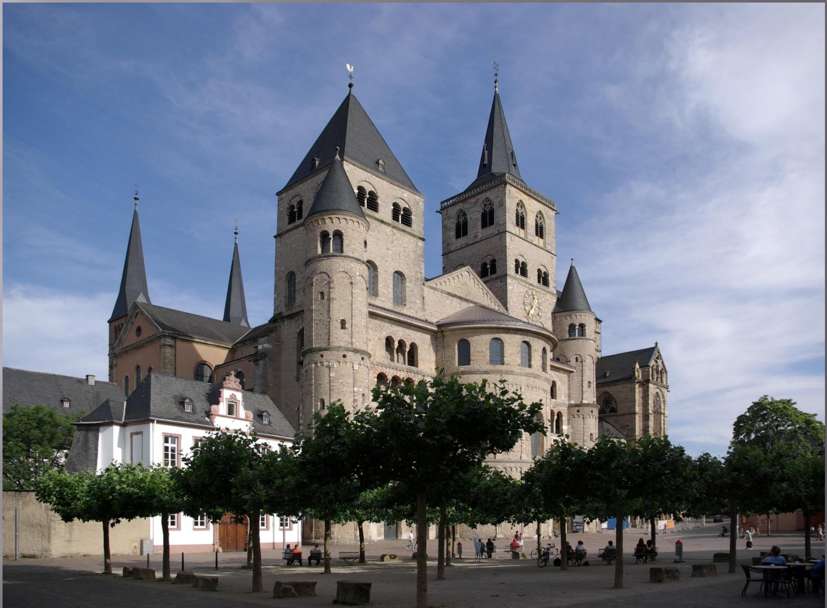
церковь Богоматери в Трире (1235 г.)