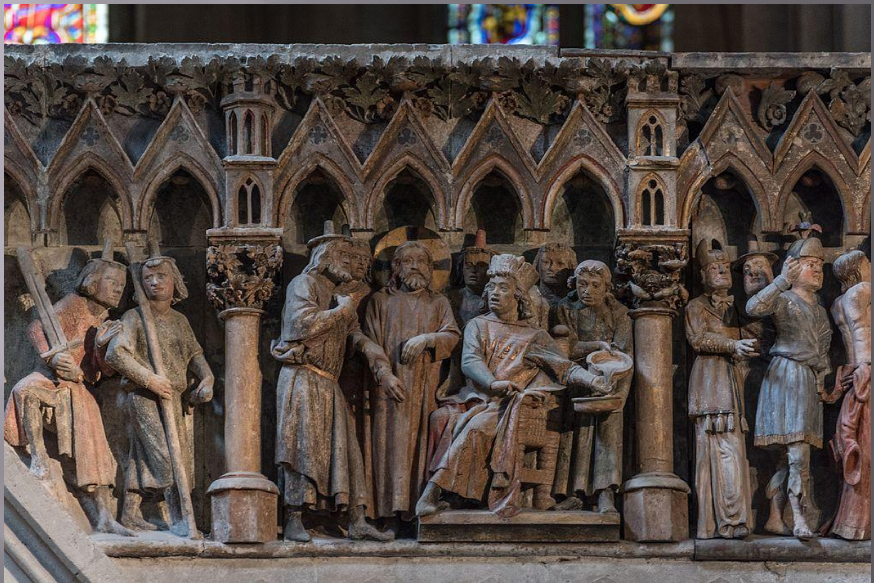
Рельеф западной преграды Наумбургского собора (сер. 13 в.)