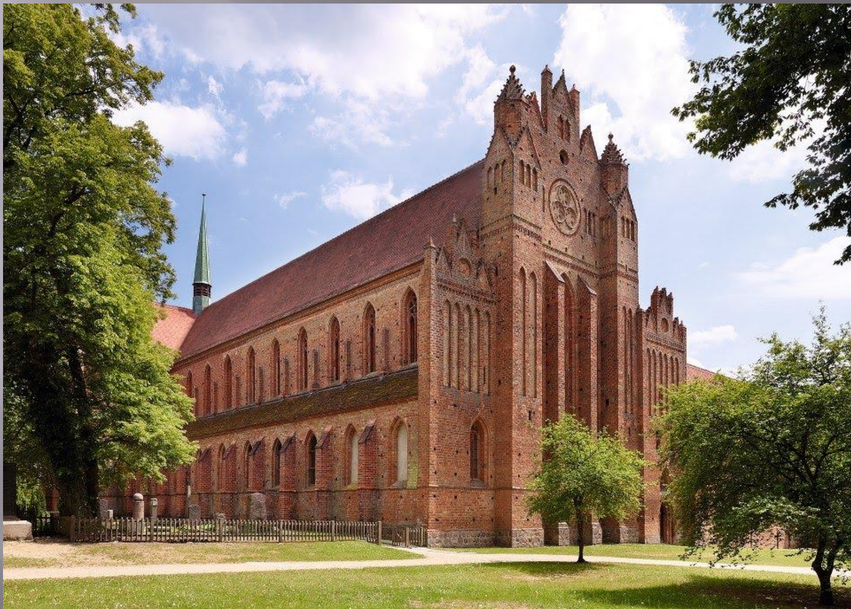
церковь в Хорине (1258 г.)