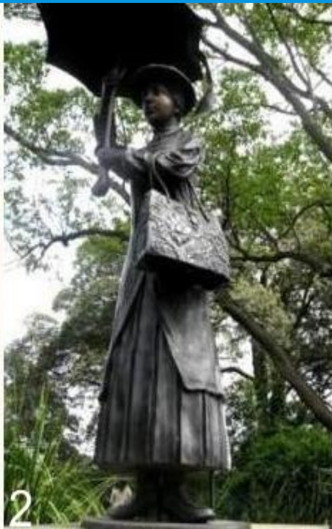
г. Эшфилд, Австралия.