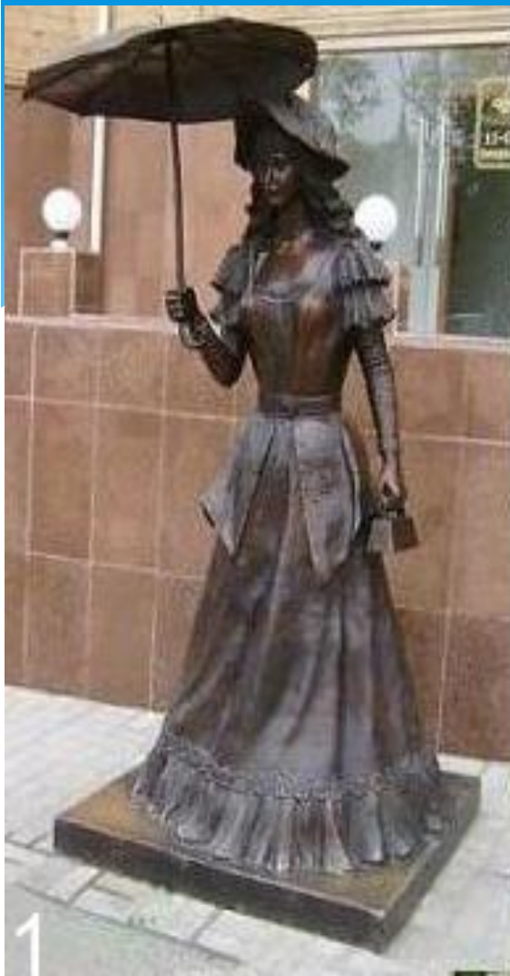
г. Костанай Казахстан.