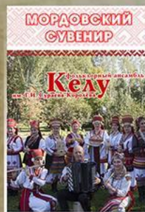
«Мордовский сувенир» Фольклорный ансамбль «Келу» им. Г.И. Сураева-Королёва