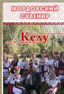
«Мордовский сувенир» Фольклорный ансамбль «Келу» им. Г.И. Сураева-Королёва