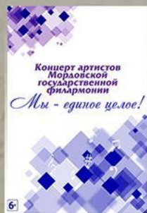
«Мы - единое целое!» Солисты и коллективы МГФ