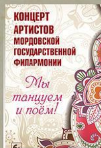
«Мы танцуем и поём» Солисты и коллективы МГФ