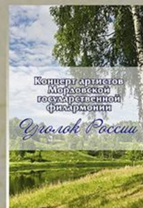
«Уголок России» Солисты и коллективы МГФ