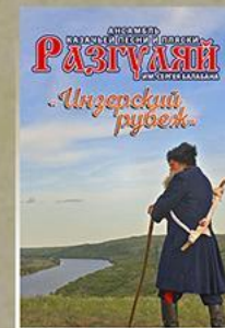
«Инзерский рубеж» Ансамбль казачьей песни и пляски «Разгуляй»