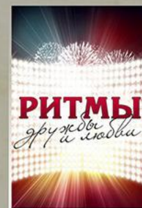
«Ритмы дружбы и любви» Ансамбль «Девчата», театр танца «Art-Vision», солисты МГФ