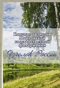
«Уголок России» Солисты и коллективы МГФ