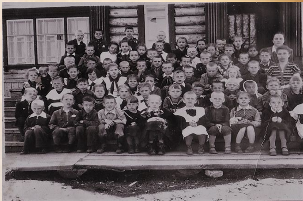
На этой фотографии мы видим учащихся первого класса