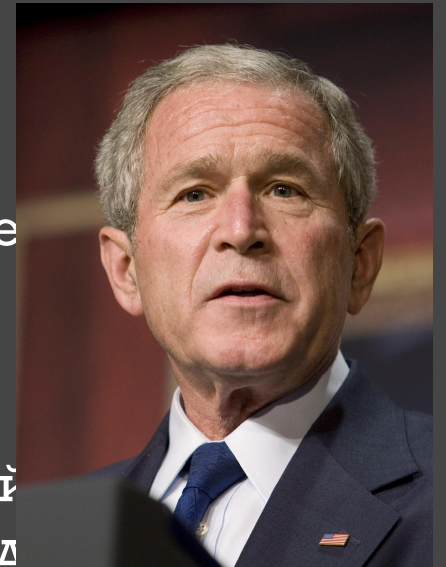
Джордж Уокер Буш

В 2007 году в американский конгресс поступил законопроект, учреждающий медаль за участие в холодной войне. Для американского истеблишмента тематика побед над коммунизмом остается важным элементом политической пропаганды.