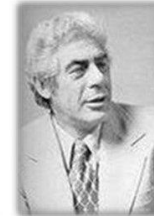
Фредерик Герцберг, 1923-2000 гг., США