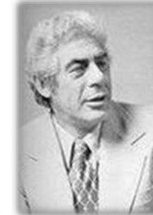
Фредерик Герцберг, 1923-2000 гг., США