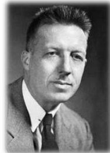
Дуглас Мак- Грегор, 1906 – 1964 гг., США

Поведенческие науки (бихевиоризм) (1950 - наст.вр.)