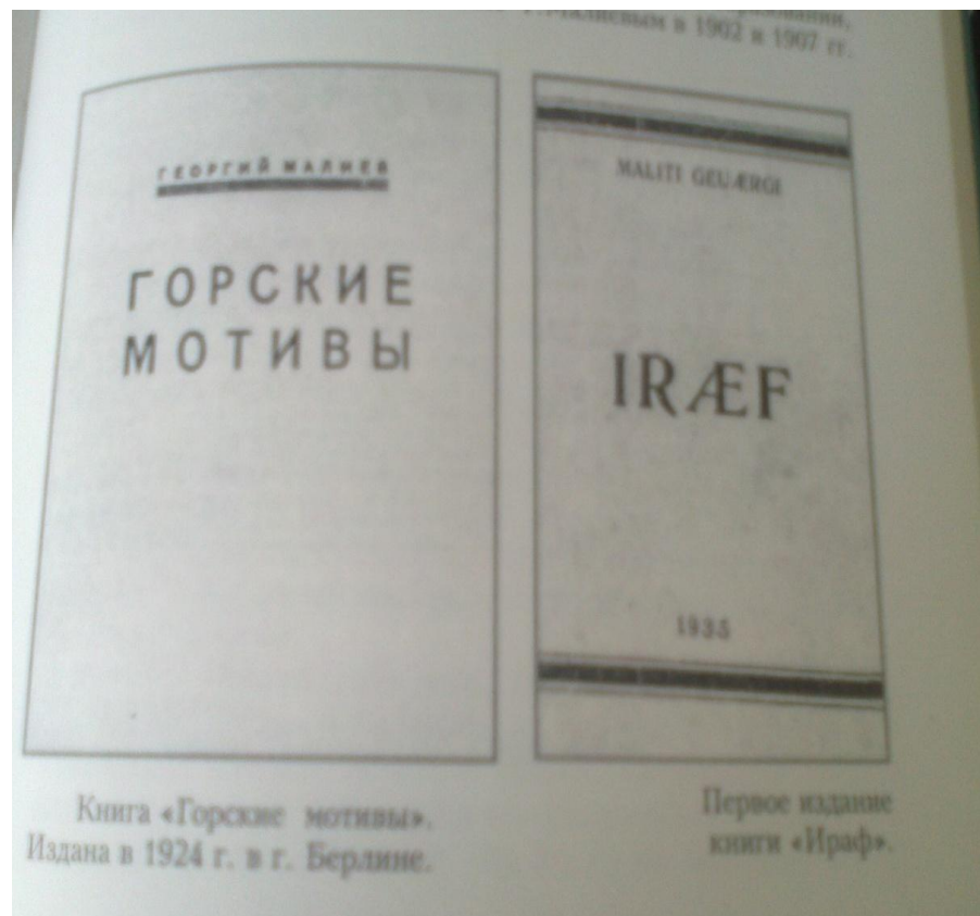
Книга «Горские мотивы». Издана в 1924 г. в г. Берлине.