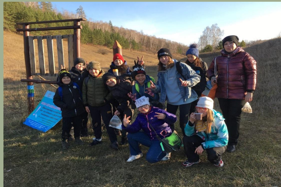
Родник «Холодный» за Радиозаводом