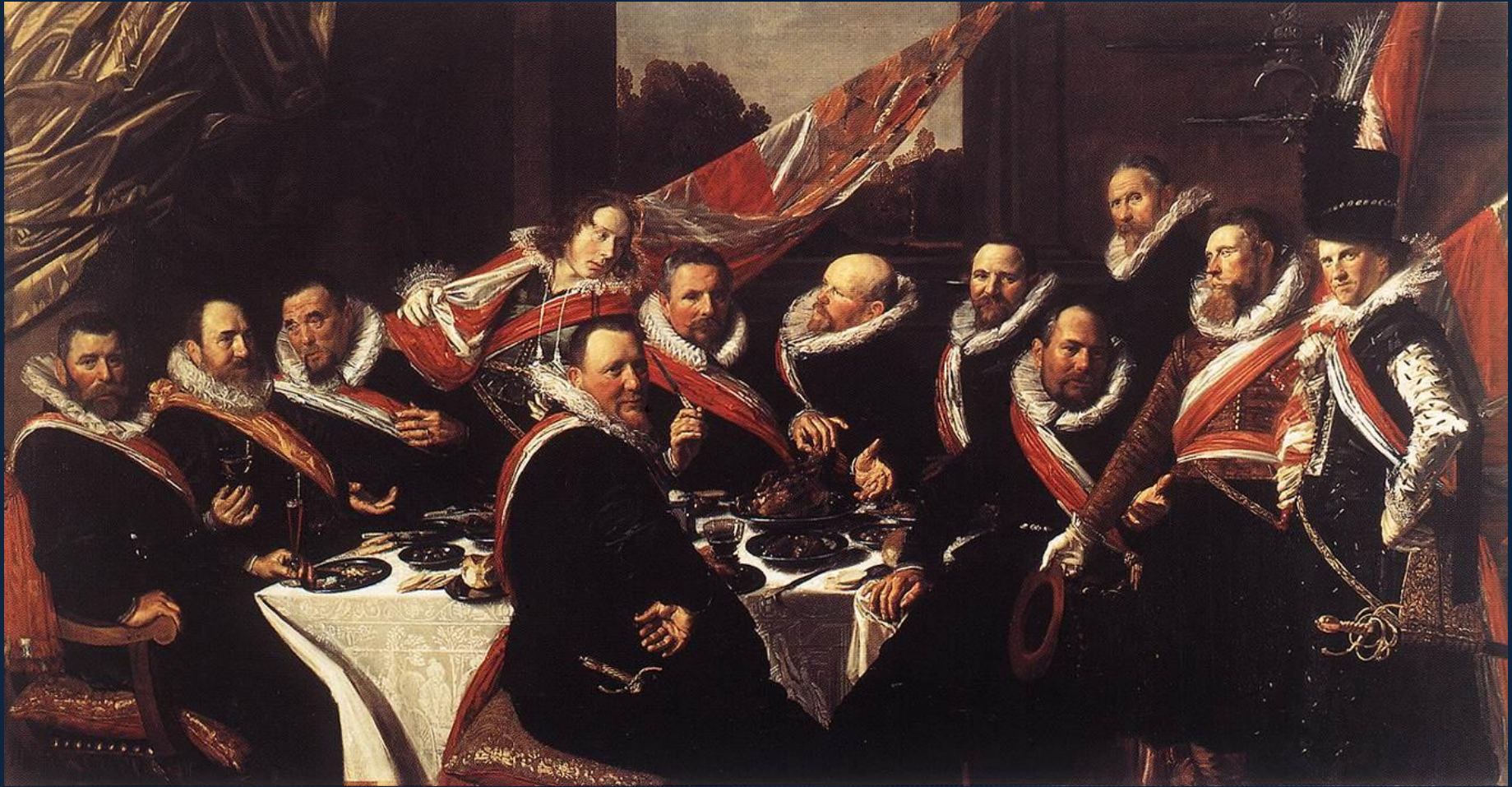
Frans Hals (1580-1666). Banquet of the Officers of the St George Civic Guard 1616 Oil on canvas, 175 x 324 cm Frans Halsmuseum, Haarlem