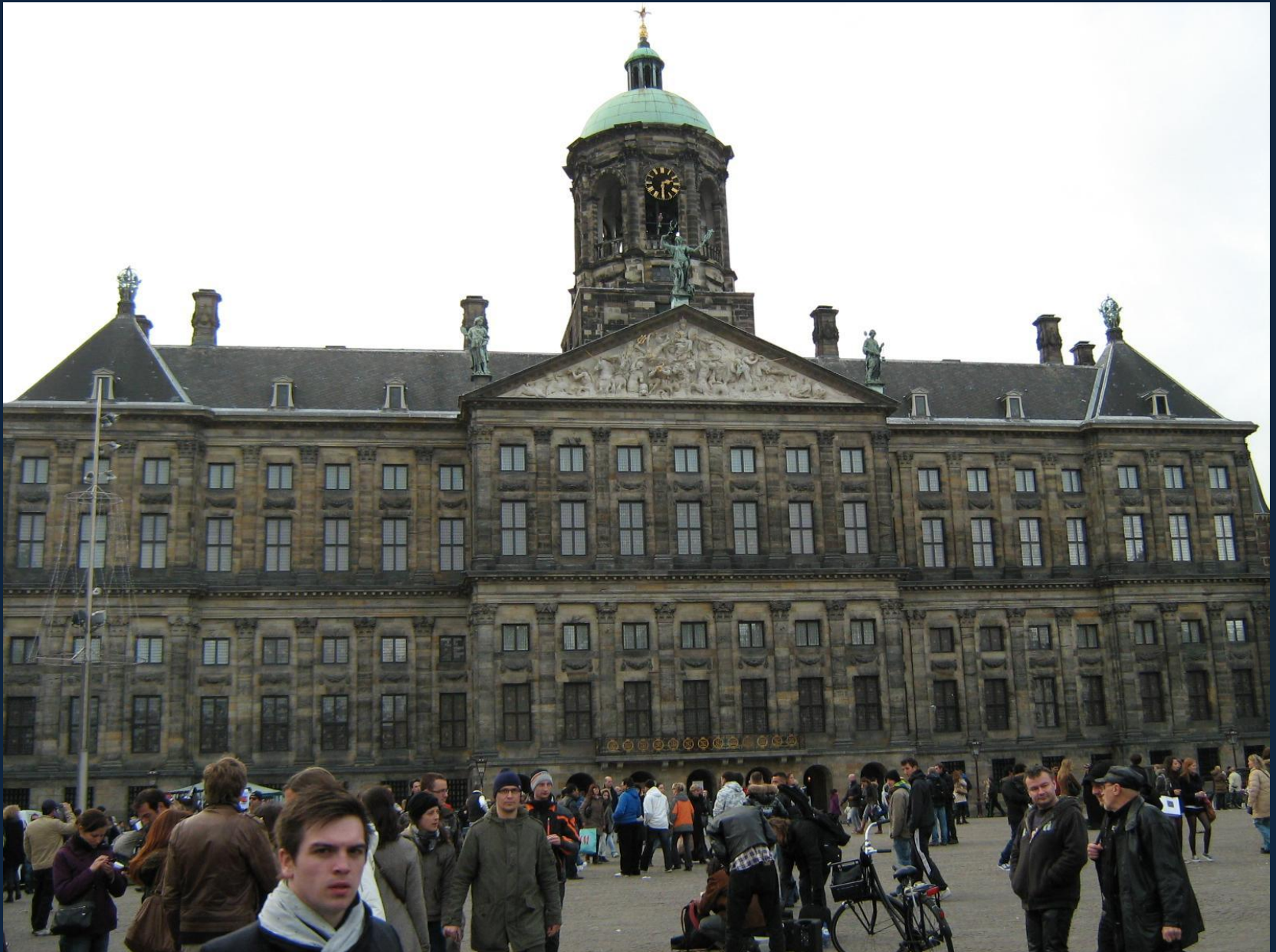
Якоб ван Кампен. Королевский дворец (нидерл. Koninklijk Paleis) . 1648-1655. До 1808 г. амстердамская резиденция