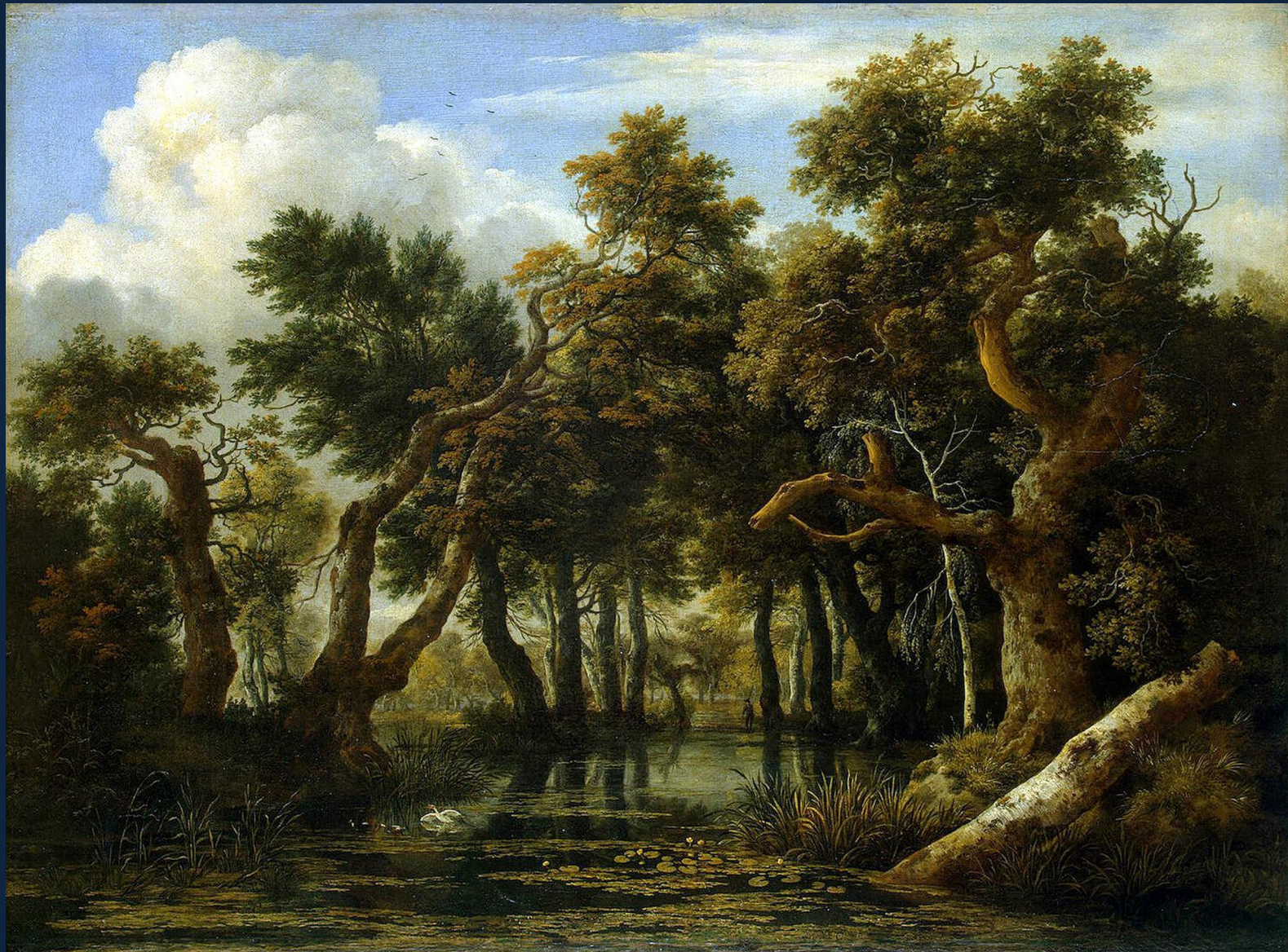
Якоб Рейсдал (1628-1682). Болото. 1660е. Х.,м. 72,5x99 см ГЭ