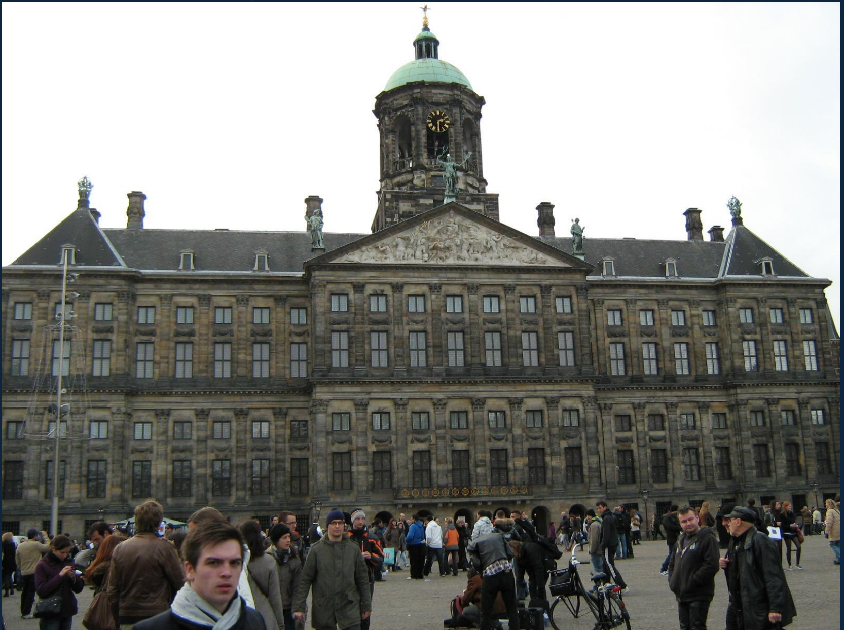
Якоб ван Кампен. Королевский дворец (нидерл. Koninklijk Paleis) . 1648-1655. До 1808 г. амстердамская резиденция