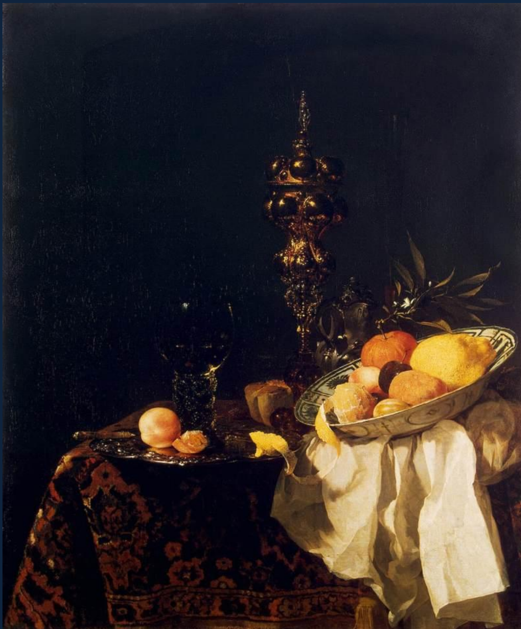
Willem Kalf (1619-1693), Still-Life . 1653-54 Oil on canvas, 105 x 88 cm The Hermitage, St. Petersburg