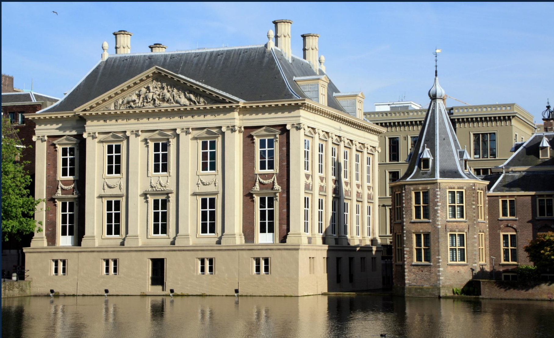
Якоб ван Кампен. Королевская галерея Маурицхейс в Гааге. 1633—1635 .