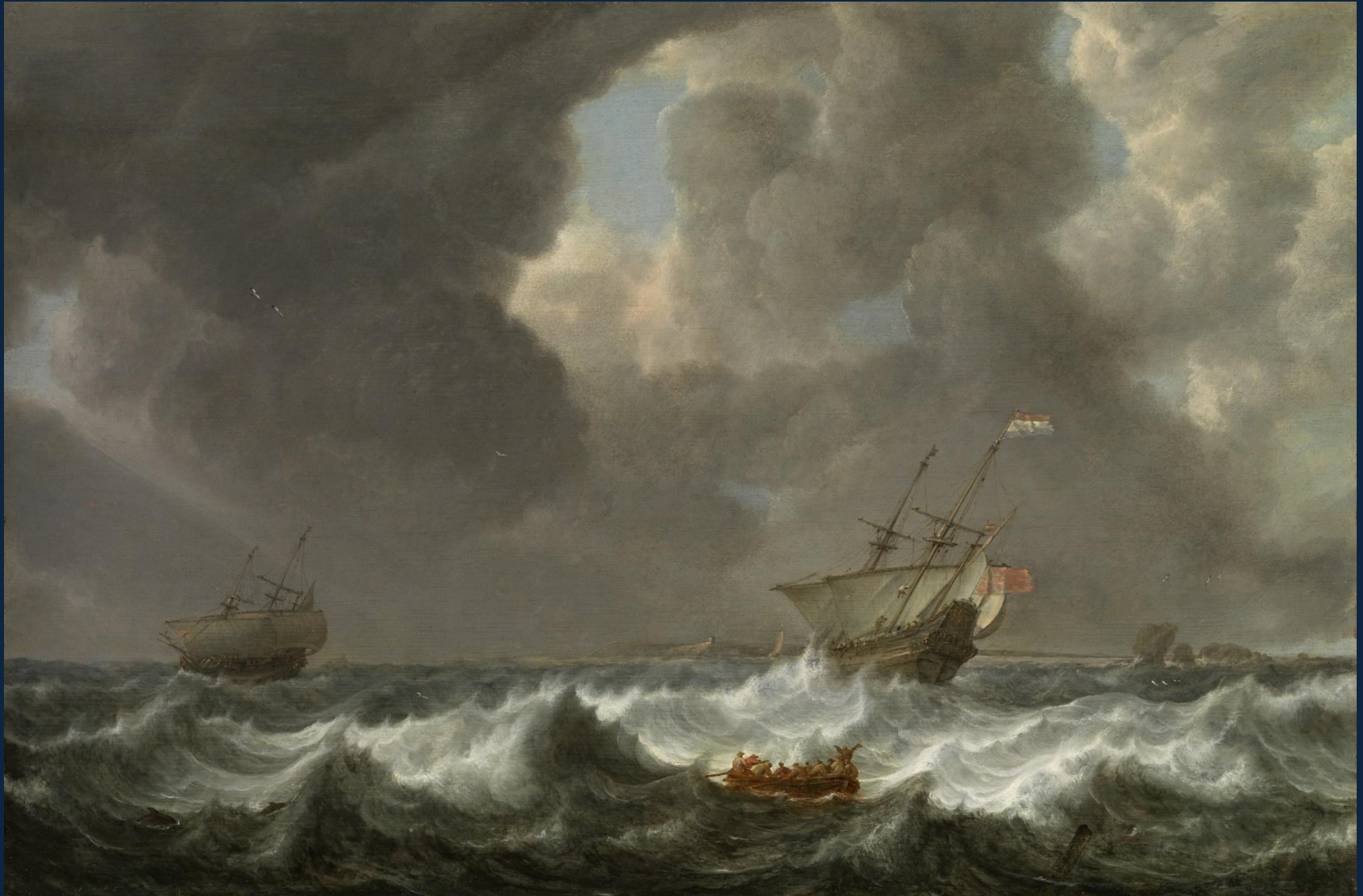
Simon de Vlieger (1601-1653) - Delft . Dutch Merchantmen in Rough Seas off a Rocky Coast, Oil on panel, 38.5 x 58 cm, Hohenbuchau Collection, on permanent loan to Liechtenstein, The Princely Collections, Vienna