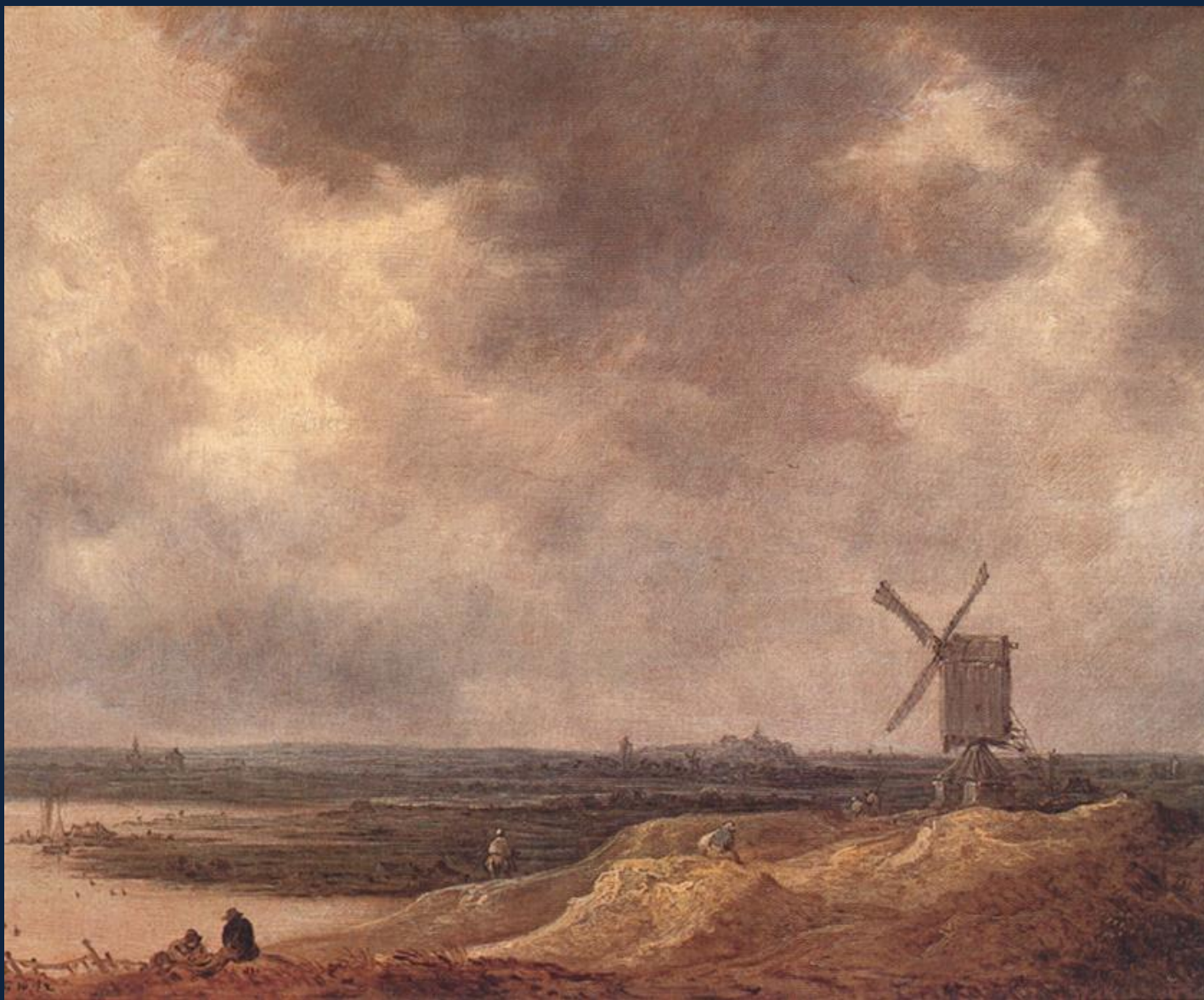
Jan van Goyen (1596-1656). Windmill by a River 1642 Oil on panel, 29,4 x 36,3 cm National Gallery, London