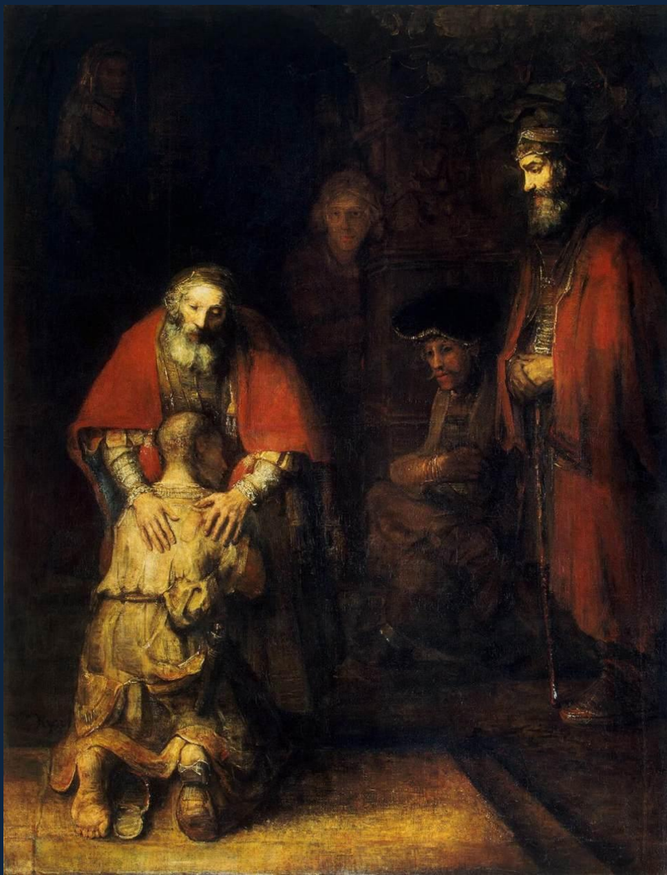
Рембрандт Харменс ван Рейн (1606-1669). The Return of the Prodigal Son. с. 1669. Oil on canvas, 262 x 206 cm The Hermitage, St. Petersburg