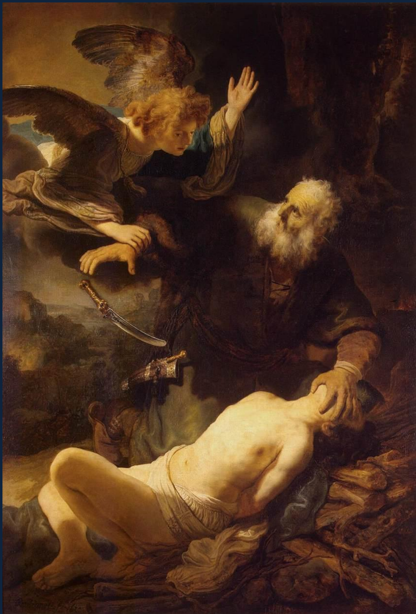
Рембрандт Харменс ван Рейн (1606-1669). The Angel Stopping Abraham from Sacrificing Isaac 1635 Oil on canvas, 193 x 132 cm The Hermitage, St. Petersburg