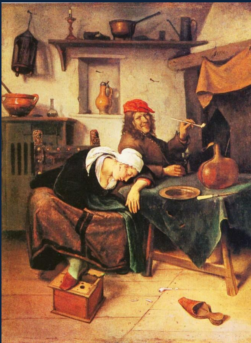
Ян Стен (1626-1679). Гуляки. 1660. 39 x 30 см, дерево, масло. ГЭ