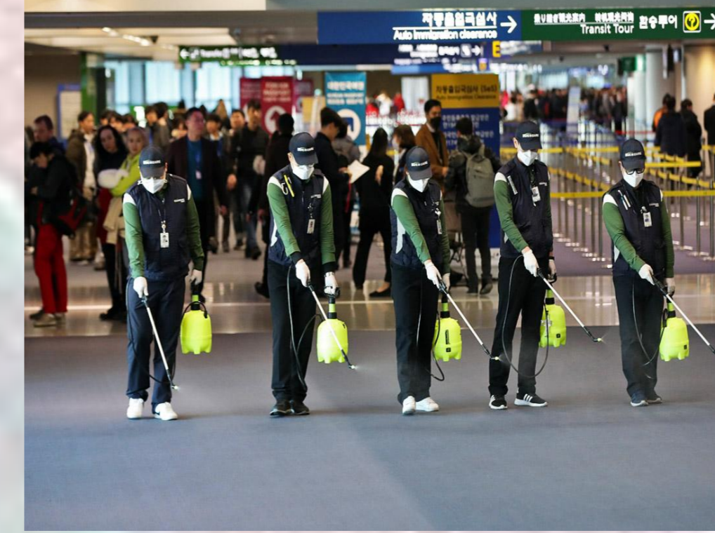
Также полным ходом развернута работа по дезинфекции мест общественного пользования.