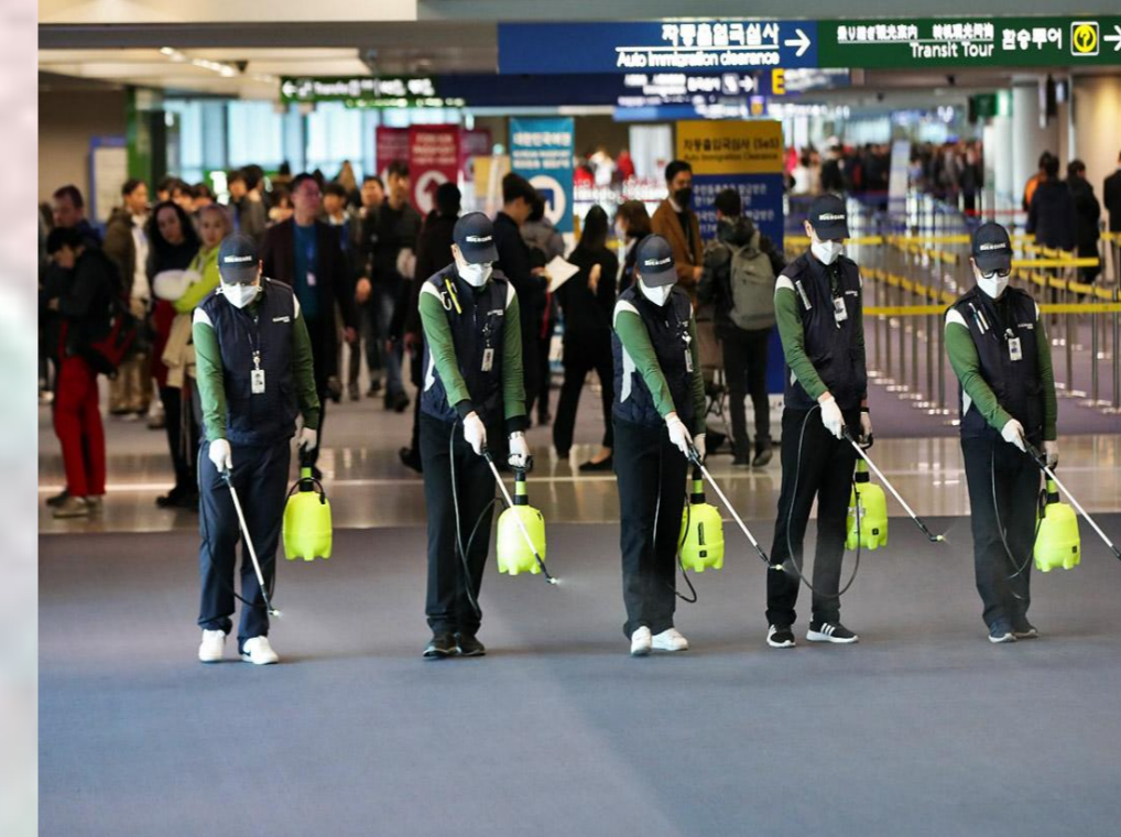
Также полным ходом развернута работа по дезинфекции мест общественного пользования.