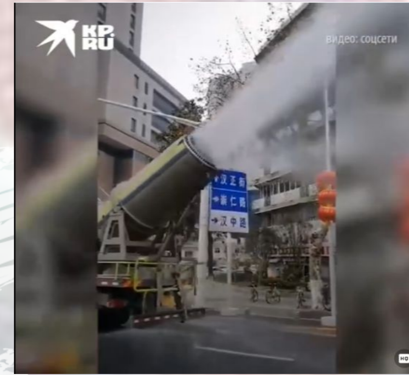
Улицы в Ухане обрабатывают дезинфицирующими средствами [3]