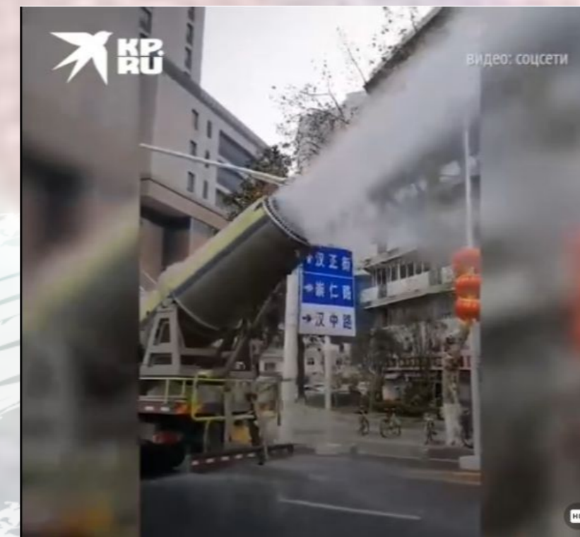
Улицы в Ухане обрабатывают дезинфицирующими средствами [3]