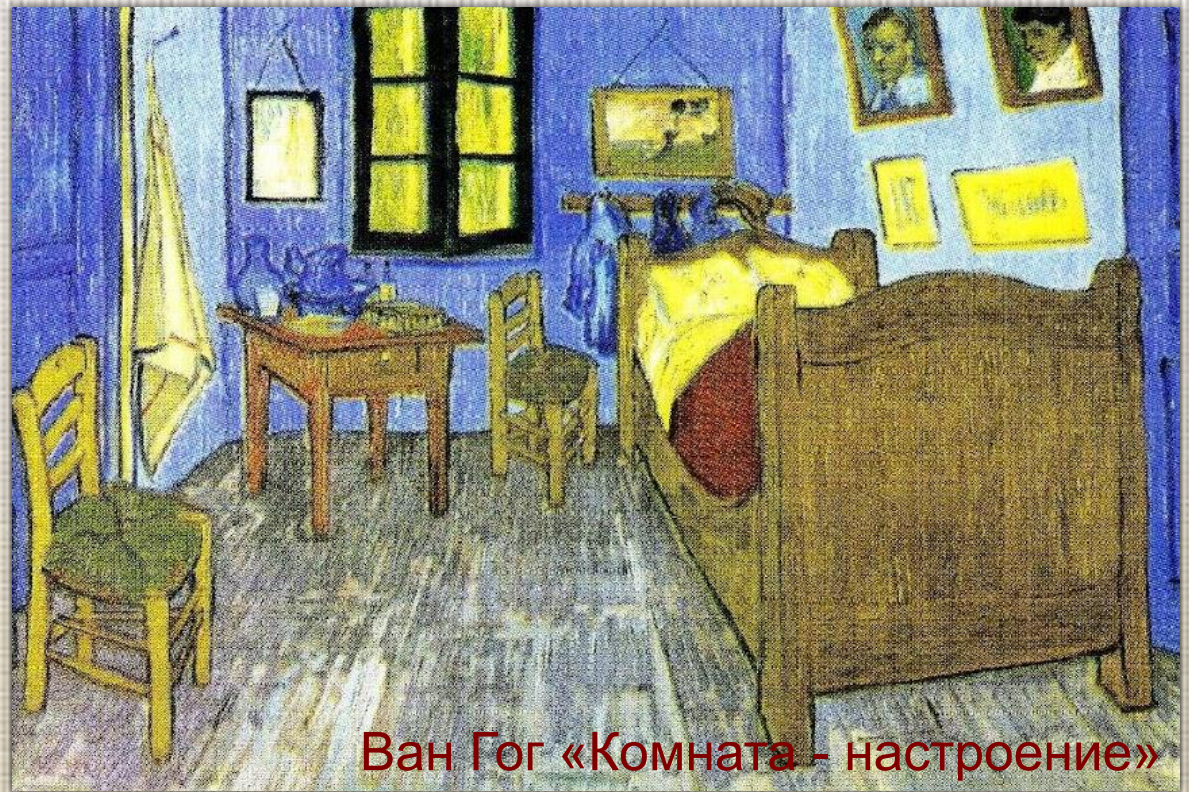
Ван Гог «Комната - настроение»