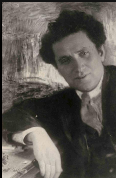
Г.Е. Зиновьев (Радомысльский)