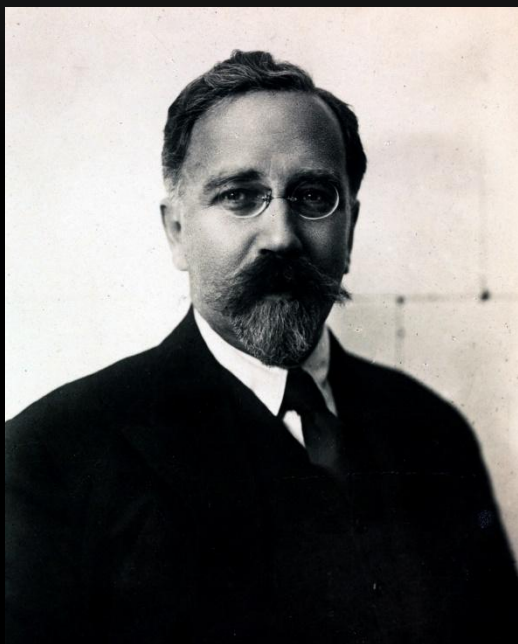
Л.Б. Каменев (Розенфельд)