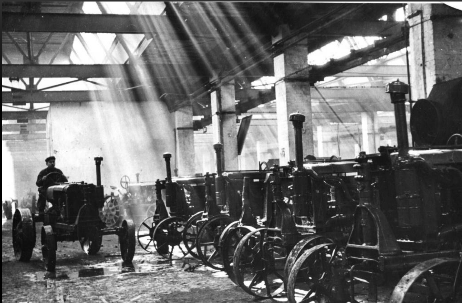
Сталинградский тракторный завод