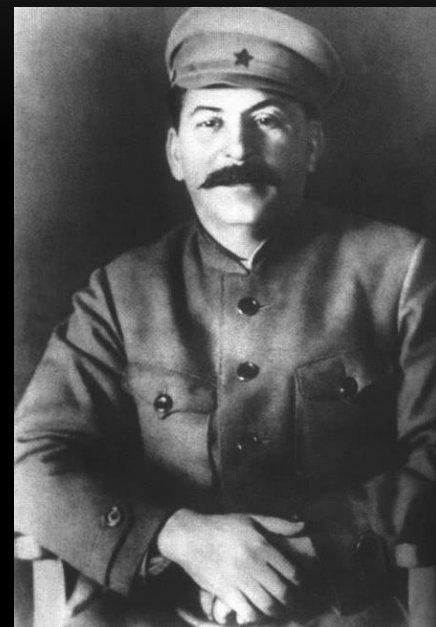
И.В. Сталин (Джугашвили)