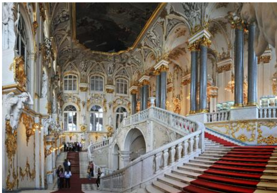
Санкт-Петербург, Зимний дворец