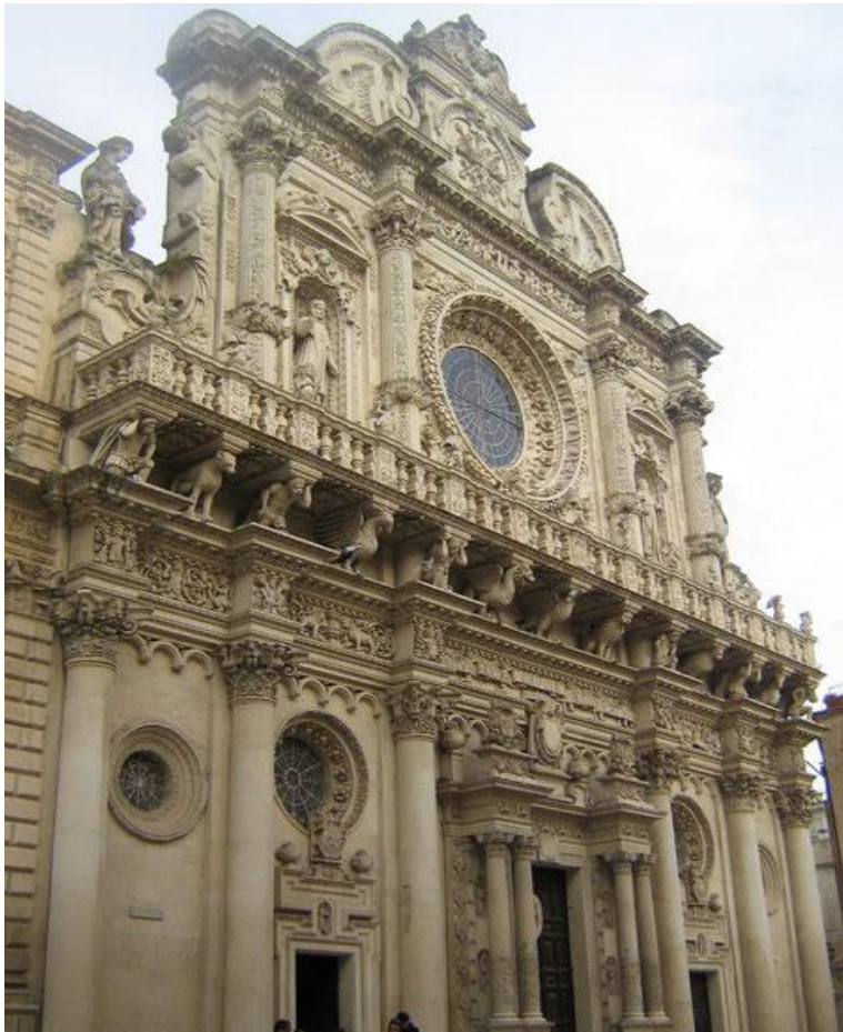
Италия, Базилика дель Санта Кроче.