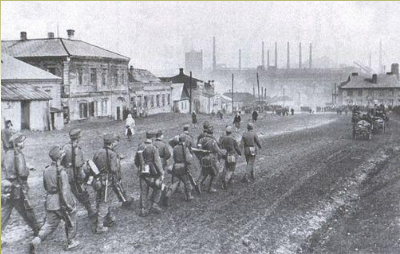
Гитлеровцы входят в Сталино . 1941.

В сводках Советского информбюро прозвучало сообщение об оккупации Донбасса 26 октября 1941г.