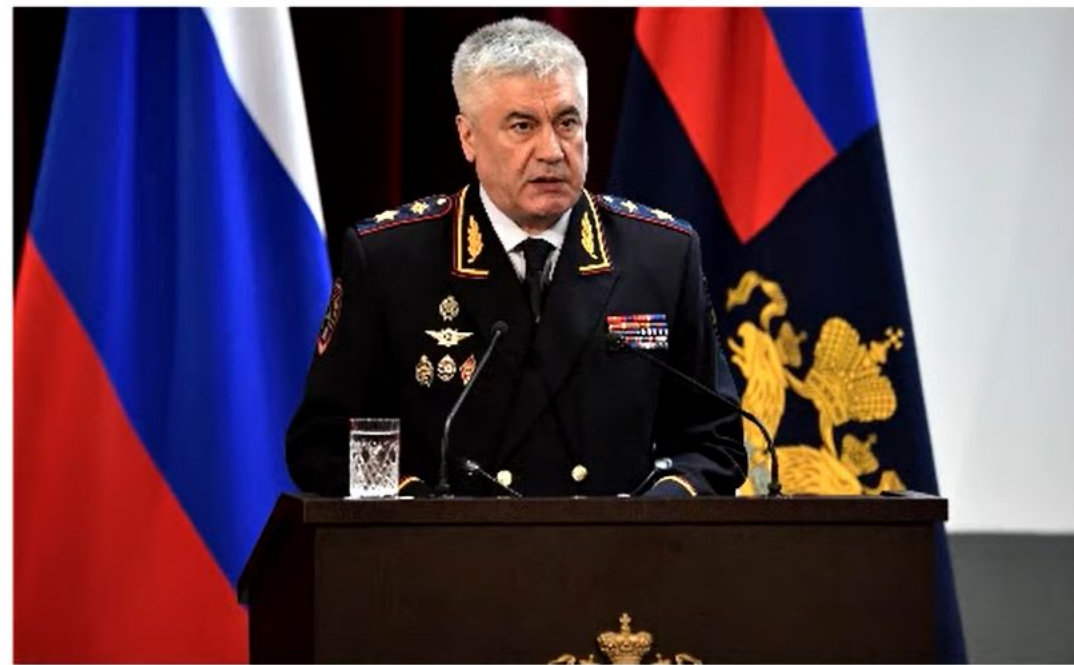
Министр МВД РФ Колокольцев В.А.