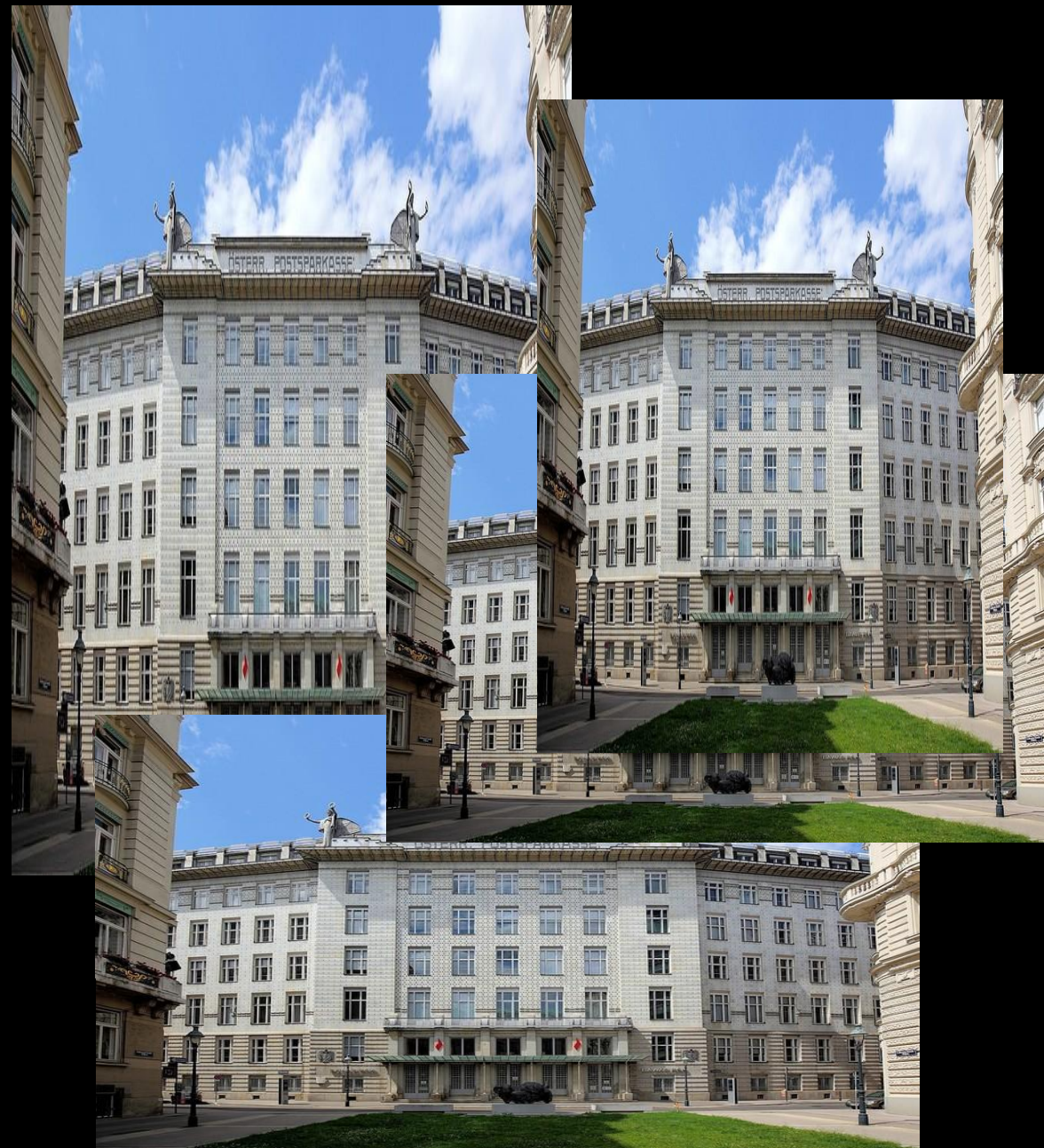
ПОЧТА ЖИНАҚ БАНКІНІҢ ҒИМАРАТЫ, ВЕНА, 1906