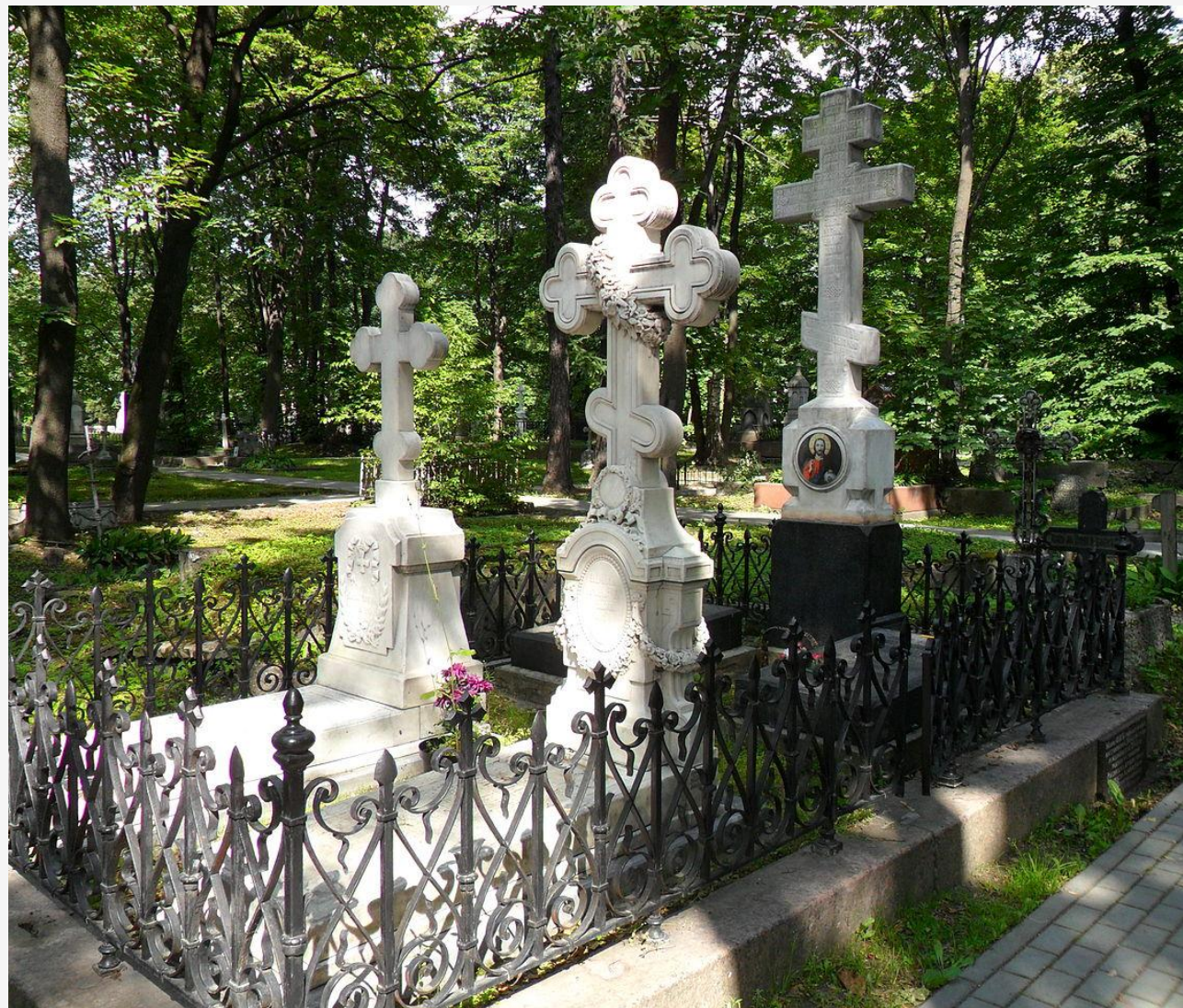
Могила Ф. И. Тютчева на кладбище Новодевичьего монастыря в Санкт-Петербурге

Федор Иванович умер 15 июля 1873 года в Царском Селе. После себя Тютчев оставил немногим более 400 стихотворений.