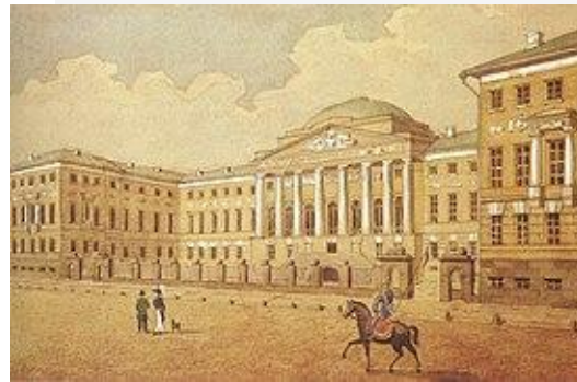
Императорский Московский университет