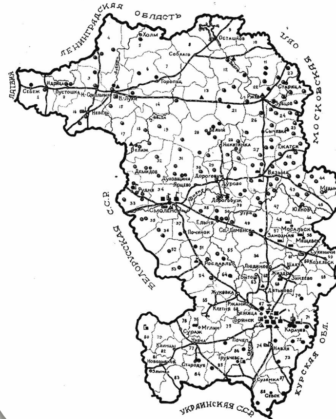
Схема Западной области 1934 г.