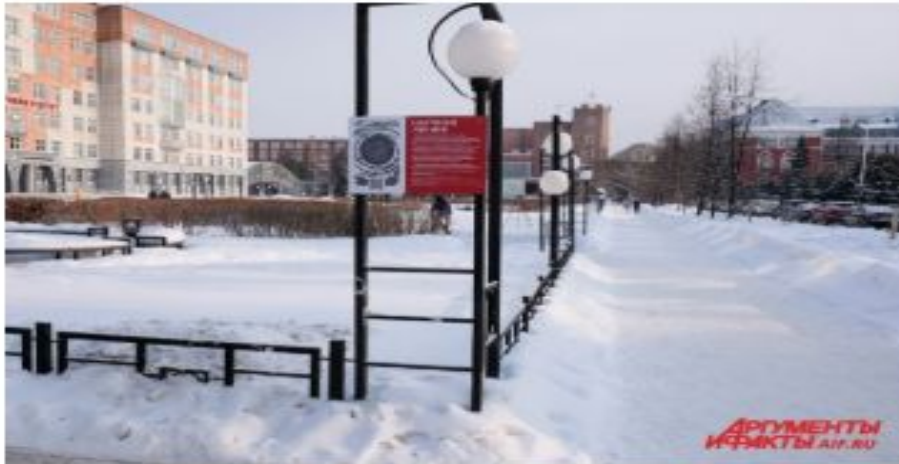
Учебный процесс приостановили с 16 марта.