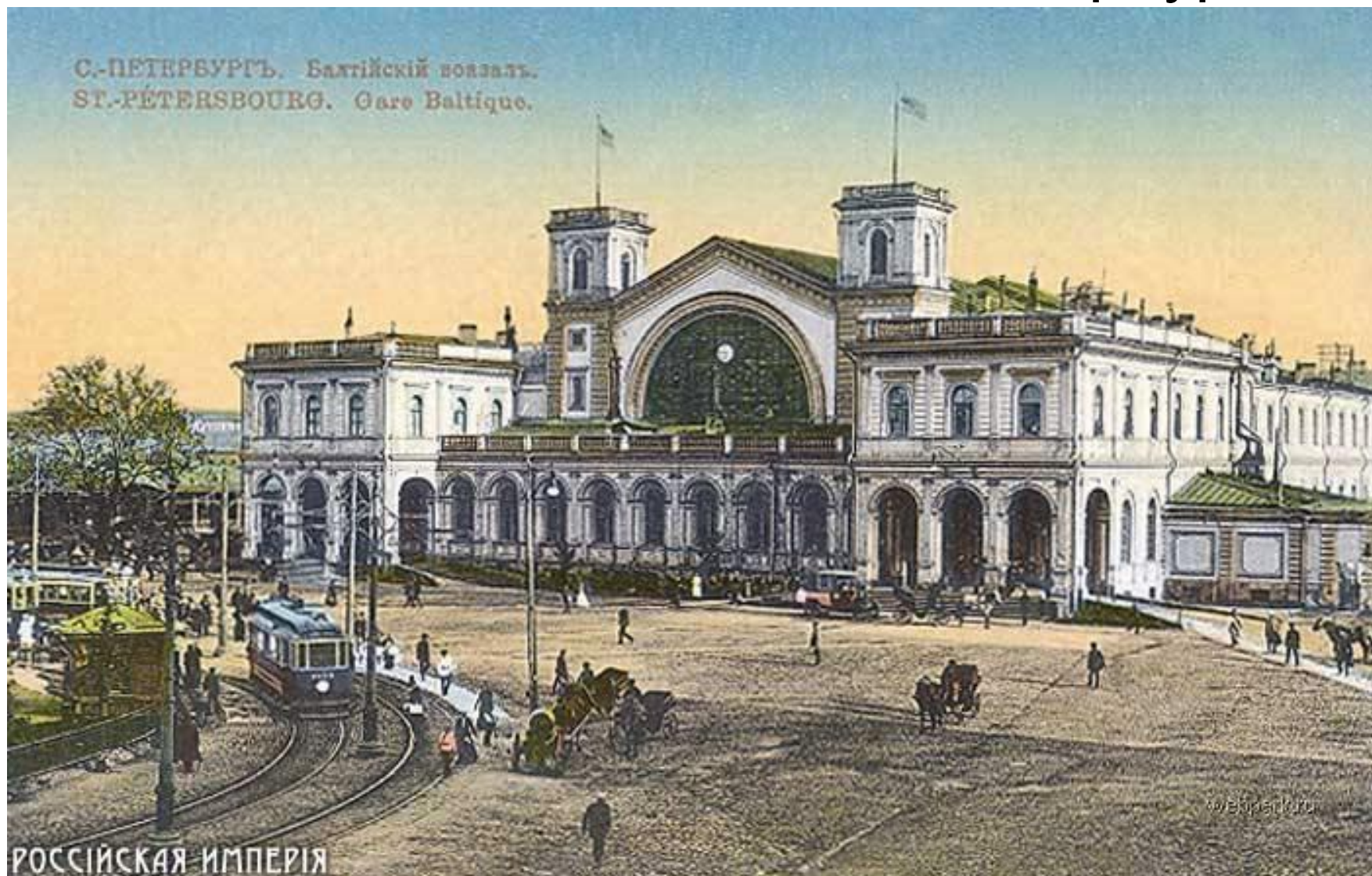
А. И. Кракау 1857 г.