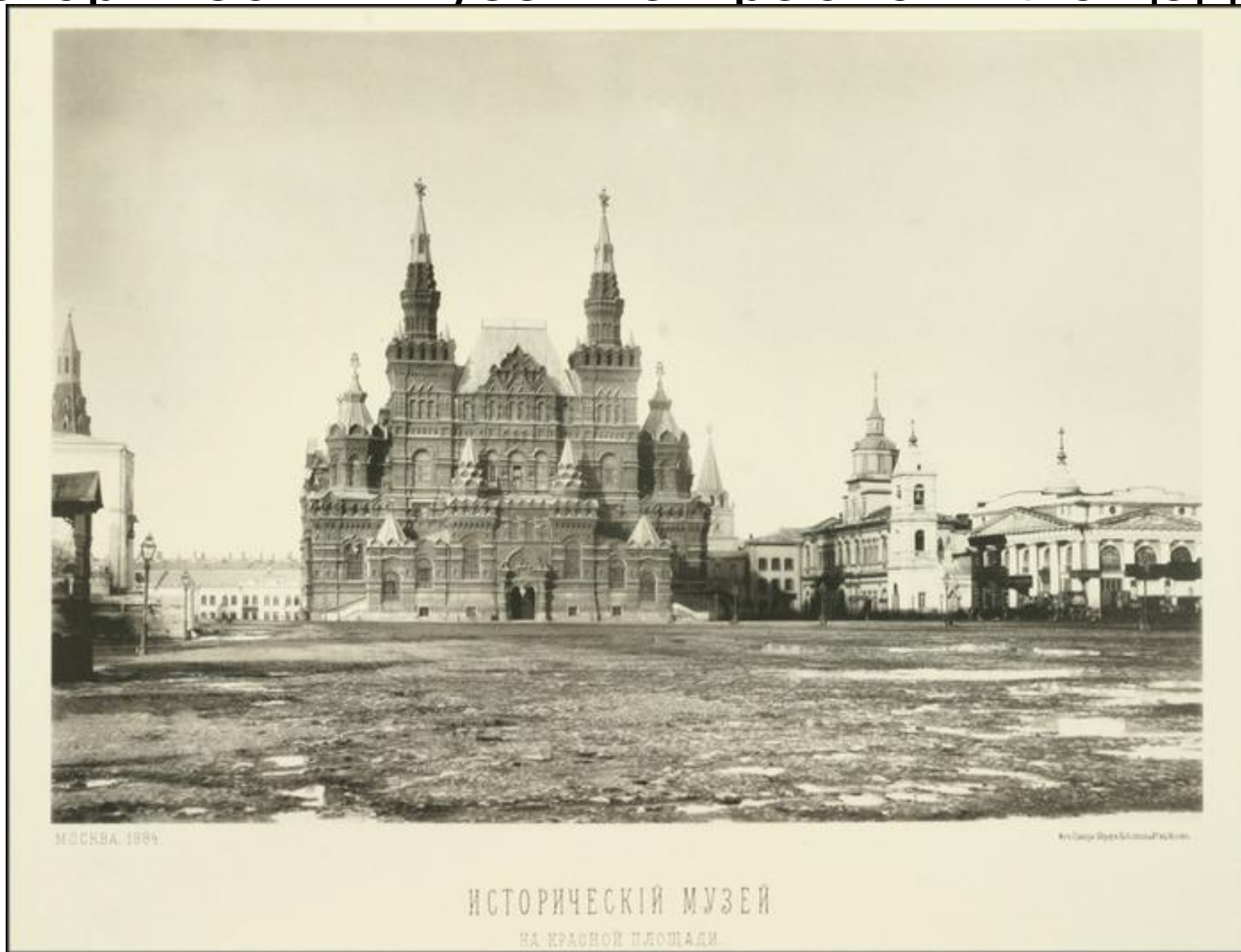
В. О. Шервуд 1875-1883 г.