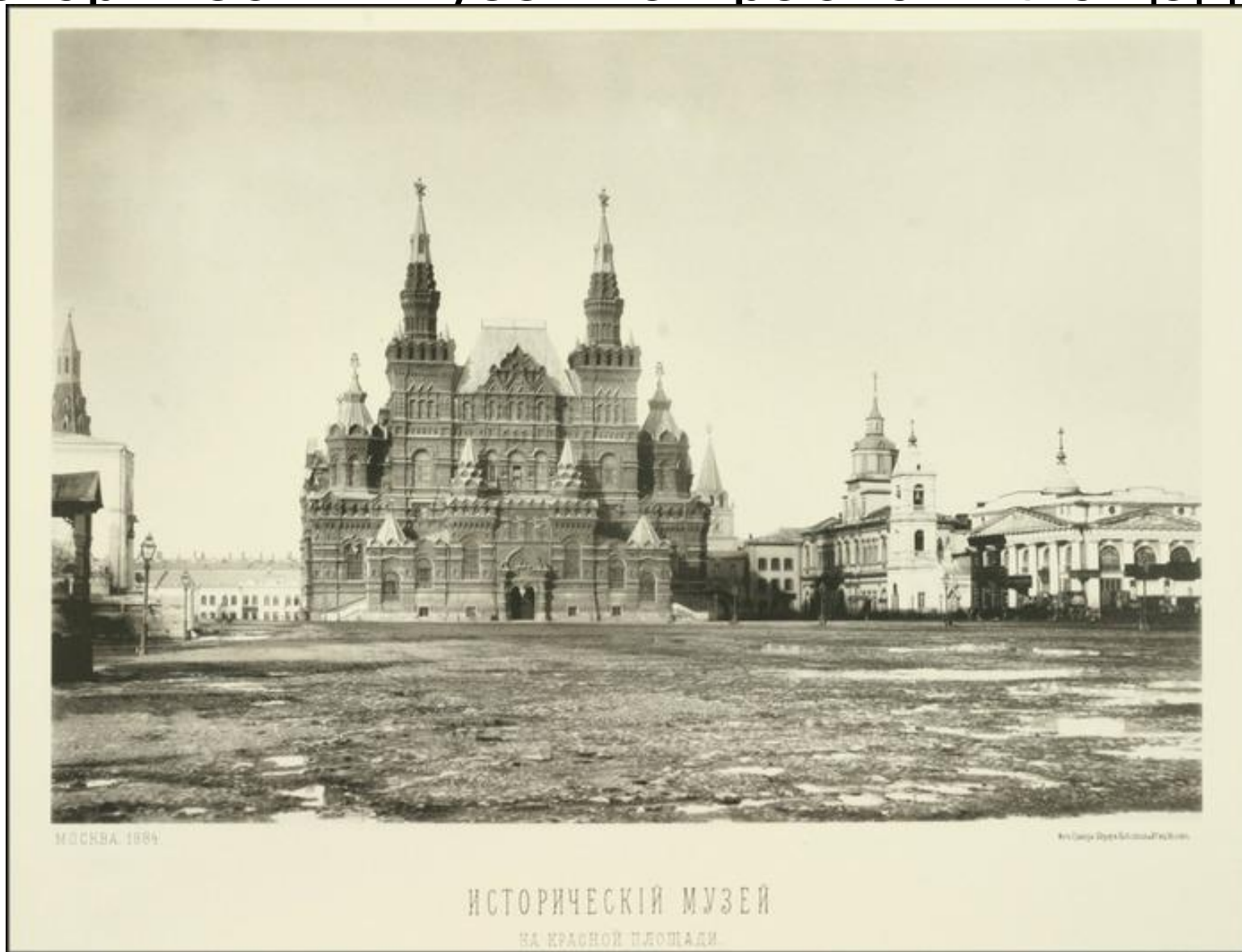
В. О. Шервуд 1875-1883 г.