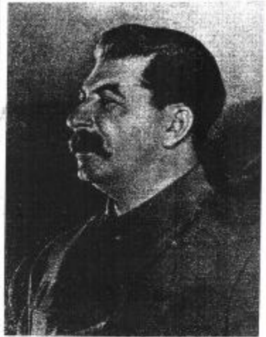
Указ Президиума Верховного Совета СССР О ВОЕННОМ ПОЛОЖЕНИИ

В соответствии с указом Президиума Верховного Совета СССР от 22 мая 1942 года вступают в силу положения Военного Положения о воинском положении граждан СССР и о воинском положении граждан СССР.