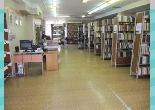
Отдел художественной литературы