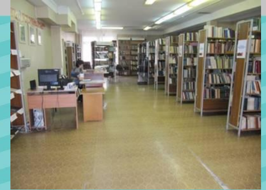
Отдел художественной литературы