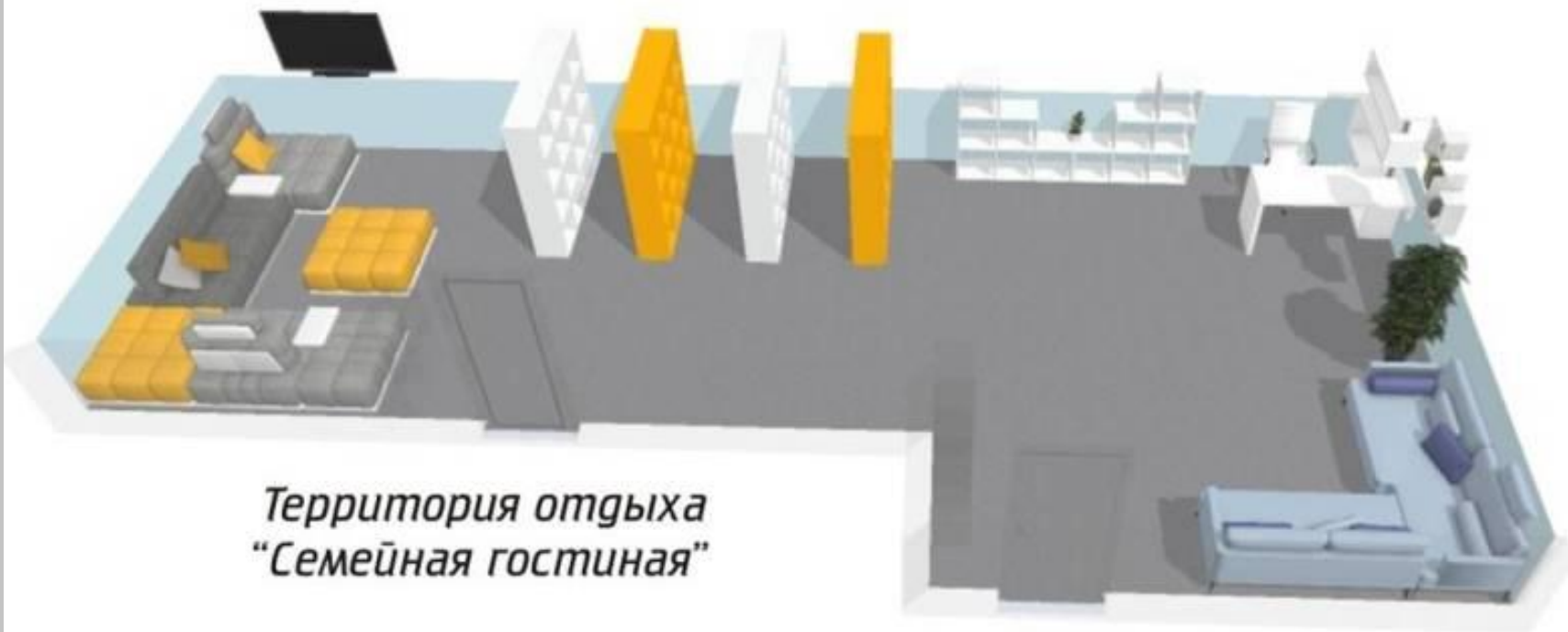
Территория отдыха "Семейная гостиная"