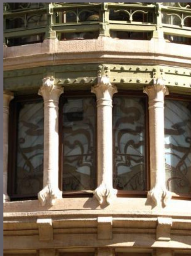
Дом Тасселя, Бельгия