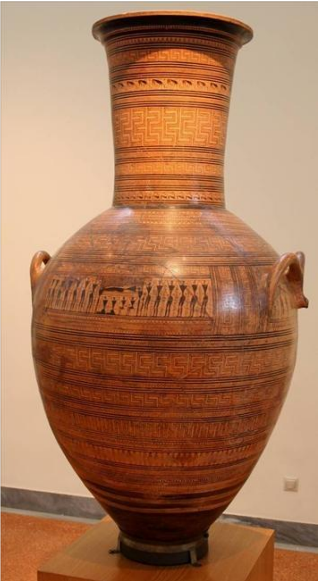
Надгробная аттическая амфора из Дипилона. Ок. 760—750 гг. до н. э.