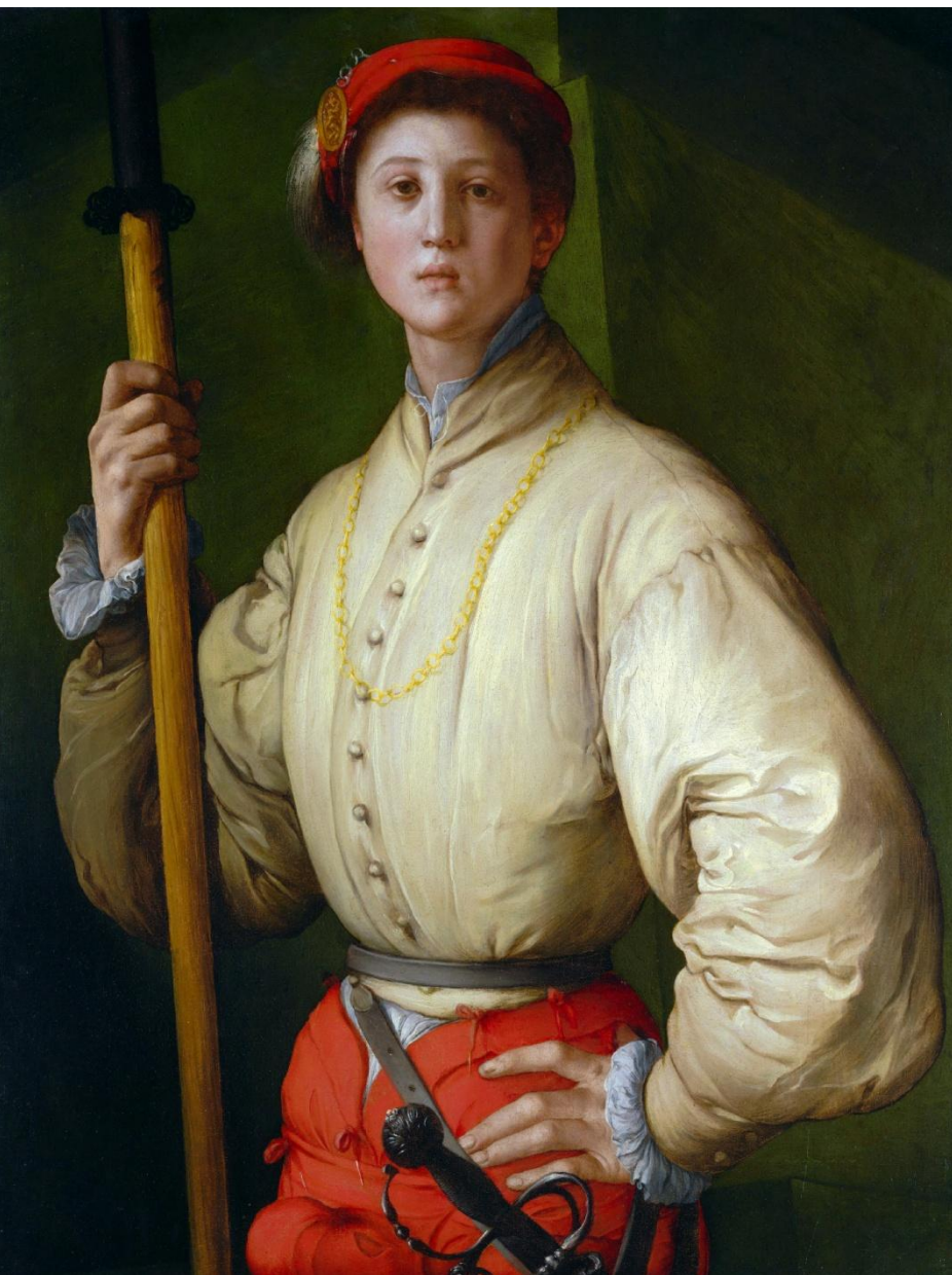
Франческо Гварди как алебардщика 1528-30 1532