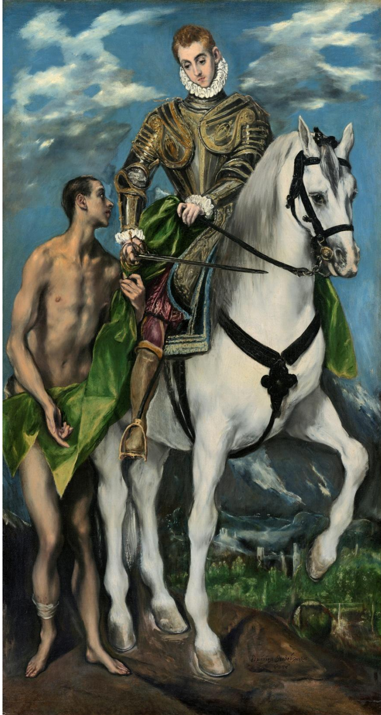
Эль Греко – Св. Мартин и нищий 1597-99