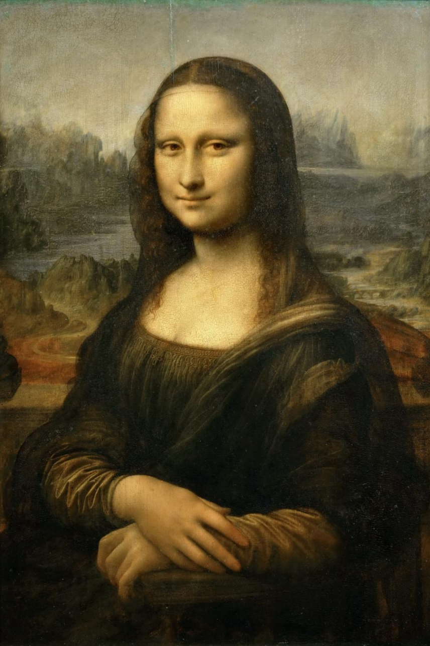
Возрождение Леонардо да Винчи – Мона Лиза