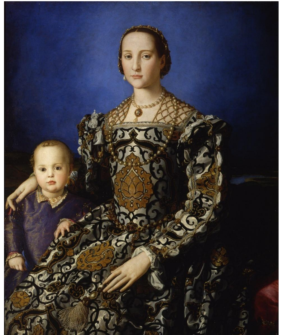
Элеонора Толедская с сыном Джованни