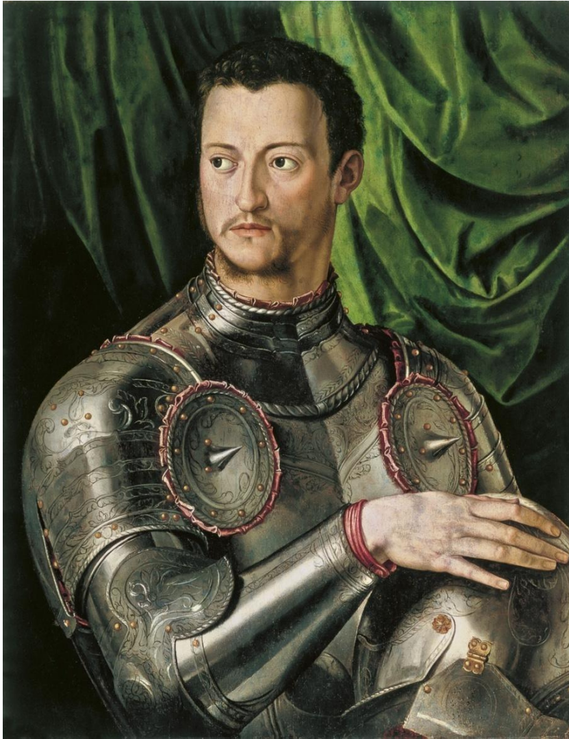
Козимо Медичи в латах 1545 1545