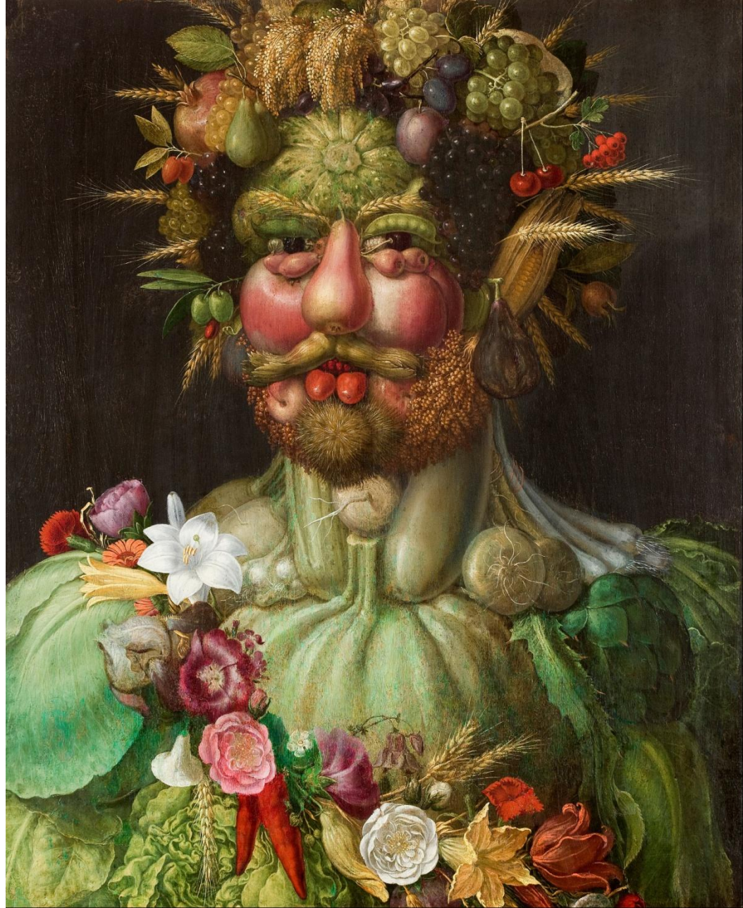
Арчимбольдо - Автопортрет 1570