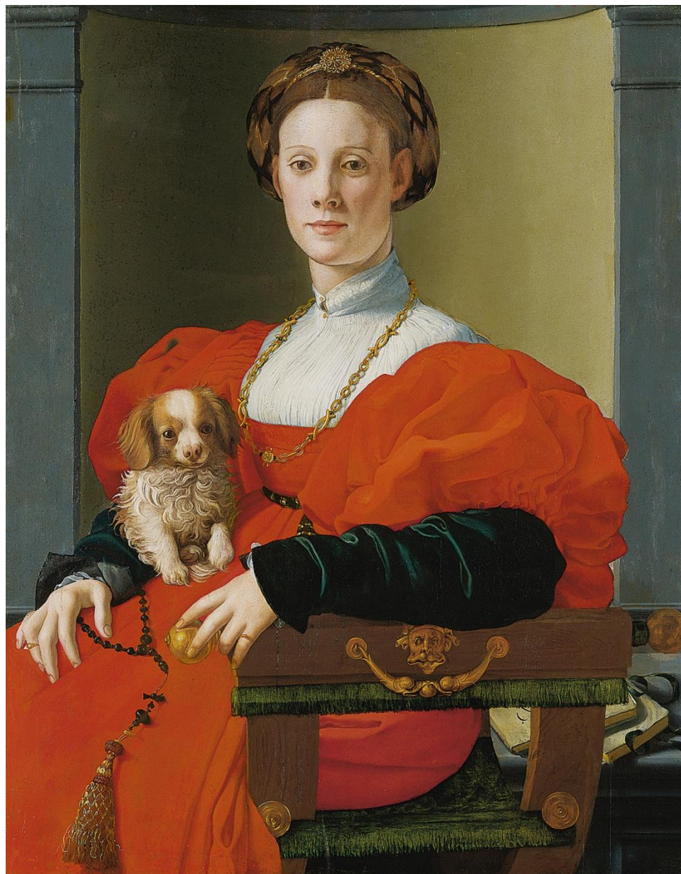
Женщина в красном