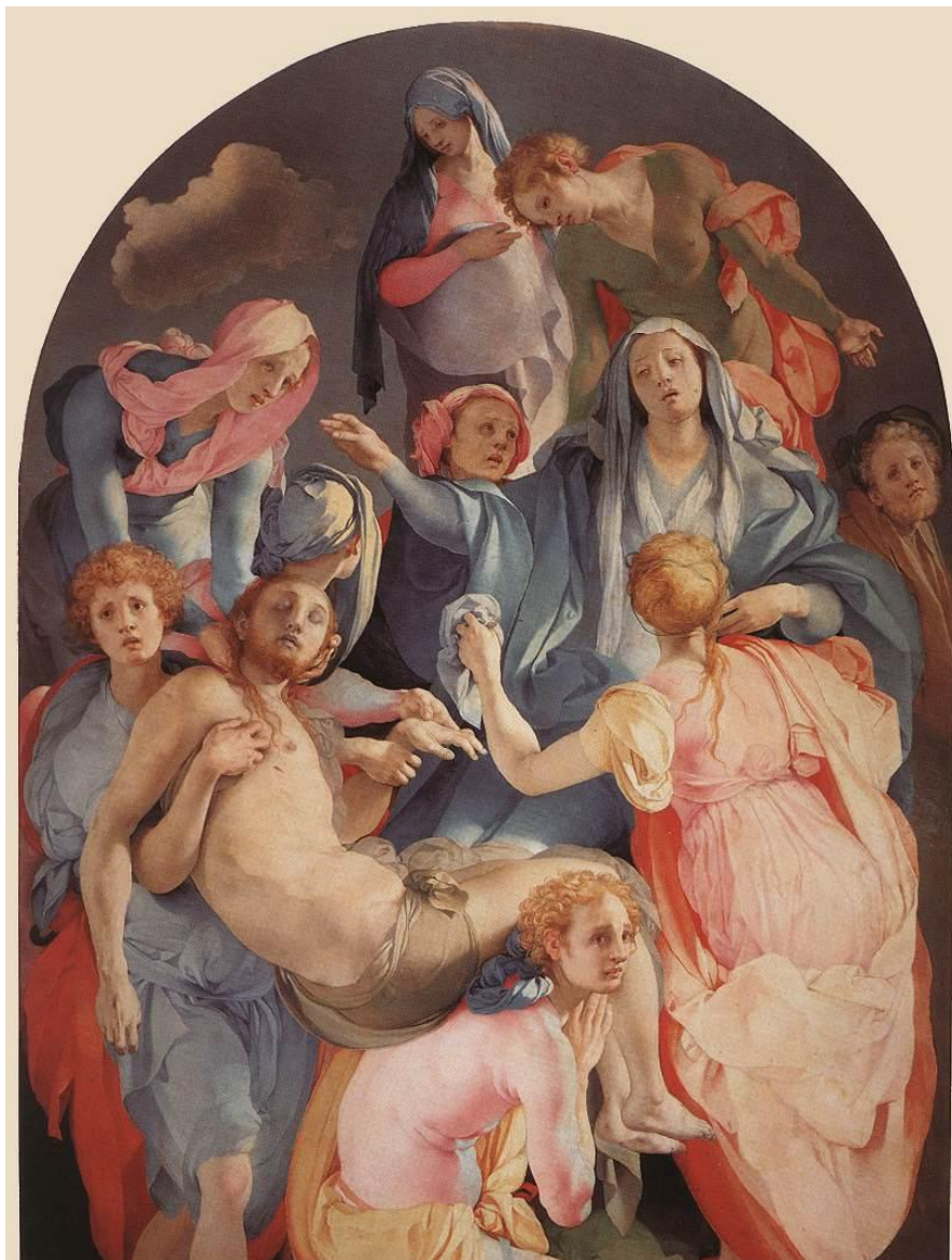
Снятие с креста