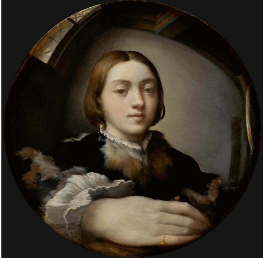
Автопортрет в выпуклом зеркале