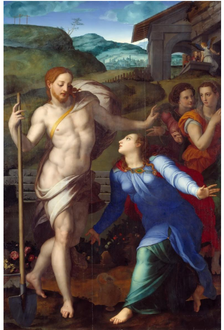
Не прикасайся 1561