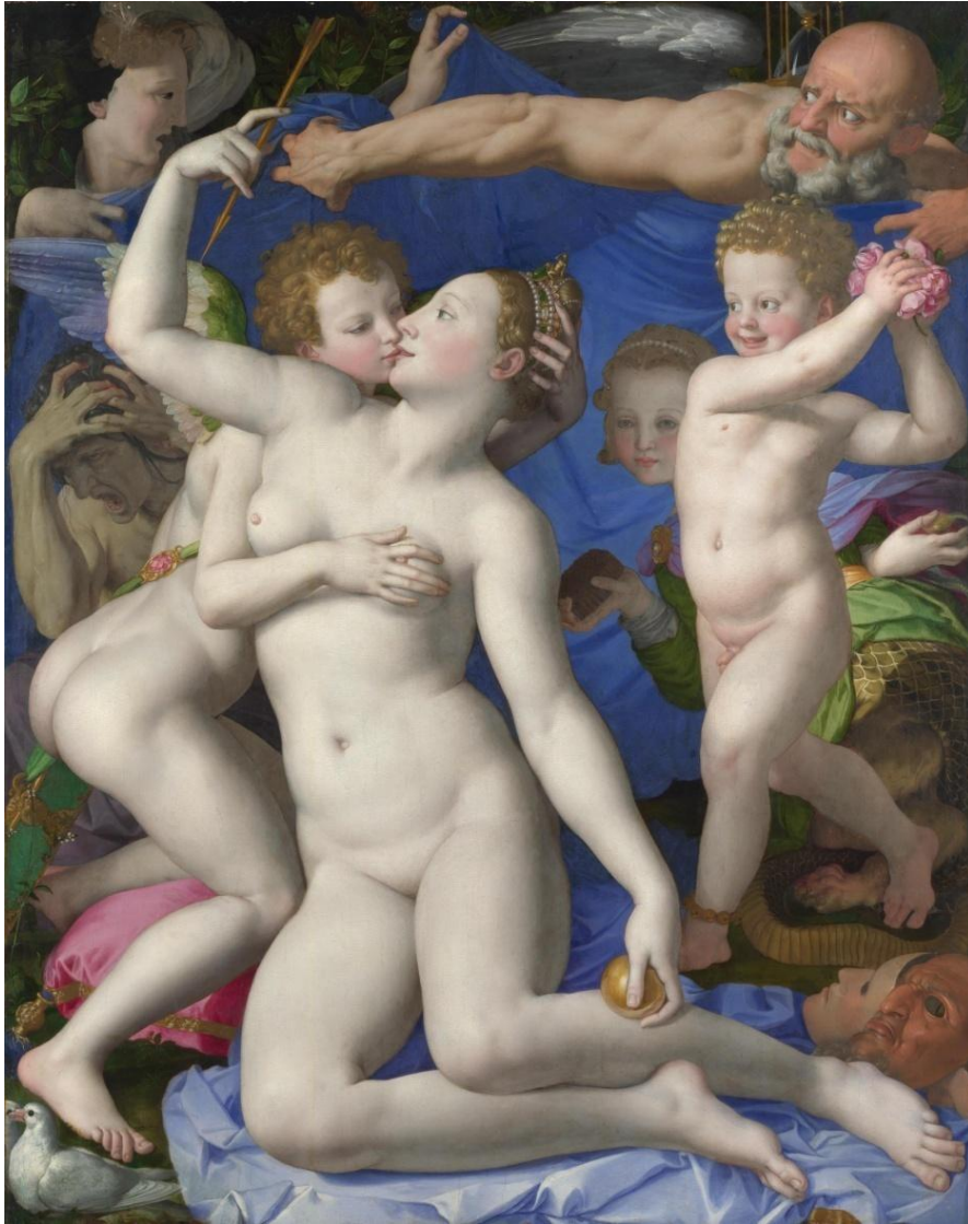
Аллегория (Венера, Купидон и Время) 1545