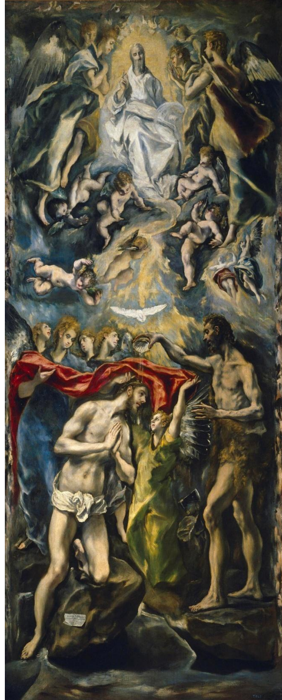
Эль Греко – Крещение 1596