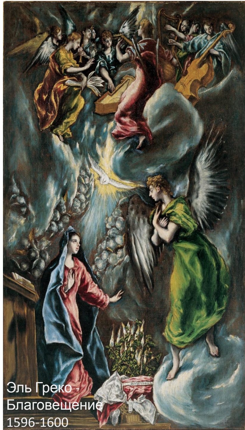
Эль Греко - Благовещение 1596-1600