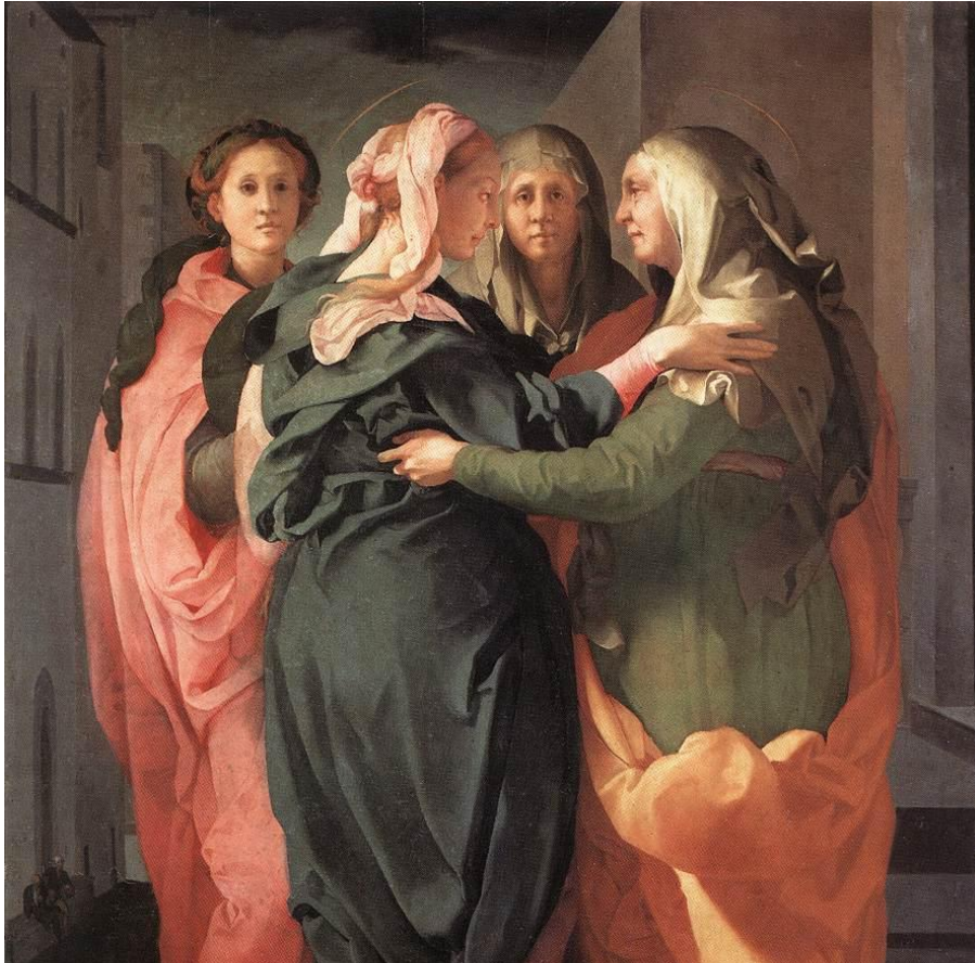
Встреча Марии и Елизаветы 1529