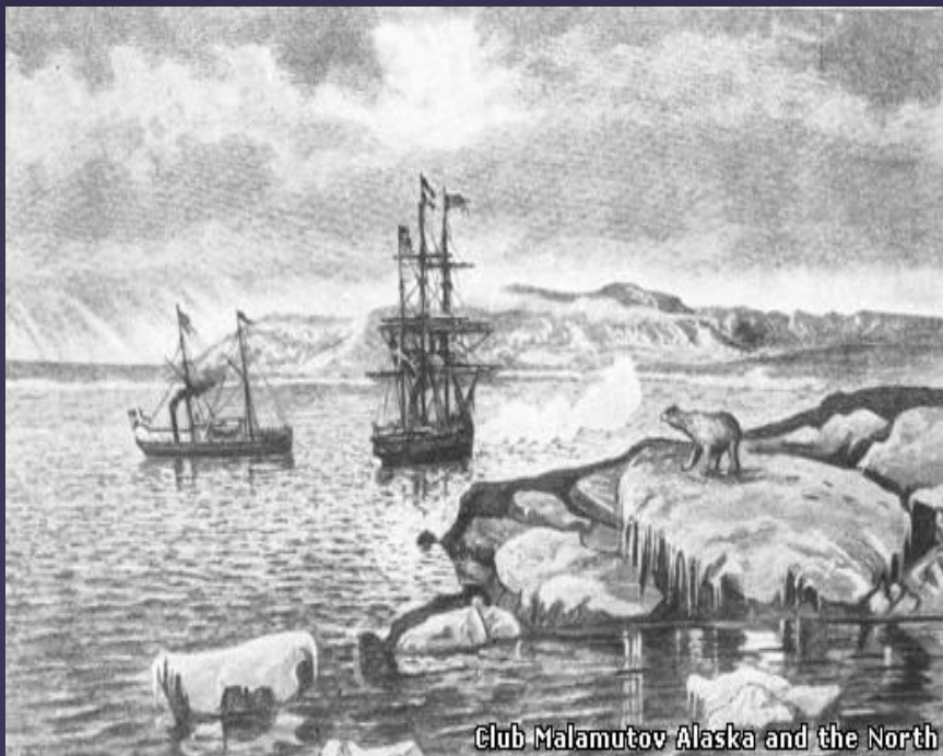
Club Malamutov Alaska and the North