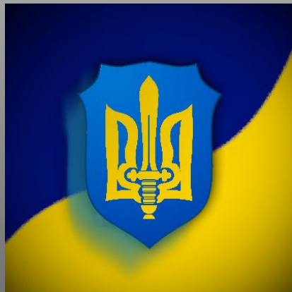
ДАНЯ UKRANIANbo i