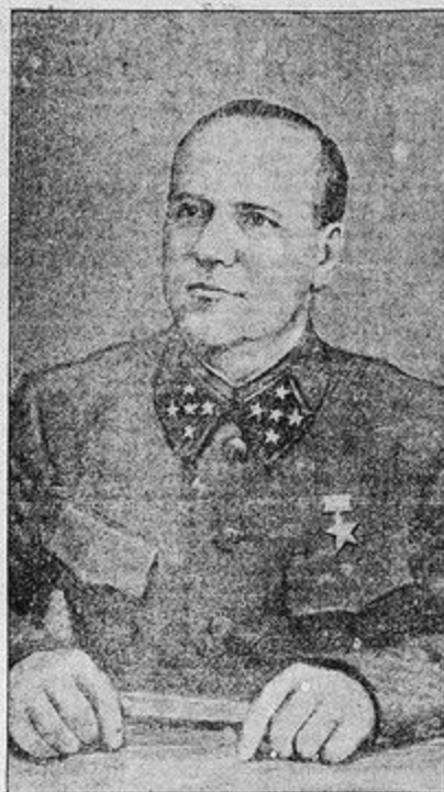
Командующий Западным фронтом генерал армии Г. К. Жуков.