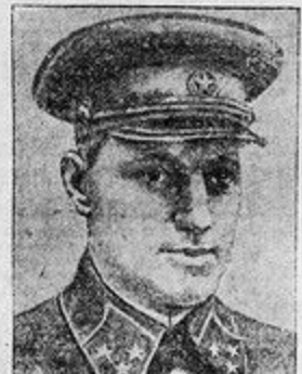
Генерал-лейтенант К. К. Рокоссовский.