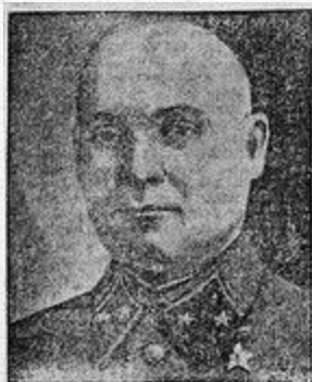
Генерал-майор Д. Д. Делощенко.