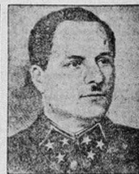
Генерал-лейтенант Н. В. Болдин.