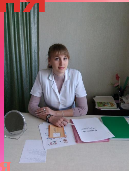
Підготовка до заняття